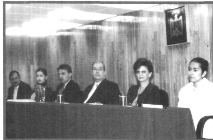
LA CARRERA DE ADMINISTRACIÓN DE INSTITUCIONES REALIZÓ EL TERCER CONGRESO “EXPLOTA TUS IDEAS”, DONDE SE DIERON CITA LOS MEJORES CONFERENCIISTAS DE LA RAMA GASTRONÓMICA Y HOTELERA

Finalmente el director del departamento felicitó a los organizadores del evento, así como a los alumnos que asistieron al congreso.