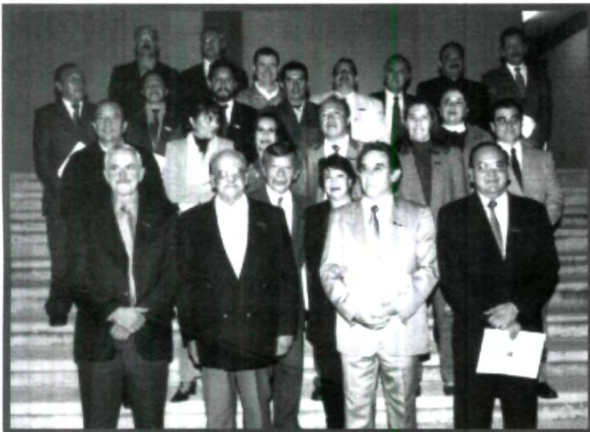
ALUMNOS Y MAESTROS DE LA GENERACIÓN FUNDADORA DE ARQUITECTURA DE LA UPAEP, 1973-1977.