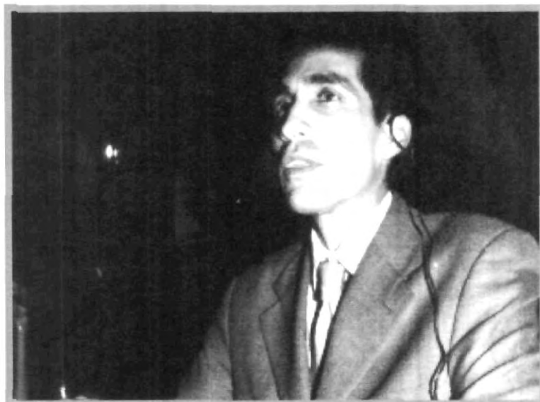
DENTRO DE LA CONFERENCIA SE EXPLICÓ QUE LOS VASOS, JARRAS Y JARRONES PULQUEROS, SON UTENSILIOS DE ORIGEN CIENTO POR CIENTO PREHISPÁNICO

Además, el conferencista indicó que el tomar pulque no es como tomar agua, ya que el pulque es un fermentado que ayuda a la digestión, en especial para las personas que comen alimentos muy condimentados "...el pulque hace que el PH de la boca sea neutro y permite saborear mejor los alimentos".