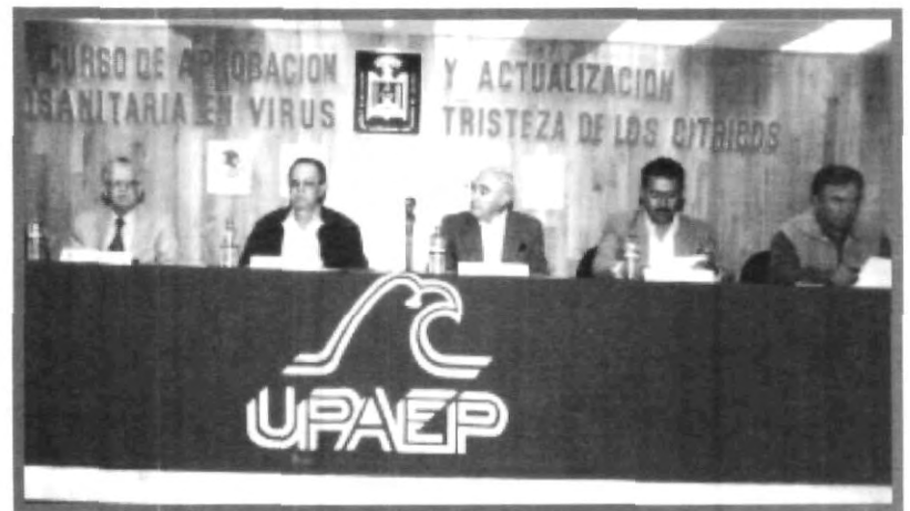
LA CARRERA DE AGRONOMÍA REALIZÓ EL CURSO DE APROBACIÓN Y ACTUALIZACIÓN SANITARIA EN VIRUS TRISTEZA DE LOS CÍTRICOS

aprobación y actualización en VTC participan técnicos y productores de todo el país, para que haya gente capacitada que apoye las acciones y prevenga la enfermedad en los árboles del país.