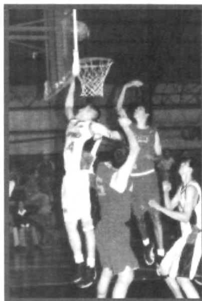
NUEVAMENTE LAS ÁGUILAS UPAEP SE COLOCARON EN EL TRONO DEL REY, YA QUE DERROTARON A LOS MADERISTAS