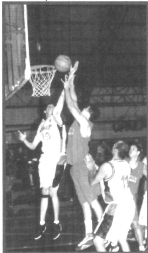
LAS ÁGUILAS SE COMENZARÁN A PREOCUPAR, PUESTO QUE VIENE EL CLÁSICO CON LA UDLAP

muscular que lo alejó de las canchas desde el juego contra el Tepeyac.