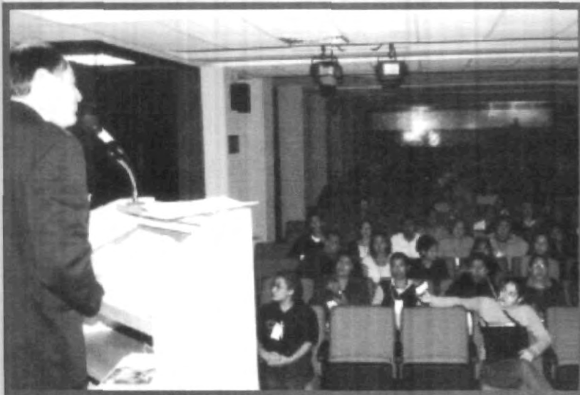
EL DIRECTOR DE TURISMO MUNICIPAL IMPARTIÓ CONFERENCIA EN EL MARCO DEL TERCER CONGRESO DE ADMINISTRACION DE INSTITUCIONES

La falta de coordinación de las autoridades y el poco apoyo del sector privado ocasionan la nula promoción del turismo del estado de Puebla