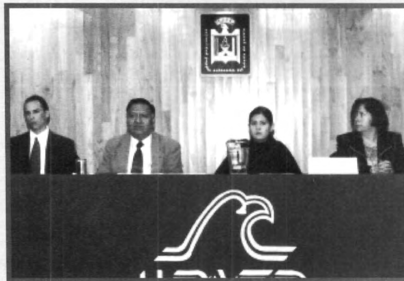
EL CICLO DE CONFERENCIAS TITULADO "SEMANA POR LA VIDA" ORGANIZADO POR EL GRUPO DE PARTICIPACIÓN EUVIDA, PERMITIÓ QUE LOS ALUMNOS UPAEP CONOCIERAN MÁS ACERCA DE LAS PROBLEMÁTICAS A LAS QUE SE ENFRENTAN LOS JÓVENES EN LA ACTUALIDAD

Muchas felicidades a los grupos organizadores de este magno evento, que sirvió para que muchos jóvenes conocieran el valor de la vida, así como para aclarar dudas sobre el tema. Esperamos que muy pronto el grupo EUVIDA nos pueda brindar otro evento como este.