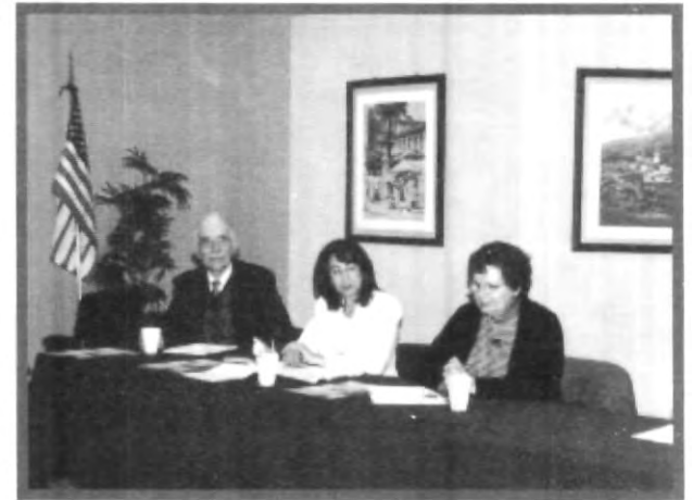
ESTA FIRMA DE CONVENIO PERMITIRÁ DESARROLLAR PROGRAMAS Y PROYECTOS BILATERALES DE COOPERACIÓN ENTRE AMBAS UNIVERSIDADES