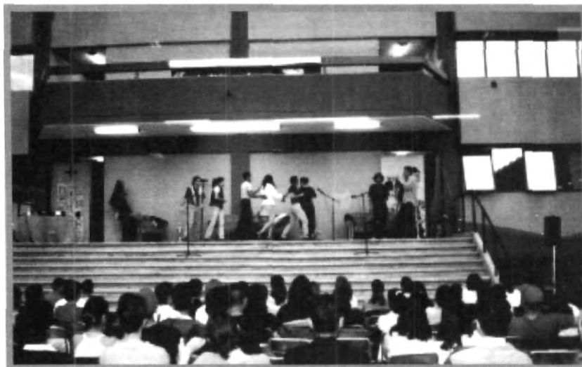
VARIAS OBRAS DE TEATRO SE MONTARON ANTES DE QUE SE DIERA FORMA A LA COMPAÑÍA ARTÍSTICA UPAEP