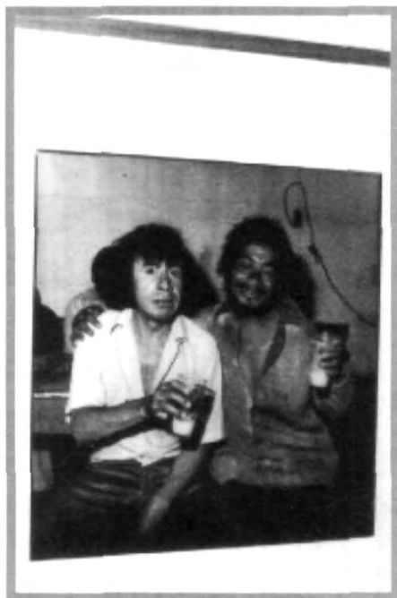
ESTA IMAGEN SE TITULA "LOS OFICIOS DEL BABADRAY", FOTOGRAFÍA QUE IMPRIME UN SELLO POPULAR EN EL ARTE DE LOS JARRONES MEXICANOS