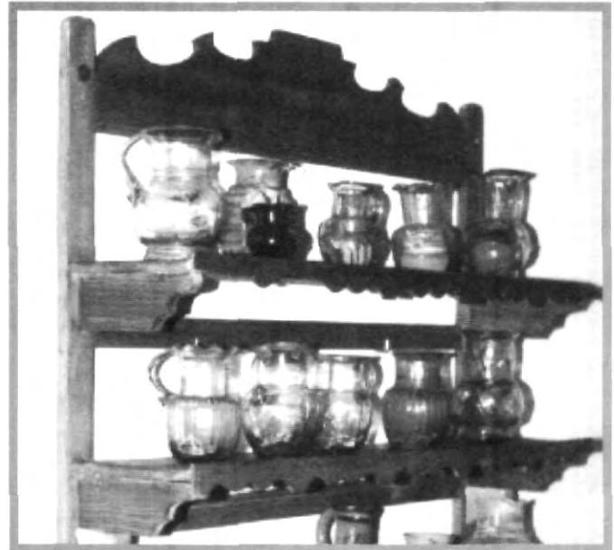
UN CONJUNTO DE OBRAS ARTÍSTICAS SE CONJUNTARON EN ESTE MUEBLE QUE SOPORTA UNA VARIEDAD DE JARRAS EN MINIATURA EN DIVERSAS FORMAS Y COLORES

abordará el contexto en el que se desarrolló este arte.