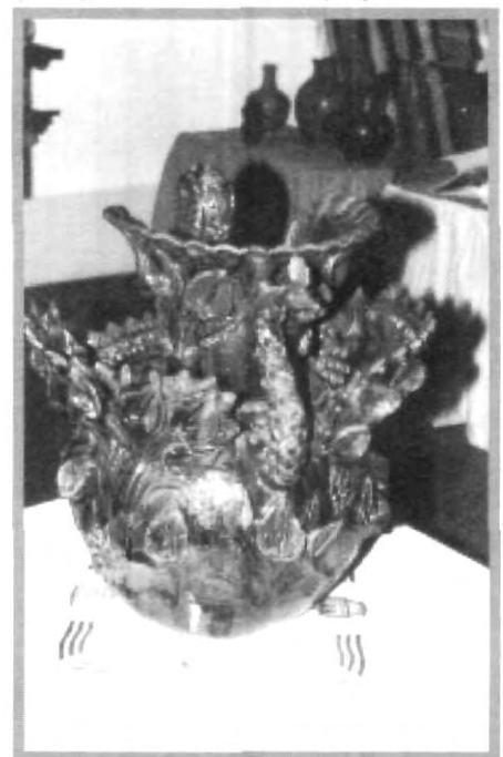
ESTA JARRA DECORATIVA ELABORADA EN OAXACA, ES LA MÁS GRANDE QUE SE EXPONE EN EL MUSEO UPAEP, A LA CUAL HACE UN TIEMPO SE LE OTORGÓ EL SEGUNDO LUGAR EN UN CONCURSO DE ARTE POPULAR

exposición también se pueden admirar las fotografías captadas por el Maestro Everardo Rivera, quien en su colección fotográfica logró captar imágenes referentes al consumo y utilidad que la gente le daba a las jarras pulqueras.