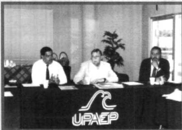
PORQUE HABLAR DE GLOBALIZACIÓN NO ES CUALQUIER COSA, SE REALIZARON TALLERES DE DISCUSIÓN ENTRE CATEDRÁTICOS