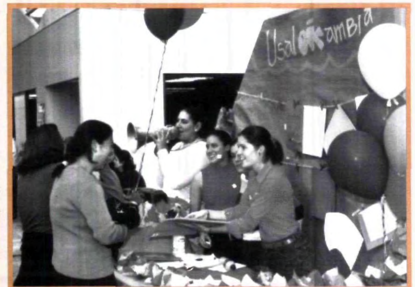
CON LA PARTICIPACIÓN DE 80 EMPRESAS QUE FORMAN PARTE DEL PROGRAMA EMPRENDEDORES UPAEP, LOS ALUMNOS UPAEP SE INVOLUCRAN POR COMPLETO EN LA REALIZACIÓN DE SU PROPIO NEGOCIO

Por último es importante destacar que la participación de los jóvenes en este evento fue vital para su realización, así como para su éxito, con el cual se demuestra que los jóvenes pueden alcanzar sus metas si así se lo proponen.