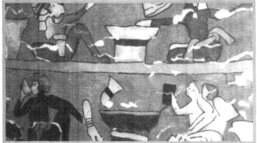
EL INGENIO POPULAR ELABORADO EN OCASIONES A MANO O EN TALLERES ESPECIALIZADOS, HAN HECHO QUE LAS JARRAS SEAN UNA VERDADERA OBRA DE ARTE