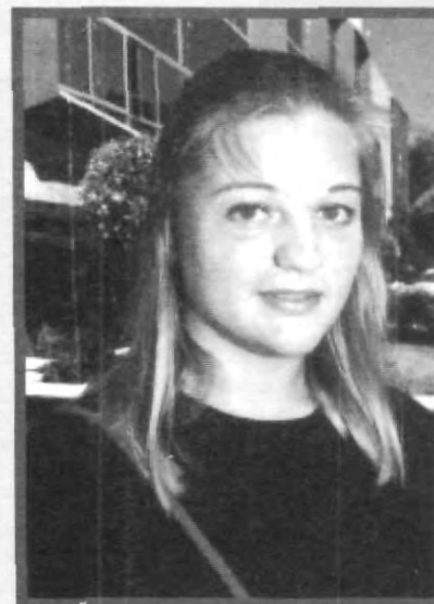
ESTA GÜERITA SE MOSTRÓ INTERESADA EN CONOCER TODA LA REPÚBLICA MEXICANA

13.- Mensaje: Estamos muy contentos de estar aquí