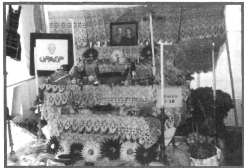
TODOS LOS PREPARATIVOS YA ESTÁN CASI LISTOS PARA REALIZAR LA DÉCIMO TERCERA EDICIÓN DEL CONCURSO DE OFRENDAS UPAEP

Así que ya lo sabes, participa e intégrate al ambiente universitario.