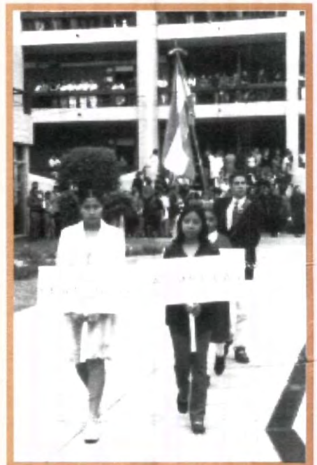
HAN PASADO MÁS DE 500 AÑOS DEL DESCUBRIMIENTO DE AMÉRICA, PERO AÚN FALTA EDUCAR Y HACER CONCIENCIA DE LA IDENTIDAD QUE NOS FORMÓ

Debemos abrirnos al cambio sin perder de vista quiénes somos, ya que sólo así se puede enfrentar la globalización y cualquier percance.