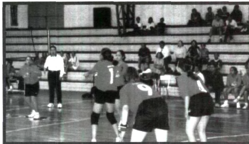
LA UPAEP TIENE TODO LISTO PARA LANZAR SUS MEJORES EXPONENTES DE LA RAMA VARONIL Y FEMENIL EN LA ELIMINATORIA DEL VOLEIBOL PLAYERO

Y dentro de la rama varonil de voleibol de sala en la eliminatoria, tendrá sólo tres representantes que pelearán su lugar en el Nacional del 2002. Dichas instituciones serán: UPAEP, ITESM,CCV y al UIA GC. UPAEP enfrentará sus partidos el 19 y el 26 de enero. Para más información en el gimnasio de la universidad.