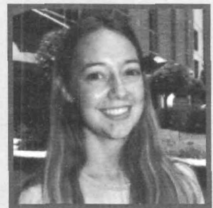
RUBIA Y DE OJOS AZULES, ESTA JOVEN ESTUDIANTE ESTÁ PREPARADA PARA ABSORBER TODO LO POSIBLE DE LAS RAÍCES MEXICANAS