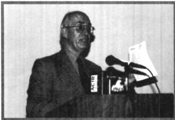
EL CANDIDATO ALEJANDRO CAÑEDO BENÍTEZ AL DIRIGIRSE A LOS JÓVENES ACLARÓ QUE DENTRO DE SUS PROPUESTAS LA JUVENTUD ES UN FACTOR IMPORTANTE PARA SALIR ADELANTE

Desde el principio aclaró que su propuesta es para toda la ciudad y obviamente ahí están incluidos los jóvenes.