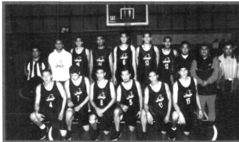
POR SEGUNDA OCASIÓN LAS ÁGUILAS UPAEP SE IMPUSIERON ANTE EL ITESM CAMPUS GUADALAJARA. DURANTE EL PARTIDO LA UPAEP SUFRIÓ, PERO ALCANZARON EL TRIUNFO

Y hablando de nuestras Águilas de la UPAEP, se nos recuerda que hay que ir a apoyar al equipo en su próximo partido que es el viernes 12 cuando reciban en el primer partido oficial de la temporada en el "nido" del gimnasio de la UPAEP a él ITESM Campus Chihuahua en punto de las 19:30 hrs.