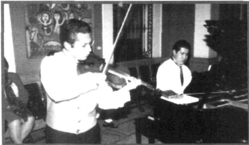
DIOS LOS CREA Y ELLOS SE UNEN, ES UN DICHO QUE SE PUEDE APLICAR A ESTE DUETO CONTEMPORÁNEO QUE SE PRESENTÓ EN LAS INSTALACIONES DEL MUSEO UPAEP

En esta ocasión, el dueto de piano y violín fue lo que escuchó el público asistente, que al reconocer el talento de ese par de artistas contemporáneos, se levantó de sus asientos en repetidas ocasiones aplaudiendo ese talento que los enmarca.