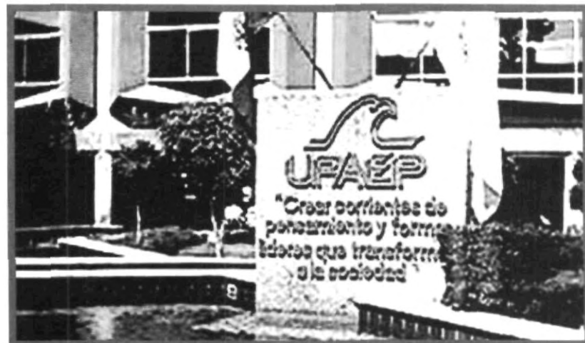
LOS SISAMOS, LOS ROBOS, LOS DESASTRES NATURALES, SON FACTORES DE LOS QUE NINGUNA UNIVERSIDAD SE SALVA, POR LO QUE LA UPAEP TE RECOMIENDA CONOCER LA SEÑALÉTICA QUE SE ENCUENTRA EN LOS PASILLOS Y CORREDORES

Ahora ya lo sabes, no hay como la autoprotección, así que hijito, cuídate mucho y recibe mis bendiciones para que nunca te pase nada.