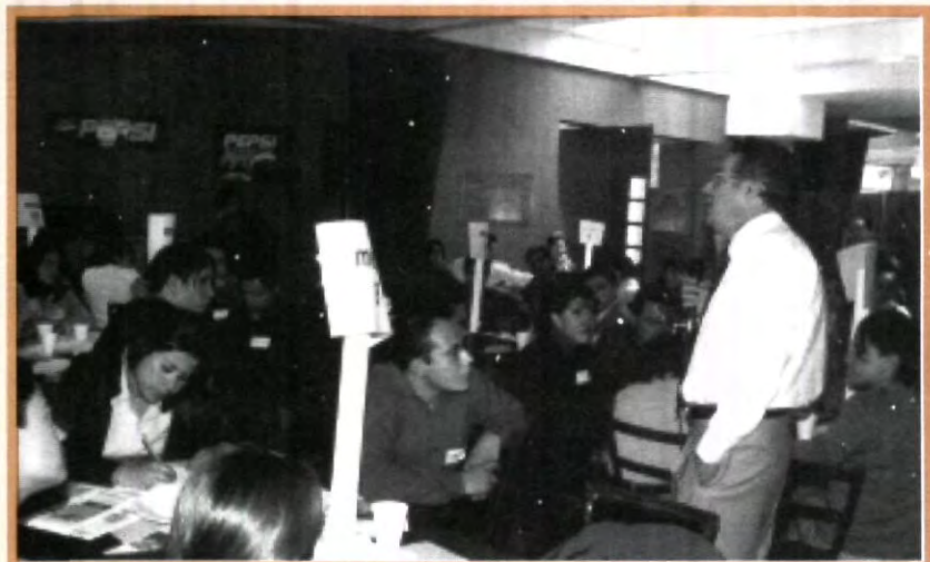
EL RECTOR JAVIER CABANAS GANCEDO DISFRUTÓ EL COMPARTIR CON LOS ALUMNOS ESA REUNIÓN, ASÍ COMO TAMBIÉN ESCUCHÓ SUS INQUIETUDES

Es importante recalcar el compromiso por parte del Rector para solucionar y analizar las cuestiones prioritarias como laboratorios y estacionamiento, pero lo más importante es que los servicios que brinda la institución no dependen sólo de aquellos que tienen a su cargo la dirección, sino del trabajo en conjunto entre todos los miembros de la universidad.