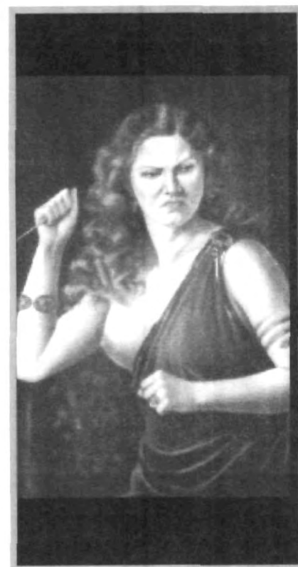
LA ACTITUD REFLEJADA EN LA PINTURA: "LA POSEIDA", ASOMBRÓ A MÁS DE UNA PERSONA