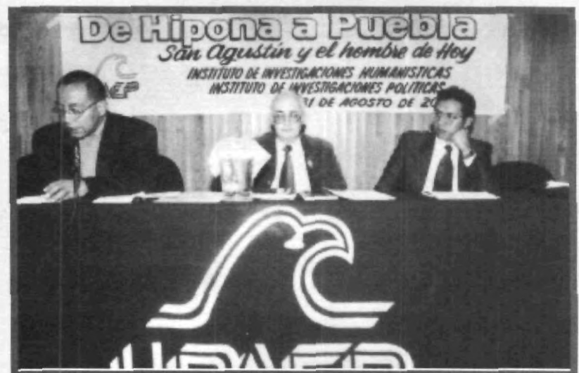
DESDE HIPONA A PUEBLA, SE HIZO PRESENTE SAN AGUSTÍN, A TRAVÉS DEL PANEL TITULADO: "SAN AGUSTÍN Y EL HOMBRE DE HOY"

control y que en cambio debe ser él mismo, aún a costa de perder algunos puestos que pueden llegar a ser representativos dentro del sistema social actual.