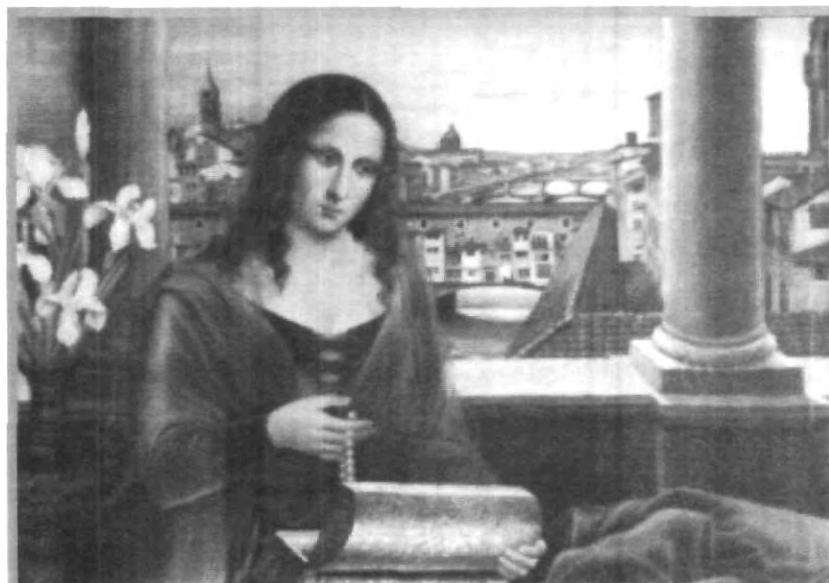
UN CONTEXTO DELICADO Y SUTIL, ACOMPAÑA A LA FLODARISA GERARDINI, PINTURA EN ÓLEO SOBRE TELA, QUE TRANSMITE PAZ Y TRANQUILIDAD AL OBSERVARLA