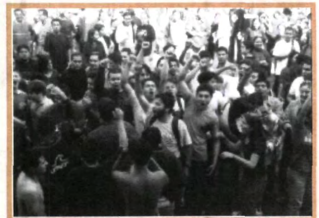
LOS PACHONES SE ENCARGARON DE DARLES UNA MANITA DE GATO A LOS PELONES, QUE YA LES HACÍA FALTA

Así, los nuevos universitarios conocieron a sus compañeros de carrera, a quienes pudieron reconocer gracias a los distintivos colores que éstos empleaban en sus playeras, ya que cada una de las escuelas y facultades de la institución tenía asignado un color diferente.