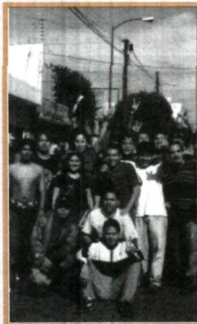
DE TODO UN POCO HUBO EN LA MOJADA, DESDE UN BUEN BAÑO, HASTA RICAS CHALUPAS

Asimismo, para los estudiantes que no son de nuevo ingreso, el mensaje es que continúen su carrera con el mayor entusiasmo y esfuerzo posible, para que les sea posible cosechar los frutos más adelante y se encuentren satisfechos con su propio desempeño.