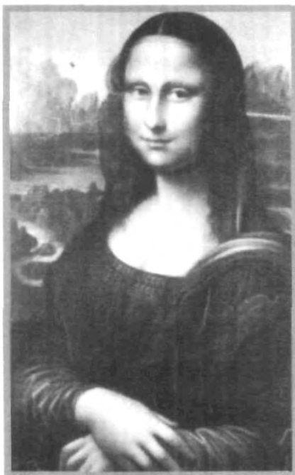
LA GIOCONDA, RÉPLICA DE LA ORIGINAL DEL MUSEO DE LOUVRE, ENGANALÓ EL MUSEO UPAEP

Pintora reconocida mundialmente presentó su colección en el Museo UPAEP.