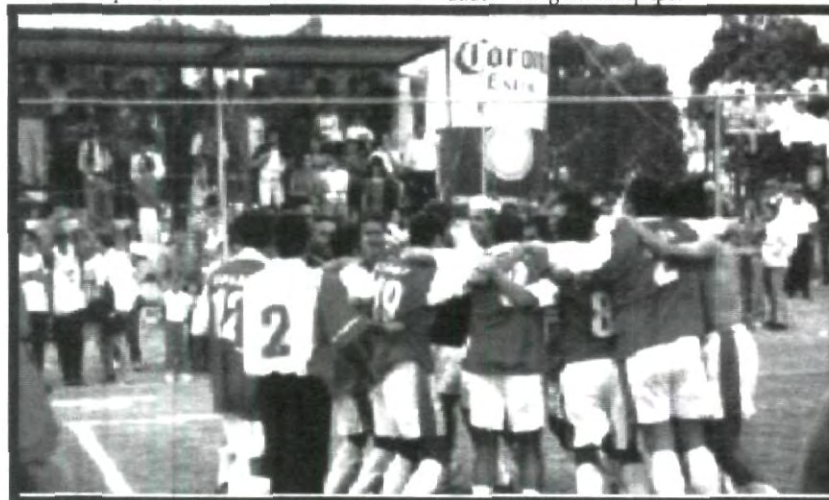
LOS INTRAMUROS ESTÁN POR COMENZAR, ATLETISMO, FUTBOL DE SALÓN, VOLEIBOL Y TENIS DE MESA (PIN-PON), PRESENTES

Se espera la participación de muchos estudiantes en los intramuros mencionados, así que si te gusta uno de estos deportes no lo dudes e intégrate al equipo.