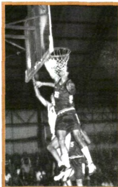
LAS ÁGUILAS SE LA JUGARON DE TODAS TODAS Y FINALMENTE RESULTARON INVICTAS ANTE LA UDLAP

Ahora nada impedirá que la UPAEP busque el título regional del CONDDE, para así poder ir a la Universiada Nacional en la