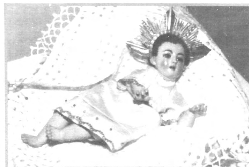
EN LA SALA TEMPORAL DONDE SE ENCUENTRAN EXPUESTOS LOS NIÑOS DIOS SE PUEDEN ENCONTRAR FIGURAS DE ÉPOCAS MUY ANTIGUAS QUE AÚN PREVALECE