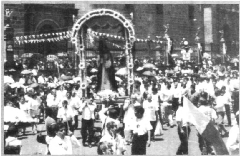
LA PROCESIÓN DE CRISTO NAZARENO ESTE AÑO CUPLIRÁ DIEZ AÑOS DE CONMEMORARSE EN ESTA ANGELÓPOLIS

piedad y costumbres cristianas, de ahí que sus habitantes se preocuparan porque la Semana Santa fuera distinta a las otras, motivando a los fieles a actuar, ya fuera en los actos previamente establecidos o pasivos, contemplando, orando y conmoviéndose, que al fin y al cabo era el fin de las procesiones