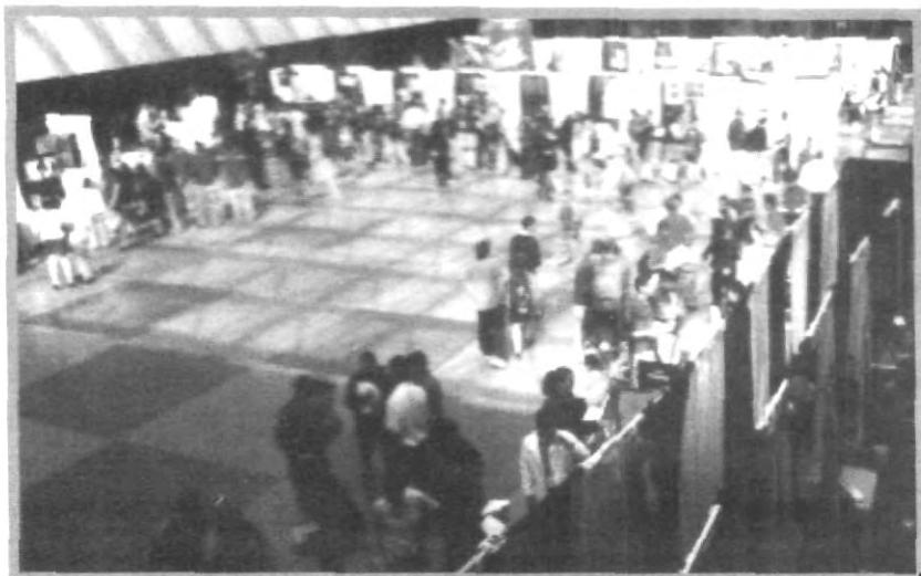
EN TIJUANA SE SELECCIONARON LOS REPRESENTANTES DE MÉXICO EN FRANCIA Y ALUMNOS UPAEP FORMARÁN PARTE DE LA DELEGACIÓN

Cabe destacar que para poder reunir la puntuación necesaria los jueces evaluaron lo siguiente: memoria (resumen del trabajo), dominio del tema, presentación física y documental (stand), seguridad, claridad,