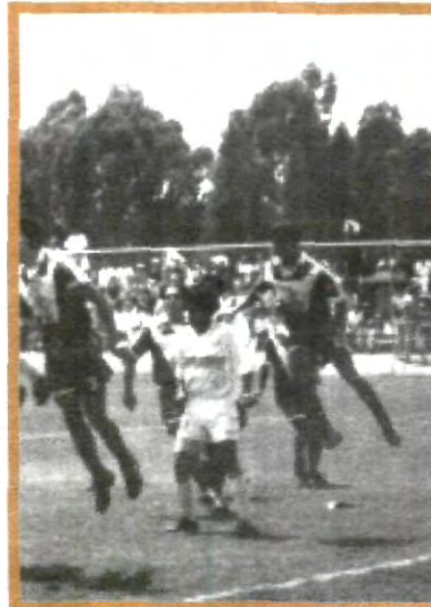
EL EQUIPO APASCO GOLEÓ A LAS ÁGUILAS TAPATÍAS EN LA FINAL