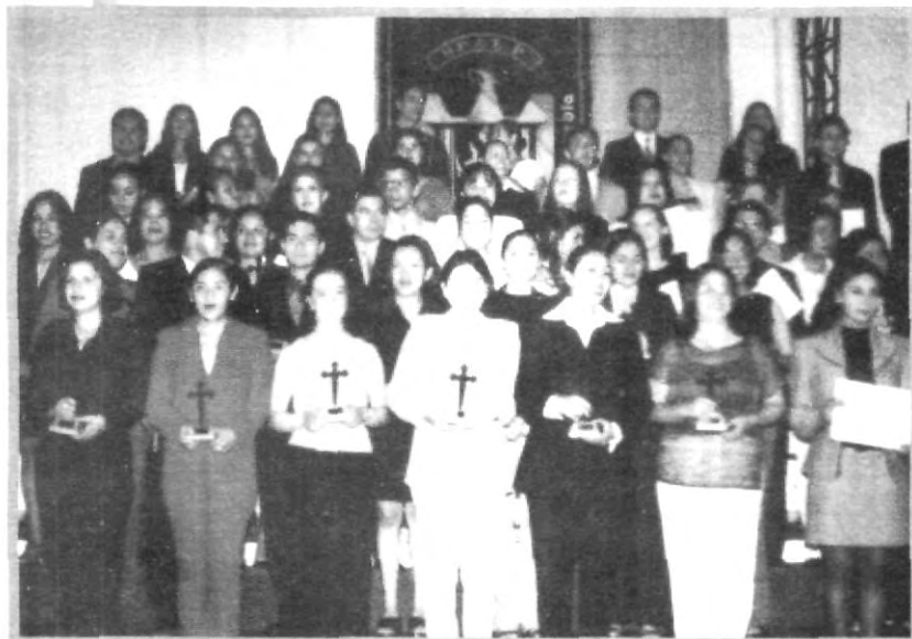
EL NUMEROSO GRUPO DE COMUNICÓLOGOS UPAEP SE HIZO PRESENTE DURANTE LA SEGUNDA NOCHE DE PREMIACIÓN