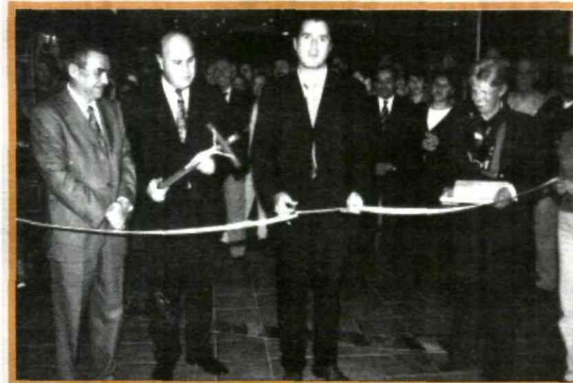
CON DISTINGUIDAS AUTORIDADES INTERNAS Y EXTERNAS A LA UNIVERSIDAD, SE REALIZÓ EL TRADICIONAL CORTE DEL LISTÓN