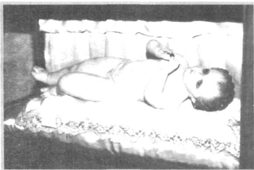
ESTA PEQUEÑA ESCULTURA FUE ELABORADA POR LA CONOCIDA PINTORA Y ESCULTORA POBLANA PEPITA ALBISÚA

Durante la conferencia se explicó que en la cultura mexicana es muy importante el