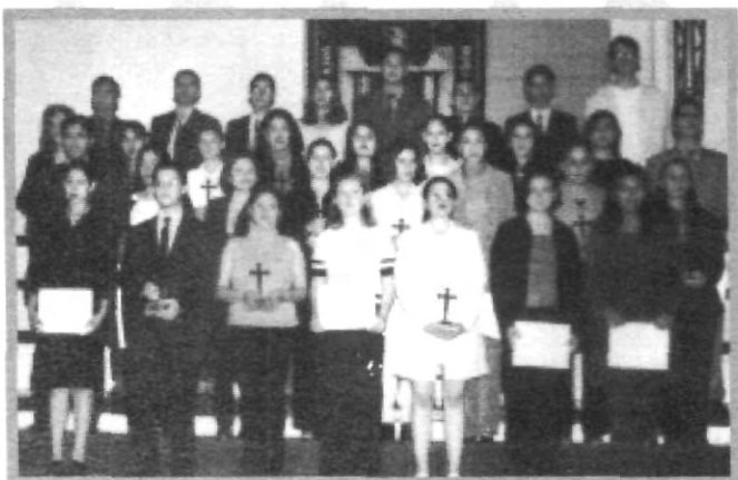
ALUMNOS DESTACADOS DE LOS DIEZ DEPARTAMENTOS QUE INTEGRAN LA UPAEP OBTUVIERON SU GALARDÓN

La XXV entrega de la máxima presea representativa UPAEP a lo más destacado en el ámbito académi- co estudiantil se efectuó ante la presencia de alumnos, padres de familia y autoridades universitarias