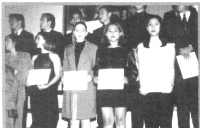
EL MÉRITO AL ESTUDIO ES UN ESTÍMULO PARA QUE EL PRÓXIMO SEMESTRE ALCANCEN LA ANHELADA CRUZ FORJADA