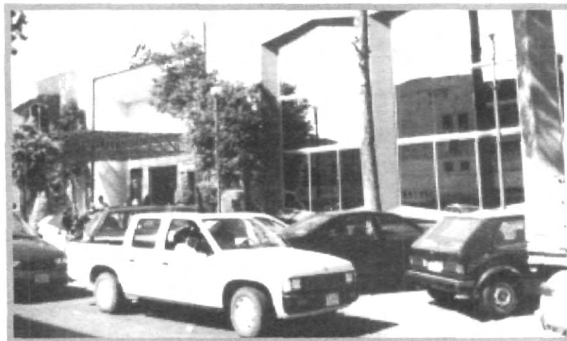
NECESARIA LA AYUDA DE LAS AUTORIDADES DE ESTA ENTIDAD PARA CONTRARESTAR LA DELINCUENCIA

solucionar buscando un lugar donde suplir el servicio de estacionamiento, pero para cubrirlo, necesitaríamos hacer una torre de 5 pisos de por lo menos 500 a 600 cajones para satisfacer la demanda", finalizó.