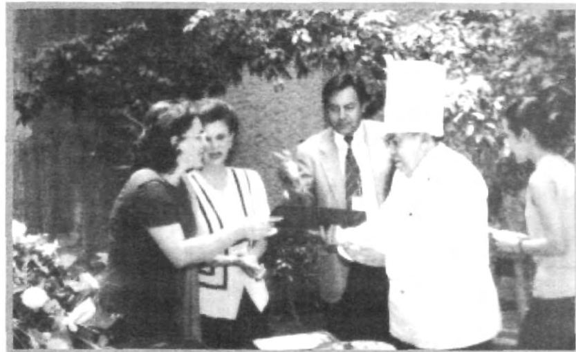
LOS ALUMNOS DE ADMON DE INSTITUCIONES PUSIERON EN PRÁCTICA SUS CONOCIMIENTOS Y SU BUEN SAZÓN