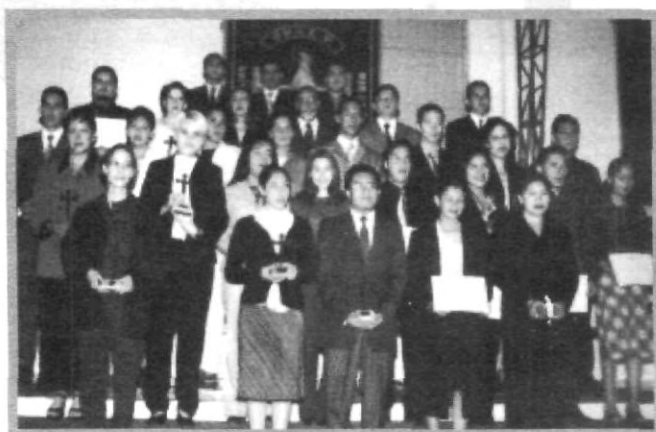
LA CALIDAD ESTUDIANTIL DE LOS FUTUROS POLITÓLOGOS SE DEJA VER EN EL NÚMERO DE ALUMNOS PREMIADOS