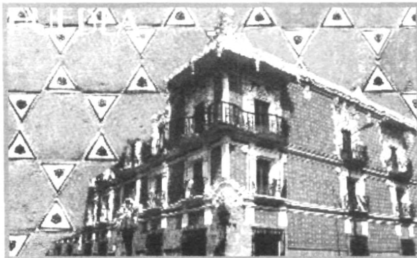
LA FACHADA DE LA CASA DEL ALFEÑIQUE DECORADA A BASE DE YESO, SIMULA UN DULCE DE AZÚCAR ANTIGUO DE PUEBLA

Chavos: si tienen oportunidad de ir, realmente aprecien ese manjar arquitectónico, ya que es difícil encontrar este tipo de edificios en nuestra ciudad.