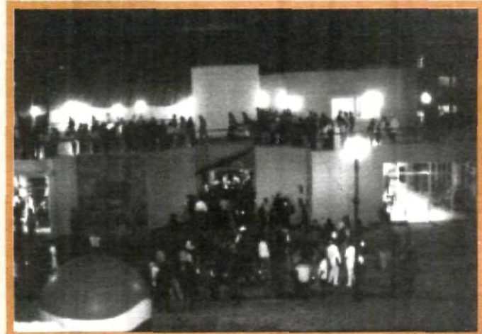
CON UNA INVERSIÓN DE 3 MILLONES 500 MIL PESOS, LA CAFETERÍA UPAEP SE CONVIRTIÓ EN UNA REALIDAD

Cabe señalar que el logotipo y nombre de la cafetería también se sometió a concurso resultando ganador el alumno Becket Castelán Gómez.