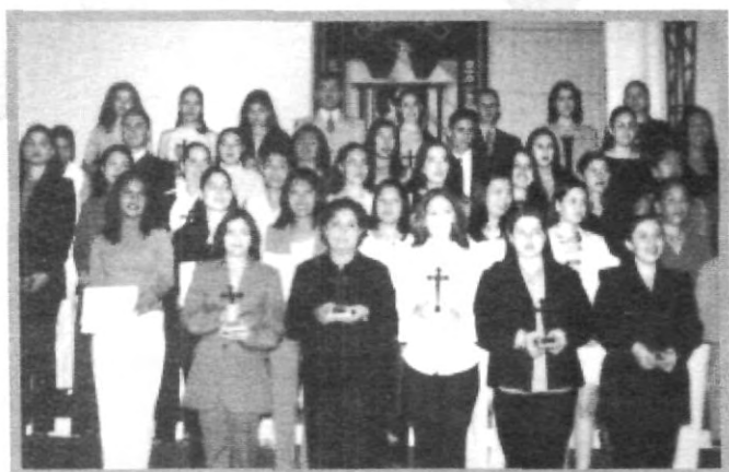
LA CARRERA DE PSICOLOGÍA DEMOSTRÓ COMO CADA SEMESTRE QUE TIENE ALUMNOS DESTACADOS

La XXV entrega de la máxima presea representativa UPAEP a lo más destacado en el ámbito académi- co estudiantil se efectuó ante la presencia de alumnos, padres de familia y autoridades universitarias