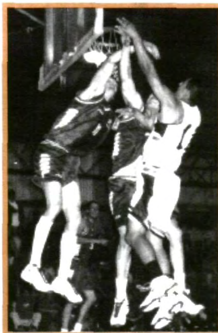
CON UN PUNTO DE DIFERENCIA LA UDLAP SE LLEVÓ EL TRIUNFO

Por último el grupo 5 que es el llamado grupo de la muerte puesto que de los cuatro