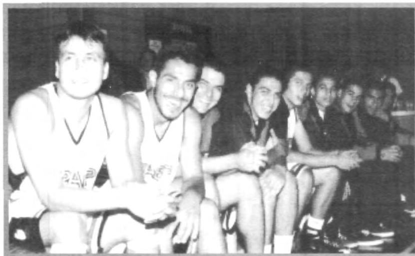
EL NERVIOSISMO DE GANAR SE ESCONDE DETRÁS DE LAS SORISAS DE LOS JUGADORES ANTES DE CADA PARTIDO

Con respecto a los partidos, comentó que los basketbolistas han tenido la oportunidad de realizar viajes a Nuevo León, Estado de México, Michoacán, Guanajuato, Aguascalientes, Chihuahua, entre otros, para enfrentarse en el campo deportivo contra universidades de otros estados de la República; a nivel internacional han viajado a República Dominicana. "... a