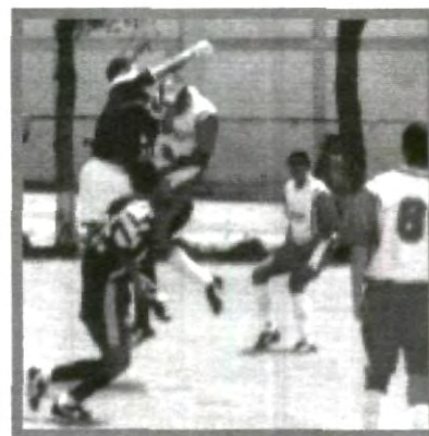
CON DIFERENTES APTITUDES LOS EQUIPOS SE ENFRENTAN

No te pierdas este 8 de marzo en el campo 3 del CIU las semifinales.