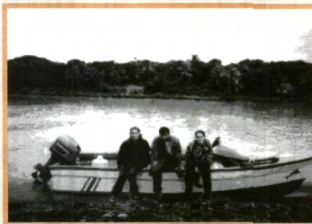
ALUMNOS DE INGENIERÍA ECOLÓGICA DURANTE SU VIAJE DE ESTUDIOS

Alumnos de Ingeniería Ecológica realizan trabajos de investigación.