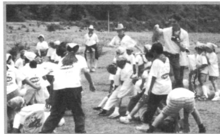
VIVE UNAS VACACIONES DIFERENTES