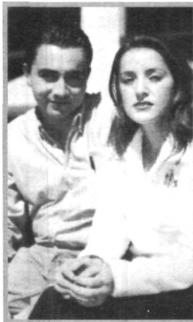
EL AMBIENTE DE LA UNI ABIERTA SE PRESTA PARA HACER BUENAS AMISTADES

estudio diario en sus hogares, es por eso que este sistema está basado en el auto aprendizaje", finalizó.