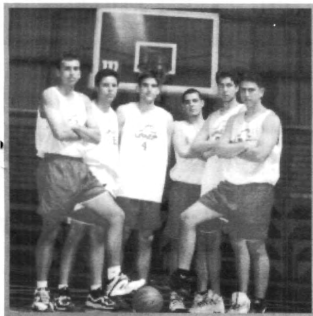
SU SIMPLE PRESENCIA SE ESTÁ VOLVIENDO SINÓNIMO DE TRIUNFOS EN LOS CAMPEONATOS

"Nosotros les tenemos restricciones entre las que se destaca el no realizar fiestas dentro de su vivienda, ni en el gimnasio, lo referente a sus descansos y salidas son su propia responsabilidad".