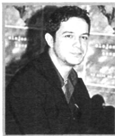
EN SU RECIENTE VISITA A PUEBLA ALEJANDRO SANZ REUNIÓ A CIENTOS DE FANS

el álbum en directo "Alejandro Sanz Básico" en el que recoge algunos de los mejores temas de los discos anteriores y es editado en forma limitada. Venecia es el escenario que en 1995 lo ve grabar su disco Alejandro Sanz III con el que muestra una carrera de gran ascendencia. Es en 1997 cuando graba su disco MAS y en el año 2000 presenta su más reciente discografía "El Alma al Aire".