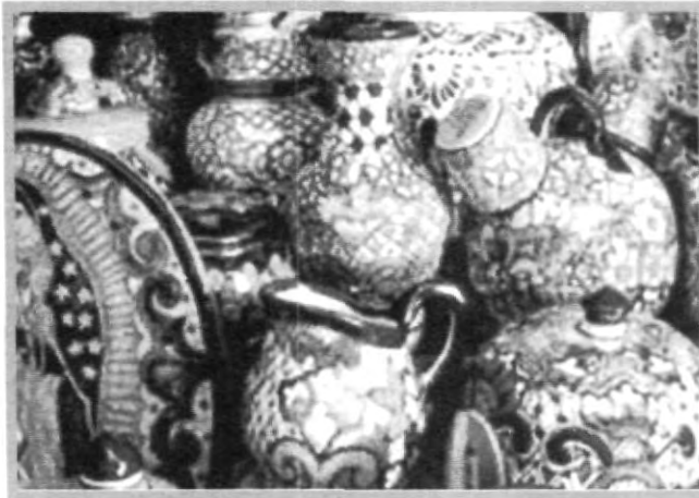
UN PROCESO LABORIOSO SE REALIZA PARA LA CREACIÓN DE LA ARTESANÍA POBLANA

Ya decorada la pieza se expone a una segunda hornada a 1050 grados centígrados en un proceso de 9 horas continuas, logrando una aleación de los diferentes óxidos con los que se forman la tan variada gama de colores. Al término de la hornada, las piezas presentan una apariencia de brillantes y se nota en este momento el color definitivo seleccionado, y un craquelado en la superficie del esmalte. Y al fin está terminada la talavera, elaborada con la tradición del siglo XVII.