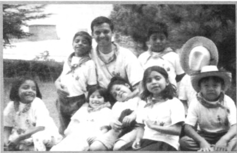
UNIDEA TE INVITA A COMPARTIR UNA EXPERIENCIA DIFERENTE

Te invitamos a ser parte de una gran aventura llamada "Universitarios de Asís" (UNIDEA), una asociación de jóvenes que, al igual que tú, tenemos ideales de llegar a ser personas exitosas en la vida, pero lo que nos mueve es que ese éxito lo queremos compartir con los que nos rodean, en particular los más necesitados, los marginados de nuestra sociedad. Actualmente trabajamos para niños de zonas marginadas y de orfanatos. UNIDEA está integrado por jóvenes de varias universidades de Puebla y queremos que los jóvenes de la UPAEP también integren nuestra asociación. Necesitamos jóvenes como tú: alegres, con ganas de salir adelante, persistentes, con inquietudes, divertidos y sobre todo: que no les importe el qué dirán, que no les importe el dar a los demás. Por eso te decimos: