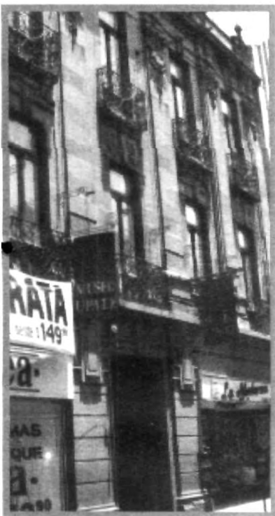
LA CULTURA SE RECONOCE EN SUS INSTALACIONES

El pasado 8 de febrero el Museo Popular de Arte Religioso cumplió un aniversario más de haberse fundado. El también llamado Museo UPAEP se ha caracterizado por ofrecer a la comunidad UPAEP y al público general, interesantes actividades.