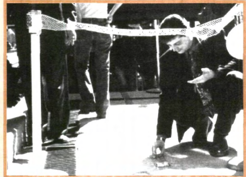
COLABORANDO EN EL KILÓMETRO DE LA PLATA

"Celebración por la vida" se llamó a este evento organizado por el grupo interuniversitario Universitarios de Asís o UNIDEA. En él, hubo de todo, desde puestos