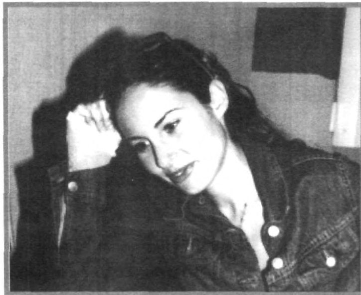
LA ACTRIZ DE TV AZTECA ANA SERRADILLA SE INTEGRÓ CON LA COMUNIDAD UPAEP, PARA LA CELEBRACIÓN POR LA VIDA

Ana Serradilla es una actriz joven que inició su carrera en el Centro de Televisión Actoral de TV Azteca. Inició haciendo comerciales, protagonizó la telenovela "Chiquititas" grabada en Argentina; formó parte del elenco de la telenovela "La vida en el espejo" y recientemente formó parte de la película "Mundo Raro".