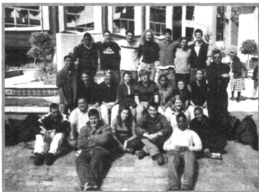
EL VIAJE LOS AGOTÓ, PERO SU ESTANCIA EN PUEBLA LA DISFRUTAN A LO MÁXIMO

familias quienes en todo momento se preocupan por brindarles la mayor comodidad durante su estancia, esto es con el fin de que además de que aprendan lo académico y lo cultural de México, conozcan a fondo la vida cotidiana de un joven