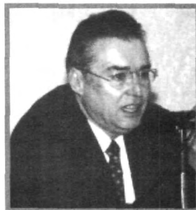
IDENTIFICACIÓN UNIFORME PRINCIPAL OBJETIVO DE LA REUNIÓN

Por último, cabe destacar que este desayuno fue el primero de tres eventos que se realizarán más adelante, todos con la misma temática y un propósito similar.