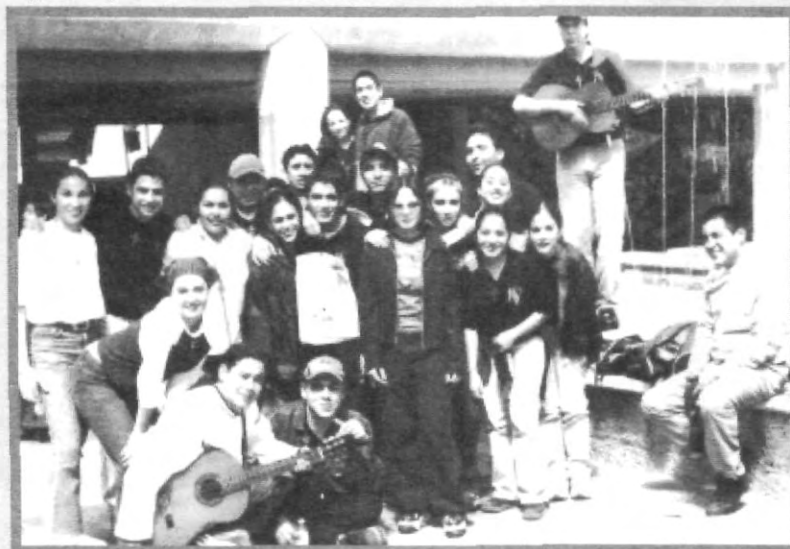
LA VIVENCIA CORRIÓ A CARGO DEL GRUPO PAX ET VOX, QUIENES PRENDIERON A LOS CHAVOS UPAEP CON SU MÚSICA

Por último, este grupo juvenil, invita a todas las personas a copiar su concepto y a comunicar el Evangelio por medio de la música o cualquier otra expresión artística, ya que los "jóvenes son la esperanza de la Iglesia".