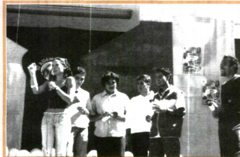
ANA SERRADILLA ACTRIZ DE TV AZTECA SUBIÓ A LA PLATAFORMA PARA PARTICIPAR CON LOS ALUMNOS UPAEP

El evento se cerró con el concierto de Alvaro Avitia, quien interpretó temas como "Casi un bluss de un fugitivo", "Vuelo de un delfín", Tradúceme", entre otras melodías de su primer disco "Tradúceme".