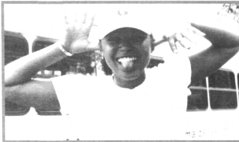
UN SALUDO MUY ORIGINAL QUISO DAR A LOS CHAVOS UPAEP AL ARRIBAR DE SUS VACACIONES DIAMOND

Mensaje: Gracias por la ayuda y la experiencia.