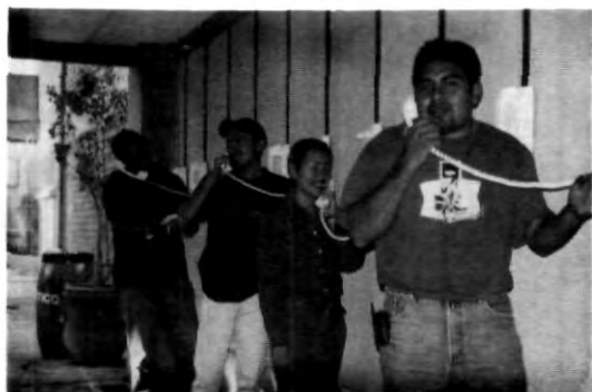
UPAEP a la vanguardia

la operadora te pedirá tu contraseña seguida de la tecla número (#), luego debes marcar tu número de buzón, que es tu matrícula, aunque como debe tener ocho números, si tu matrícula es de seis deberás marcar dos ceros antes para completar los ocho números, seguido de la tecla número. Inmediatamente después podrás escuchar tus mensajes. Puedes guardar los mensajes marcando 1 o si lo quieres borrar debes marcar 2.