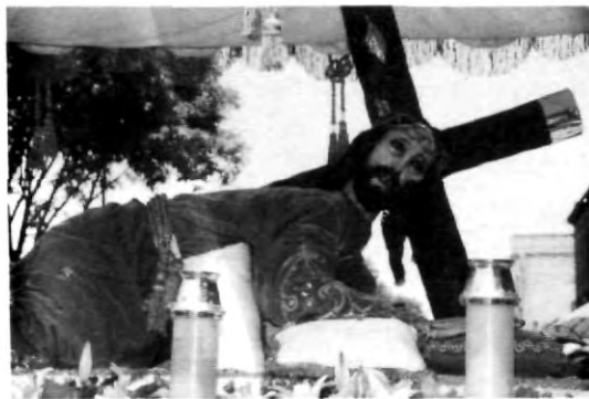
El señor de las Maravillas

dice la Iglesia sino con verdadero sentido y corazón tratando de reflexionar el por qué se recuerda este día y la transformación que puede lograr el alma en estas fechas, recordando que hay alguien que murió, pero dejó su enseñanza y palabra para que habitaran en el corazón de las personas.