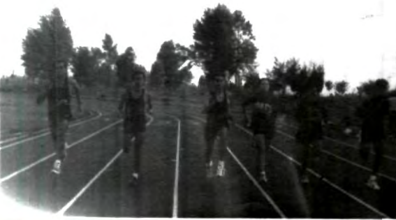
El equipo de atletas presente