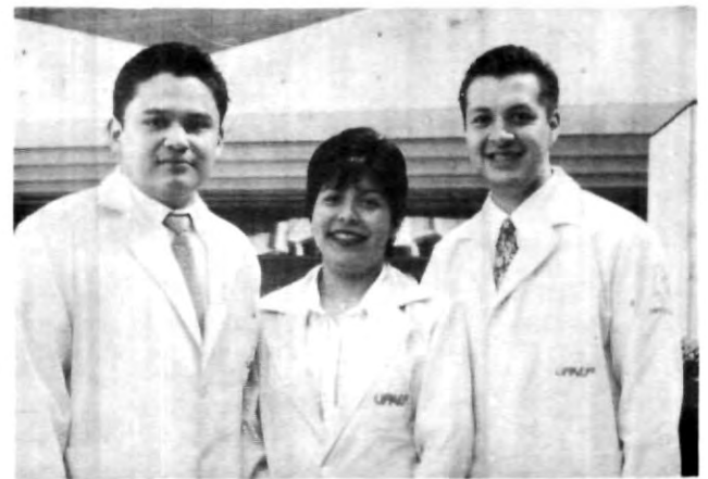
La alegría en sus rostros por el viaje

Por último, destacó que la presentación del trabajo de los alumnos concursantes se realizará del 27 de abril al 3 de mayo del año en curso.