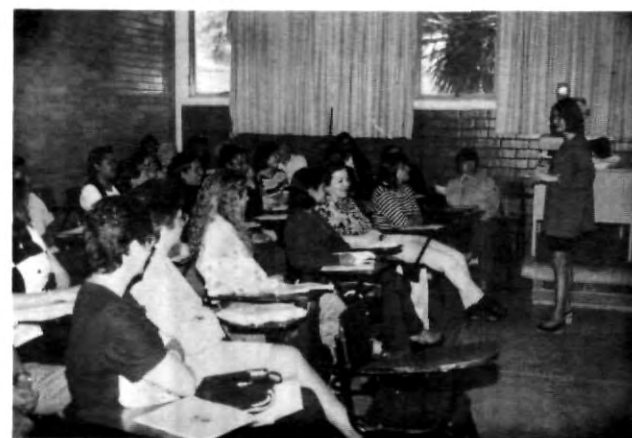
La capacitación y calidad ante todo

Agregó que uno de los puntos más importantes en la enseñanza del inglés es contratar maestros que posean verdadera calidad, lo cual ha sido una permanente preocupación de la UPAEP.