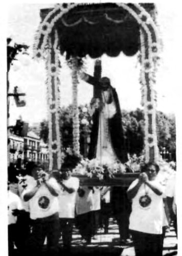
Un día inolvidable

Porque tú lo pediste... envía tus comentarios acerca de la evaluación docente al correo: www.evaluación@upaep.mx