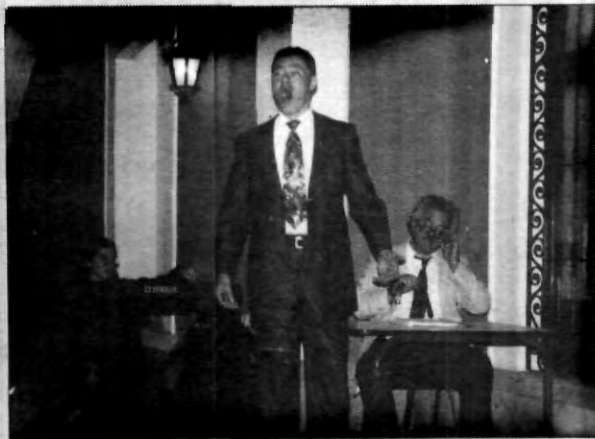
Otra dimensión de la música

Polifonía Vocal interpretó selecciones de ópera de la obra Don Pasquale, drama buffo in tre atti gaetano