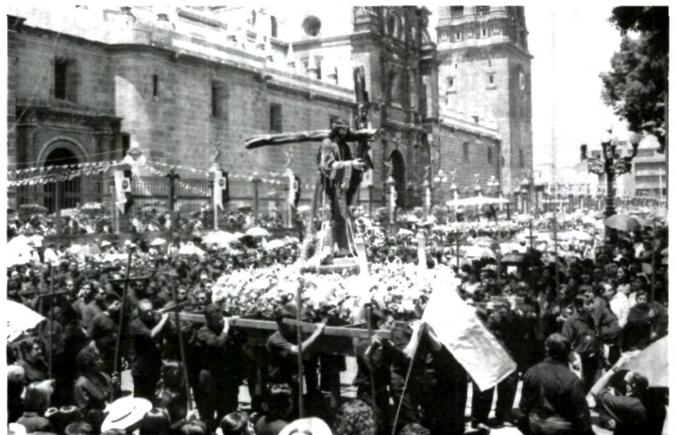
Una multitud durante la procesión

Entre las imágenes procesionales más destacadas se encuentran: "Nuestro Padre Jesús de las Tres Caídas", de la Parroquia de Analco; "Jesús Nazareno", venerado en la capilla anexa a la parroquia de San José; Nuestra Señora de la Soledad, del Templo de la Soledad; la imagen de la Virgen de los Dolores, del templo del Carmen; "El Señor de las Maravillas", de gran devoción y objeto de atenciones y cuidados por las monjas de Santa Mónica, de la Parroquia de San José.