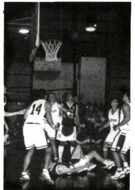
1ª UPAEP VS UDLA