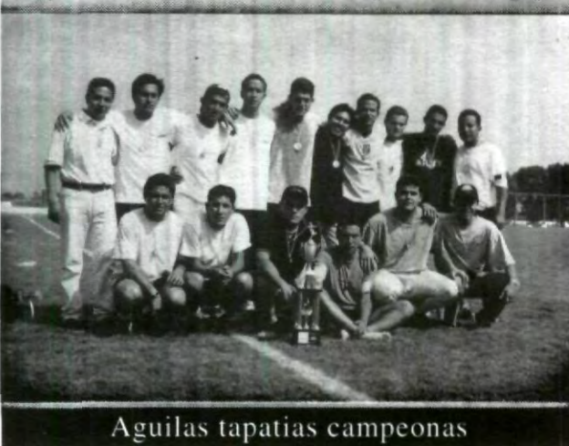
Águilas tapatías campeonas