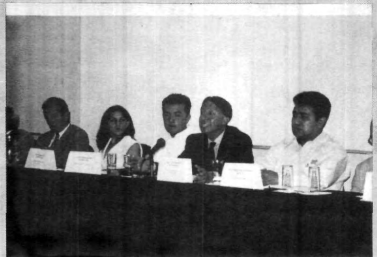
Los chefs extranjeros piratean la comida mexicana