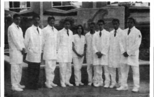
¡A trabajar por la carrera!