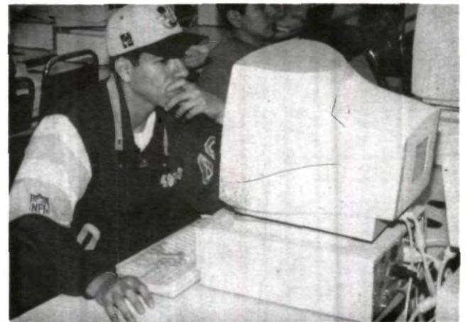
Una reflexión antes de evaluar

maestros sino mejorar, que el maestro se de cuenta de cuáles son los errores y nadie mejor que el alumno para evaluar al profesor en el salón de clases.