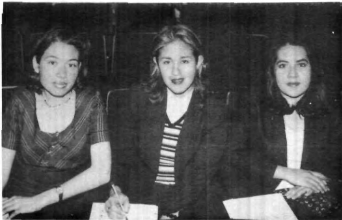
El trabajo en equipo supera el individualismo.