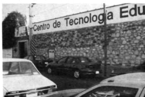
Y la vigilancia ¿dónde está?

importante que las autoridades competentes tomen conciencia y se encuentre una solución próxima y viable para encontrar la tranquilidad que todos buscamos.