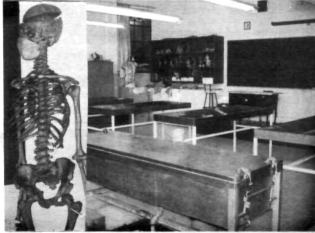
El estudio es primero, el miedo después

Los cadáveres, que existen en el anfiteatro, se obtienen por medio de convenios con instituciones como Cáritas y el Hospital Psiquiátrico, con la supervisión legal de las autoridades correspondientes. El tiempo que duran estos cuerpos en las