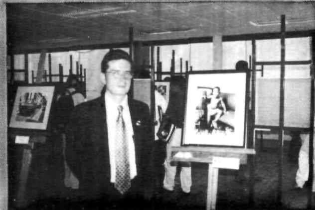
Las dudas de los alumnos salieron a flote

Además, el reportero afirmó la vigencia que la santería tiene en dicho país, habló del uso de las "huahuas", así como la situación precaria en que muchas veces viven los cubanos.