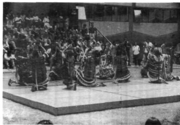
La música tradicional encantó

Por otra parte el Son Veracruz trajo hasta la explanada de la UPAEP al conjunto de "Los Costeños", quienes interpretaron aproximadamente 7 temas durante una hora, los cuales fueron del agrado de los estudiantes. Cabe mencionar que entre los instrumentos que utilizaron para interpretar sus melodías destacaron la guitarra y el arpa, mismos que deleitaron a la comunidad universitaria.