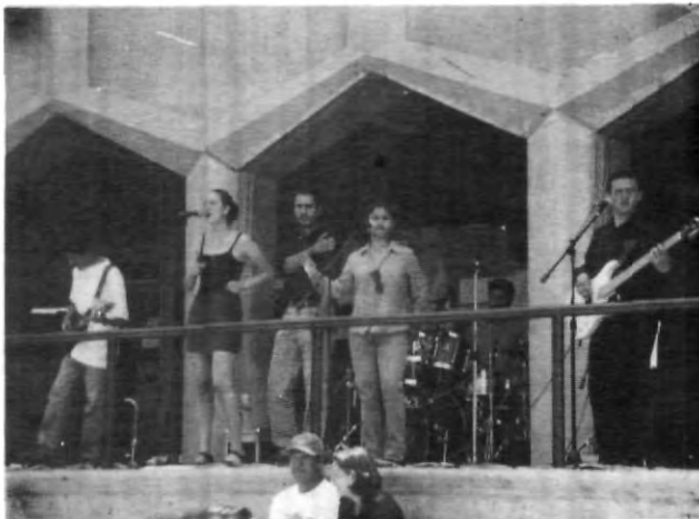
Ritmo y sabor para una mañana calurosa

Chicos, felicidades, continuen cantando con ese entusiasmo por muchos años más.