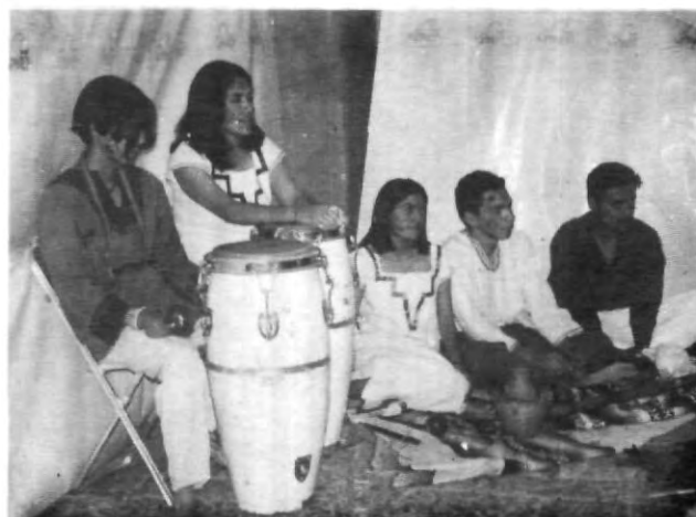
"Encuentros", una obra sinigual