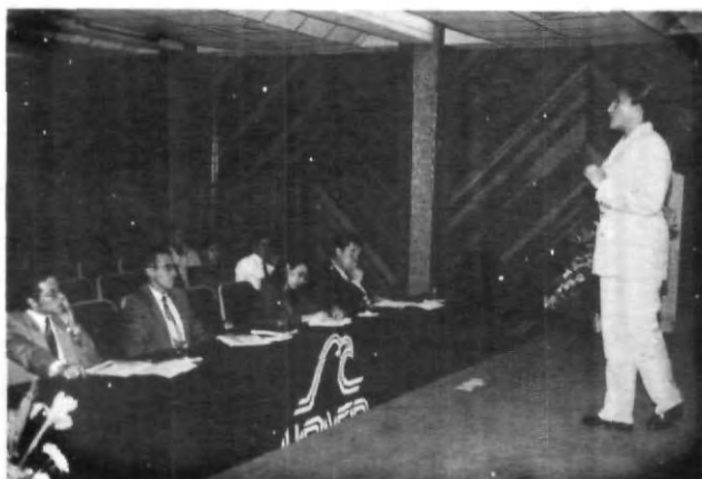
Oratoria y declamación, todo un éxito