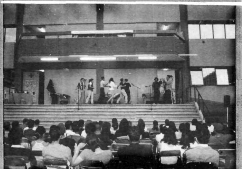
D' Generación participación sin temor