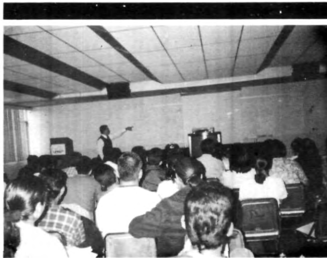
Los alumnos se interesaron en la ponencia

Se podría decir ¿cuál es el problema de no ver las estrellas?, no es sólo perderse de un espectáculo hermoso, sino es impedir el estudio de un patrimonio ambiental y cultural, fuente de inspiración no sólo de astrónomos, sino de poetas, pintores y filósofos a lo largo de la historia del hombre.