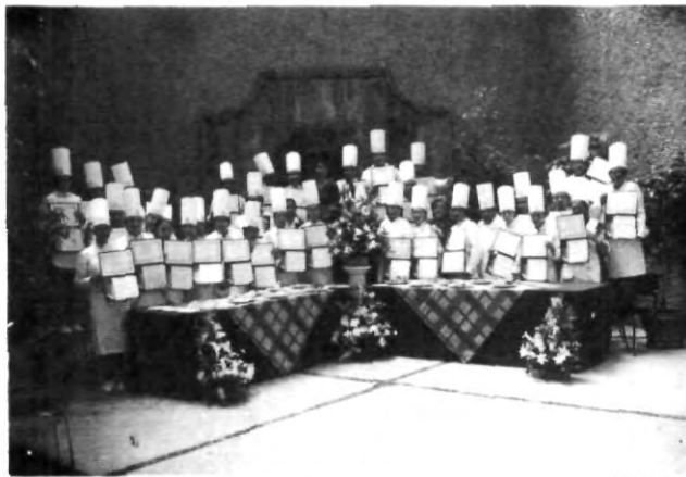
Alumnos durante la muestra

no saturadas, minerales, vitaminas y otros nutrientes, se utiliza mucho en la comida mexicana, así como en la USDA (United States Drug Administration), la cual lo considera en su pirámide alimenticia, debido que al lado de la carne, aves de corral, pescados, leguminosas, huevos y nueces, el cacahuete contiene un alto contenido proteínico.