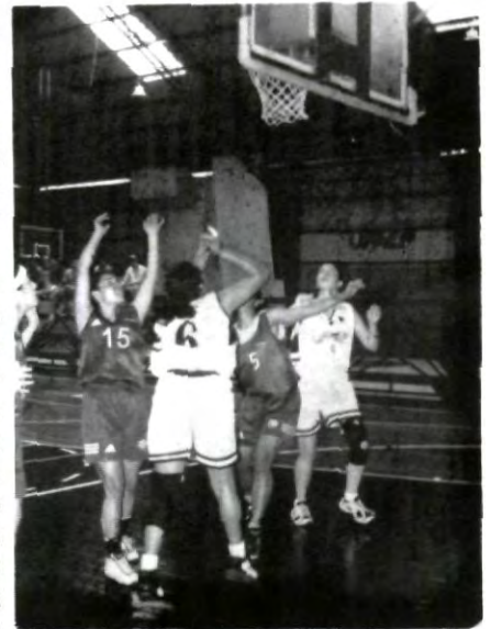
Águilas en acción

La mala nota en el regional para la UPAEP ha sido el equipo de futbol rápido varonil que perdió sus dos primeros encuentros y el tercero lo ganó en shout-outs para sumar apenas dos puntos. Al igual que hace un año la presión pudo más que el buen futbol de las águilas que se ahogaron en una serie de reclamos entre ellos y en situaciones disciplinarias que hundieron más al equipo.