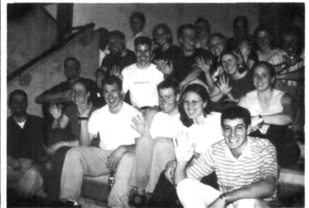
Bienvenidos a la UPAEP

Finalmente invitamos a todos, a brindarles apoyo, a que le ayuden a mejorar su español, y a ayudarlos a que se integren con nosotros en la UPAEP.