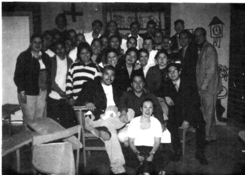
Gran entusiasmo de los comunicólogos