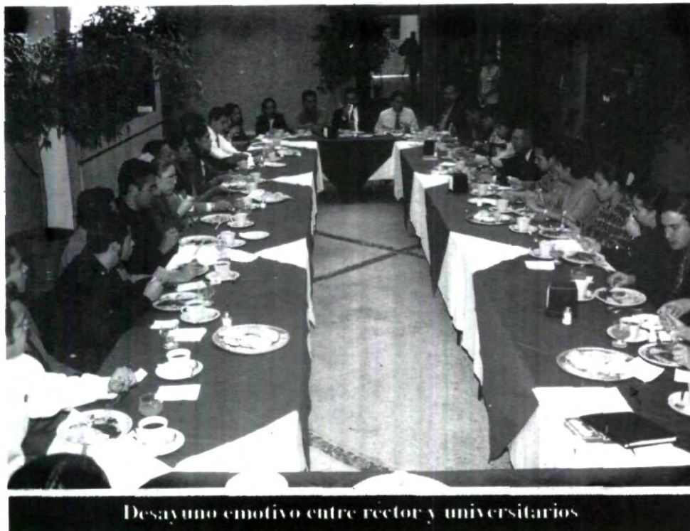
Desayuno emotivo entre rector y universitarios

Entre los propósitos de la evaluación de la gestión académica se encuentra la posibilidad de rescatar las situaciones vivenciales y cotidianas que puedan favorecer o plantear obstáculos al proceso educativo, que pueden ser de diversa naturaleza: administrativa, material, pedagógica o formativa; para determinar las estrategias y la conformación de compromisos que responsabilicen a cada uno de los protagonistas de la comunidad universitaria.