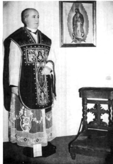
Yermo y Parres

Asimismo, puntualizó que en el año 1885 fundó la congregación de "Siervas del Sagrado Corazón de Jesús y de los Pobres", a cuya formación dedicó lo mejor de su espíritu y finalmente murió en la ciudad de Puebla el 20 de septiembre de 1904.