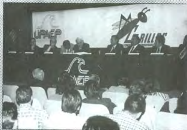
Se debe cambiar la democracia

Se debe cambiar de democracia representativa a democracia participativa, el cambio de un gobierno a nombre del pueblo a un gobierno del pueblo; añadió que el consumismo ha dado