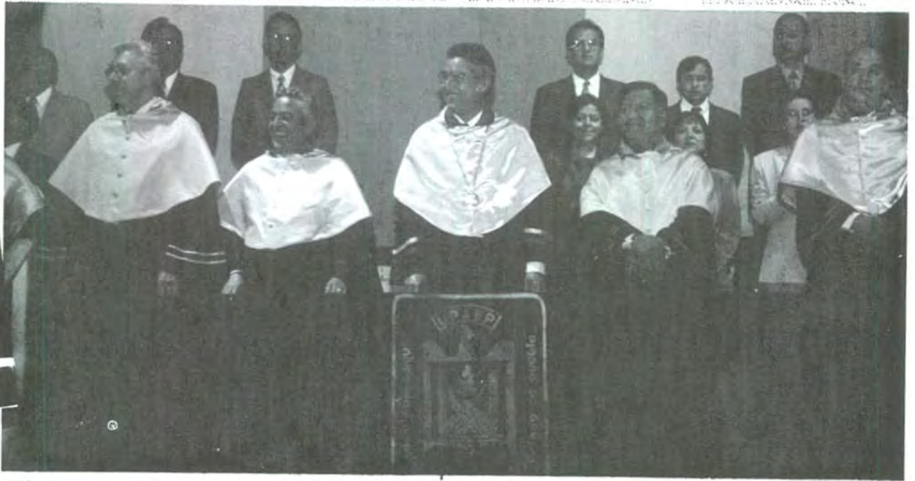
Las autoridades presentes durante la ceremonia