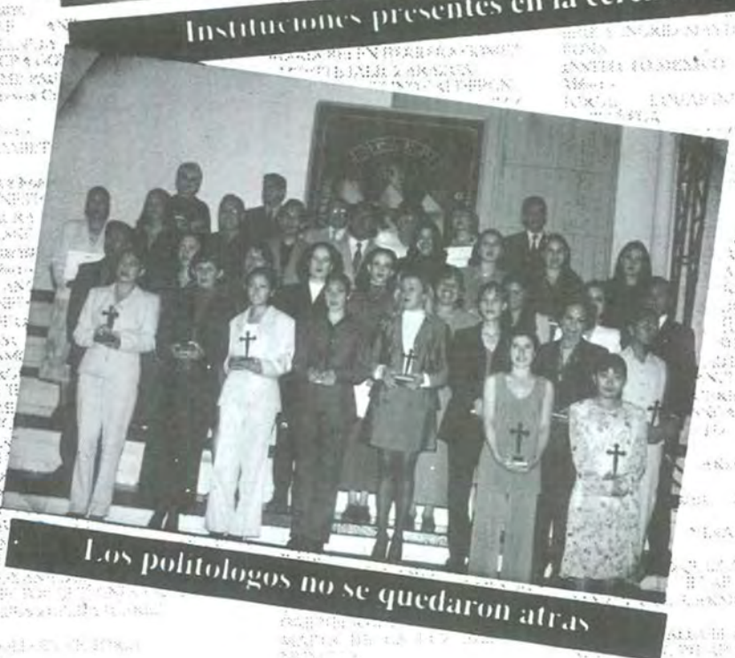
Los politólogos no se quedaron atrás