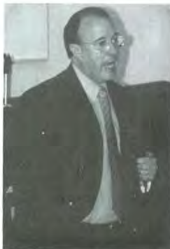
Dr. Julio Rubio Oca

La propuesta de la ANUIES es transformar el sistema y esto consiste en lograr una mayor dimensión y