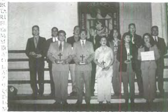
Los industriales felices