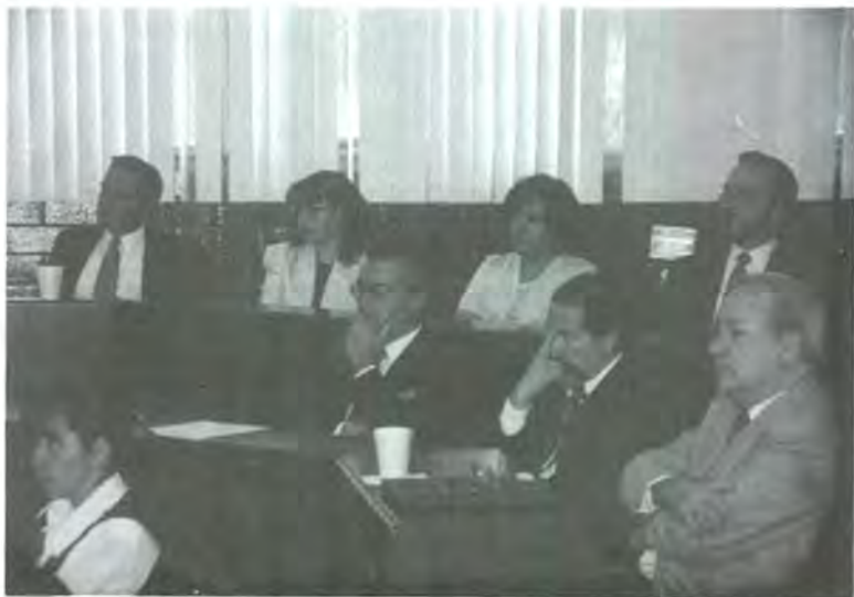
Distinguidas personalidades de la UPAEP

cobertura, una matrícula total del 5 por ciento de la población nacional, lograr que los alumnos extranjeros alcancen el 5 por ciento y la matrícula pública sea mayoritaria en todos los campos del conocimiento, aunado a que el 20 por ciento de estudiantes estudien un nivel de posgrado.