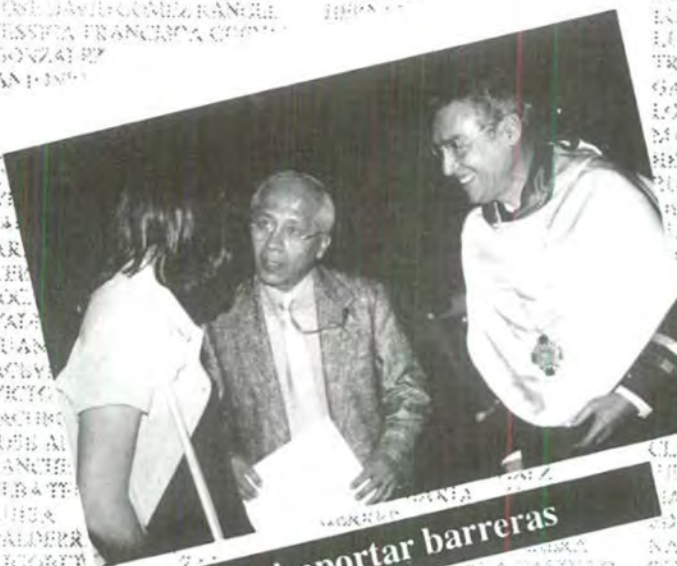
Sin importar barreras