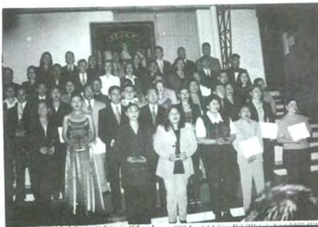
Los médicos también presentes