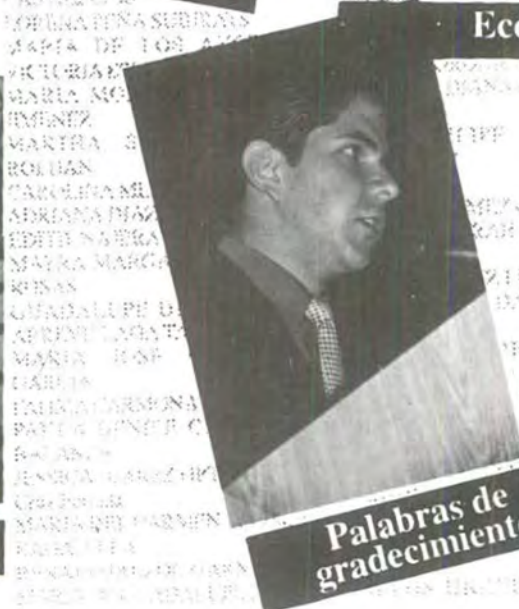
Palabras de agradecimiento