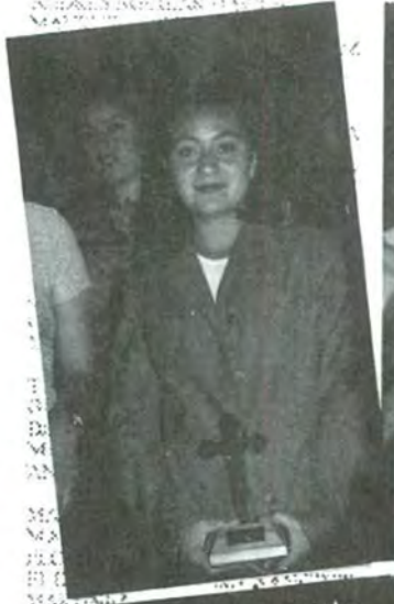
Belleza y triunfo