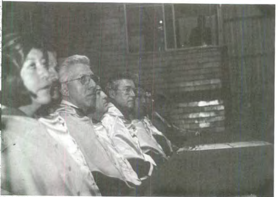
El presidium atento durante la ceremonia