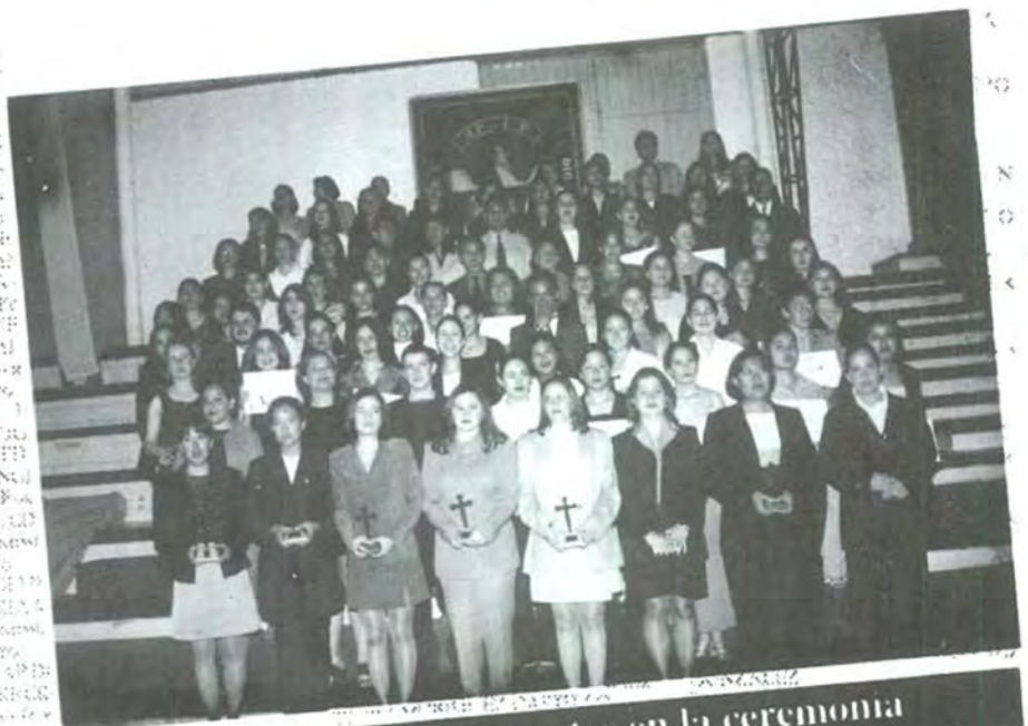
Instituciones presentes en la ceremonia