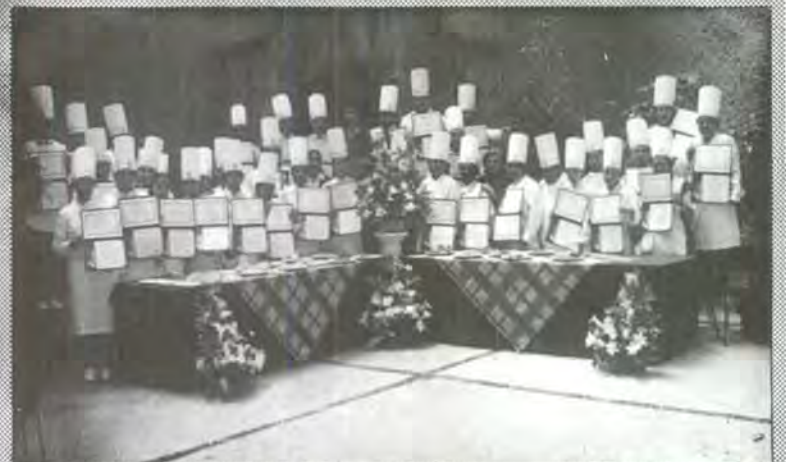
Gran participación de los alumnos de Instituciones

El resultado de este concurso fue una gran variedad de exquisitos platillos, así como sus presentaciones. Los tres primeros lugares obtuvieron un diploma de reconocimiento y un incentivo económico por el desempeño realizado.