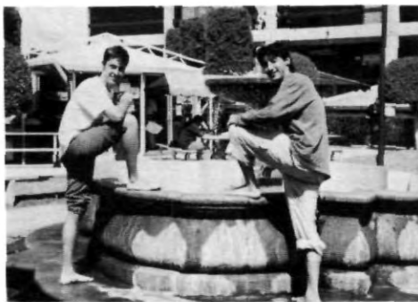
Disfrutando de la tradicional fuente