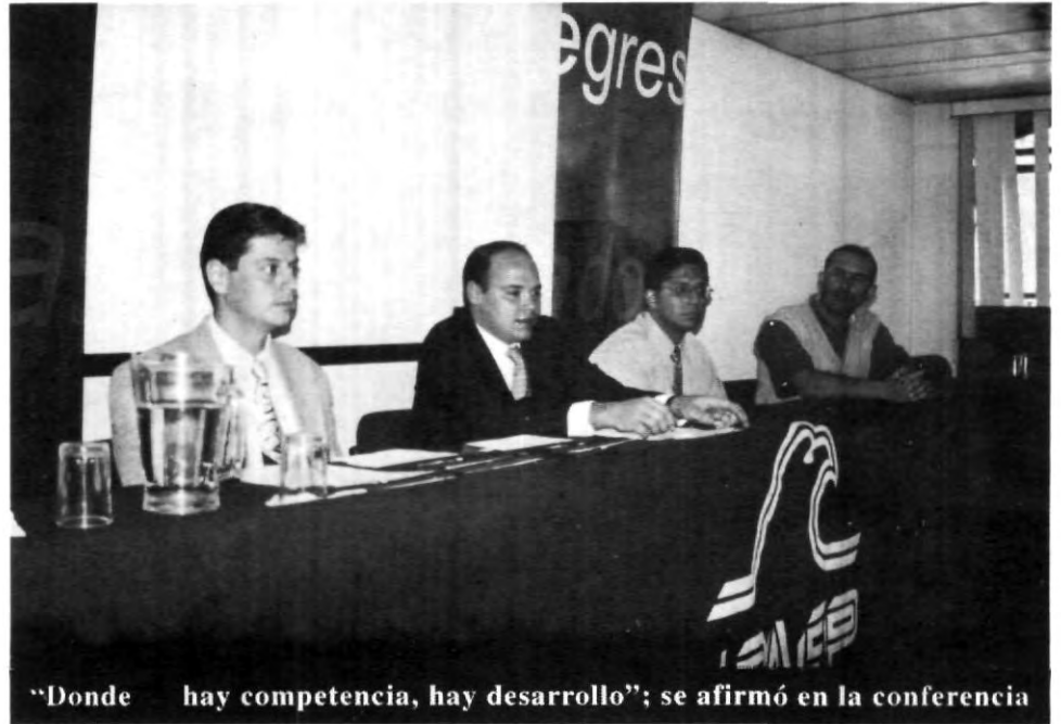
"Donde hay competencia, hay desarrollo"; se afirmó en la conferencia

Finalmente se agradeció a los acompañantes del evento, y se exhortó a los jóvenes diciendo: "donde hay competencia, hay desarrollo".