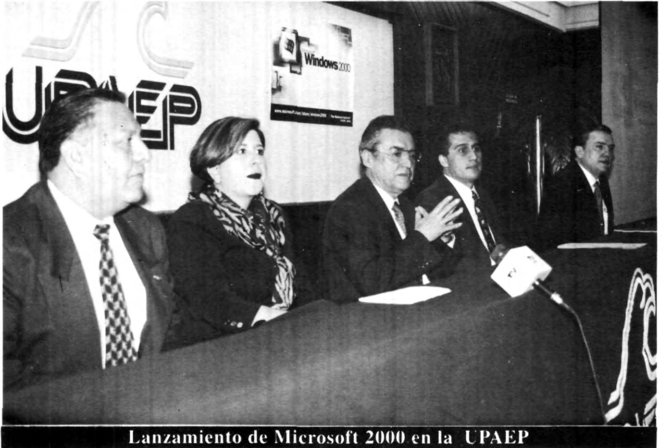
Lanzamiento de Microsoft 2000 en la UPAEP

de las empresas que también podrán recibir esta señal son: Afore Bancomer, Aeropuertos y Servicios Auxiliares, Bancomext., Bital, Bancomer, Barcel, Bimbo, Serfin, Cemex, Cervecería Cuauhtémoc, CFE, Motorola, Oxxo, Vitro, Volkswagen, Walmart, entre otras 4000.