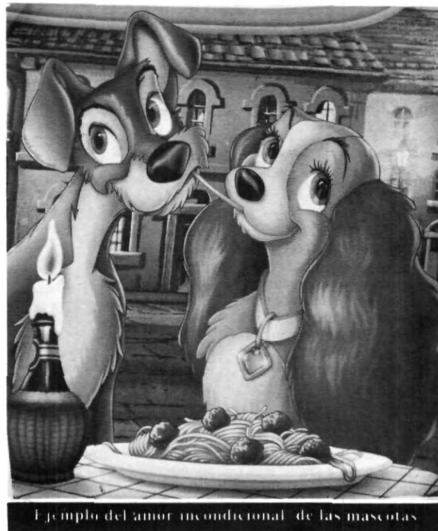
Ejemplo del amor incondicional de las mascotas

Existen muchas historias de estos "animales; la mayoría muy conmovedoras y otras un poco crueles. Bueno; el chiste es... que los perros son "muy buena onda"; son los mejores amigos que pudiéramos tener en muchas ocasiones.