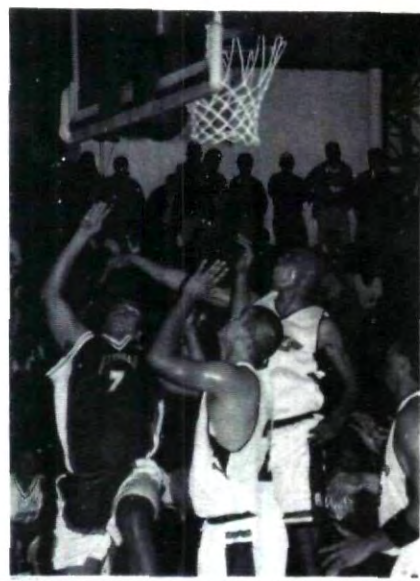
Inicia la nueva temporada

En otro orden de ideas, este jueves inicia el estatal del CONDDE donde las águilas comparten grupo con la Madero, la UDLA, el BINE y la Hispanomexicana. Este jueves 17, la UPAEP visita a la Madero a las 14:00 horas.