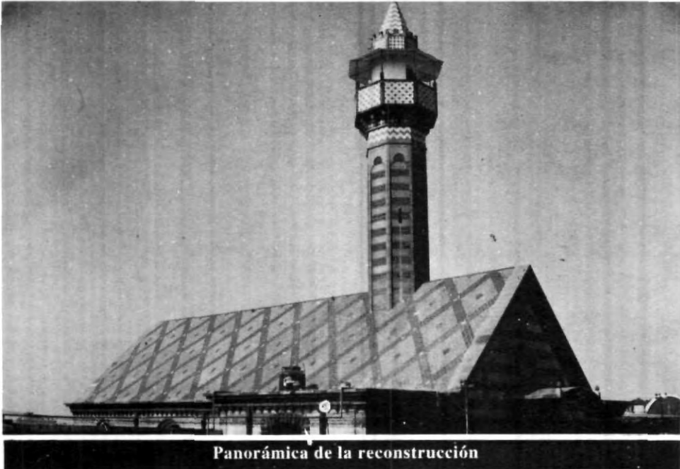
Panorámica de la reconstrucción

Indicó que la construcción del edificio se inició en el año de 1870 y el hospital entró en funciones en 1885 creado como maternidad por el arquitecto Eduardo Tamariz, quien estaba atraído por el estilo morisco que fue una corriente que se impuso en la arquitectura del siglo XIX. Afortunadamente, lo único que sufrió daños fue la capilla porque es el edificio más alto, tan sólo el minarete mide 13 metros de altura, 2.40 metros el mirador, más la altura propia de la capilla.