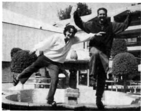
Alegría y Juventud

Ellos son chicos de Dartmouth College Muy buena onda ¿verdad?, bueno pues trátenlos, bríndeles todo el apoyo y ayúdenlos a perfeccionar su español.