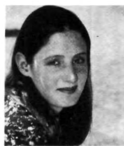
Fidelity Michelle Intercambio

"No estaba enterada del Museo UPAEP, pero me gustaría saber dónde está?"