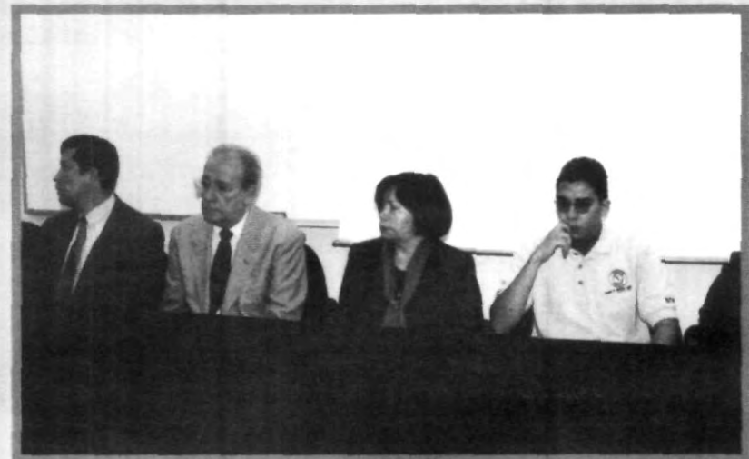
SALUD UNIVERSITARIA PREOCUPADA POR INFORMAR A LOS JÓVENES ACERCA DE LAS ENFERMEDADES

tabacaleras hacen es más fuerte, y es muy común relacionar algún deporte con anuncios de cigarrillos". Cabe destacar que todos los casos allí presentados fueron pacientes del oncólogo, que fueron tratados en el hospital UPAEP, que siguen sufriendo las secuelas de esta enfermedad.