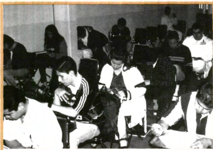
PARTICIPA EN LA EVALUACIÓN DOCENTE

Con todo lo anterior, se pretende que los alumnos logren evaluar un total de 1346 asignaturas, correspondientes a todas las escuelas