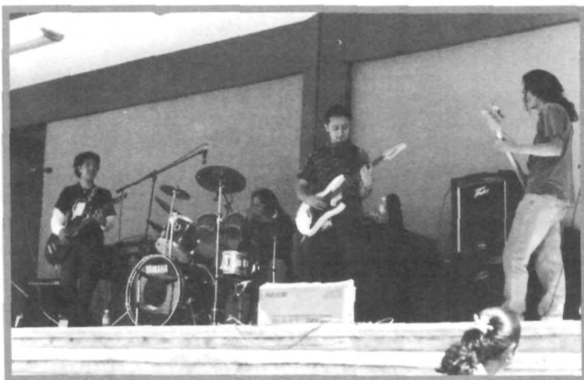
MIENTRAS A ALGUNOS EL ROCK INÉDITO EN ESPAÑOL DESCONCERTÓ, A OTROS LES AGRADÓ

transmite todos los domingos de 10 a 11 am. por la HR 1090 de AM. Cabe destacar que los grupos "Ígnea", "Destiempo" y "Famélica Carcoma" forman parte del "Efecto Bugambilia", movimiento poblano de rock inédito en español.