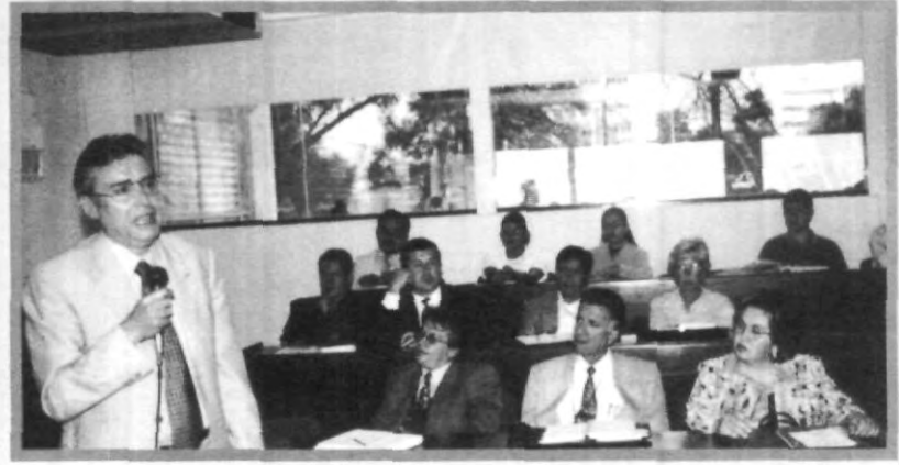
REVISIÓN DE REGLAMENTOS EN EL CONSEJO UNIVERSITARIO

los acuerdos de la pasada junta) y aprobadas en la sesión de junta de consejo.