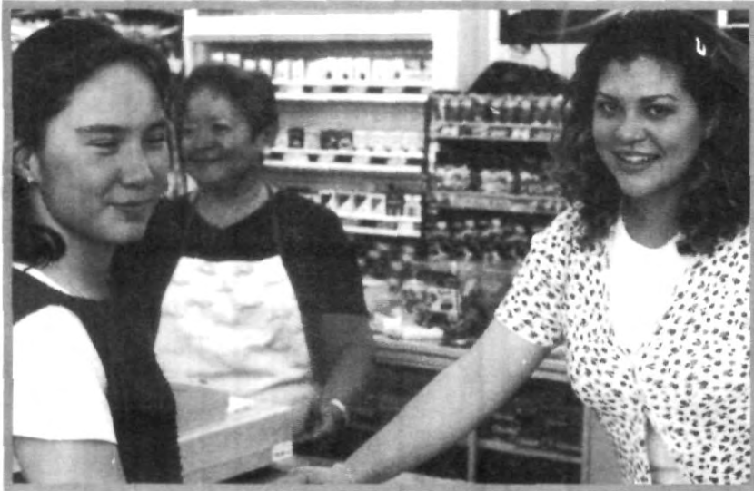
LA MAMÁ DE LOS PELONES ¡SE METIÓ HASTA LA COCINA DE LA TÍA IMELDA!

El próximo año se estrenará la nueva cafetería, y se inicia con una buena vibra, muchas ganas de trabajar, gran entusiasmo, buenos precios, mejor sabor y buena calidad.