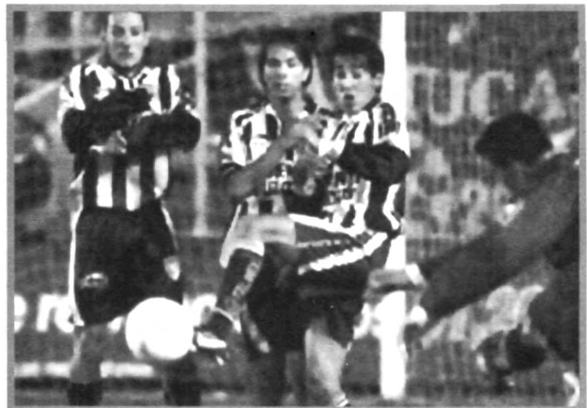
SE LUCHA POR LA CONSERVACIÓN DE LA IDENTIDAD DE LOS EQUIPOS, CON LAS CAMISETAS DE FÚTBOL

las playeras no se pierdan, como lo hacen los Pumas de la UNAM que sólo cargan con una marca.