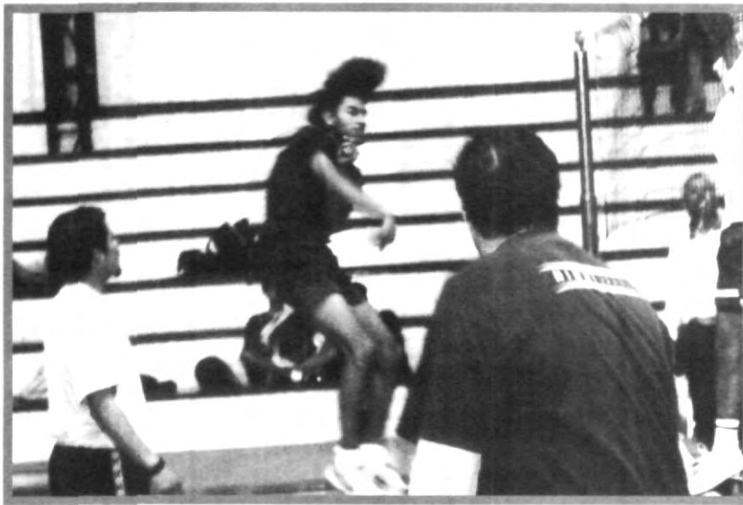
CADA VEZ MÁS CANDENTE M.I.A. LUCHA POR EL CAMPEONATO

Sin lugar a dudas es una competencia reñida, y dentro de este torneo encontramos jugadores que tienen un talento impresionante de los cuales que tres de los mejores jugadores de este torneo de intramuros podrían ser publicados espéralos la próxima semana, aparte de la final y el campeón del intramuros varonil y femenil.