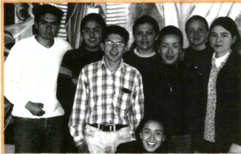
POR UNA MAYOR CALIDAD EN LA EDUCACIÓN

libremente su opinión acerca de la planta docente, a través de este tipo de actividades, con el propósito de propiciar las condiciones necesarias para el aprendizaje óptimo y, de esta manera, aproveche al máximo su educación profesional y consiga aumentar su calidad como persona, logrando la formación integral que tiene como objetivo la UPAEP.