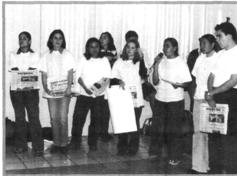
LOS ALUMNOS DE CICOM SE LANZAN A LA UNA NUEVA AVENTURA, EL ÁMBITO DE LOS NEGOCIOS

Con esto, se pretenden desarrollar las habilidades y aptitudes de expresión corporal para demostrar que la comunicación no se da a través del lenguaje hablado o escrito.