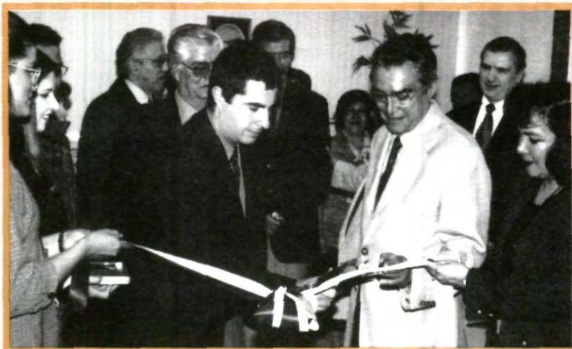
INAUGURACIÓN DEL CENTRO BANCOMEXT-UPAEP