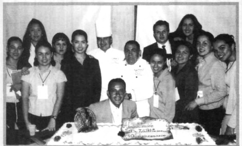
DÉCIMO ANIVERSARIO DE ADMINISTRACIÓN DE INSTITUCIONES

Administración de Instituciones (ESDAI) y hace 10 años, la UPAEP fue la segunda en abrirla; los egresados de administración de instituciones en la actualidad ocupan puestos en diferentes áreas de cualquier tipo de industria, en empresas privadas o públicas, transnacionales, nacionales, en micro y macro empresas, y hay oportunidad en cualquiera de ellas porque la carrera es muy versátil.