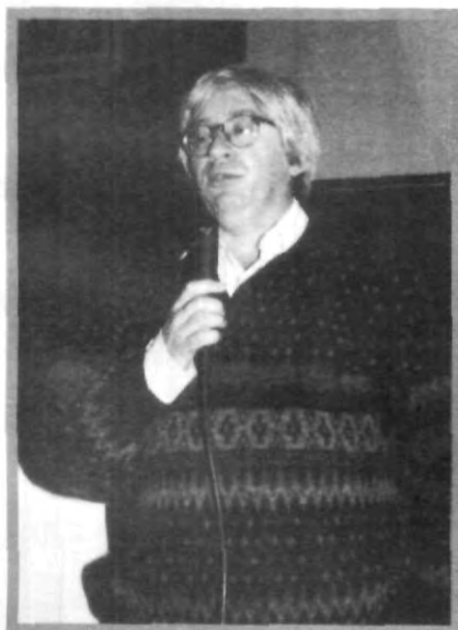
UNA DE LAS PONECIAS EN EL CONGRESO

Por último, indicó que en el sector artesanal ya existe en la ciudad de Puebla la casa del artesano, la cual brinda capacitación y albergue, además de que se tienen programadas otras dos casas en Cuetzalan y Acatlán.