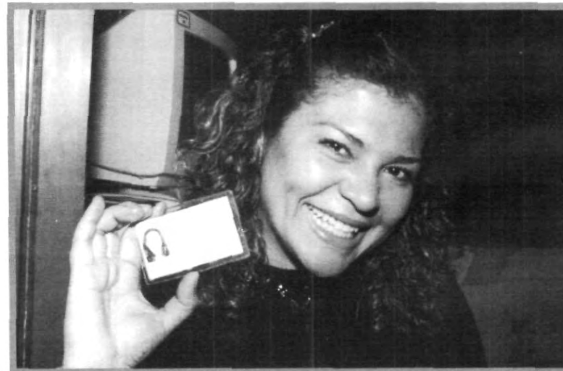
NO TE OLVIDES DE PORTAR TU CREDENCIAL AZUL EN EL CUC

en el módulo de asignación de equipo y no tiene validez en otros departamentos. Además sólo es válida al presentarla junto con la credencial vigente de la UPAEP, así que si no la tienes, solicítala en el tercer piso del Centro de Cómputo.