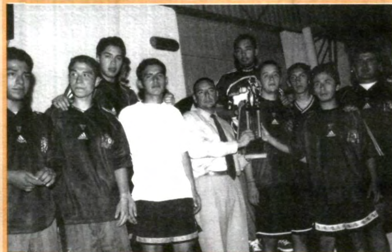
FINALIZÓ EL TORNEO INTRAMUROS

pero no lograron anotar más goles debido a que sus rivales en el segundo tiempo reaccionaron y se fueron a la ofensiva, aunque como ya se mencionó Las Pirinolas se defendieron bien.