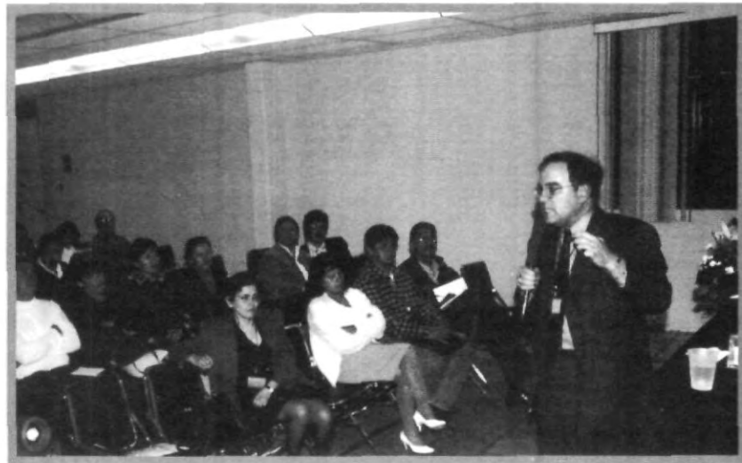
ESPECIALISTAS EN PEDAGOGÍA PRESENTES EN EL CONGRESO

educación, por primera vez en 1992 se mencionó este término pero sólo existía en el reglamento interior junto con el organigrama de la SEP, y si éste cambiaba podía desaparecer; ahora por estar en el artículo 41 de la ley no hay ningún problema.