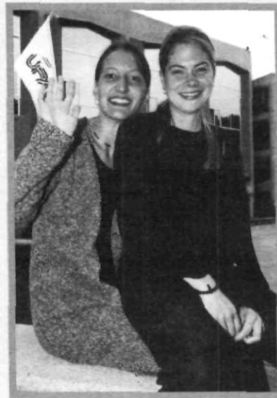
TAMBIÉN ALEMANIA SE IMPONE

Puedes escoger entre más de 200 colleges y universidades en los Estados Unidos y