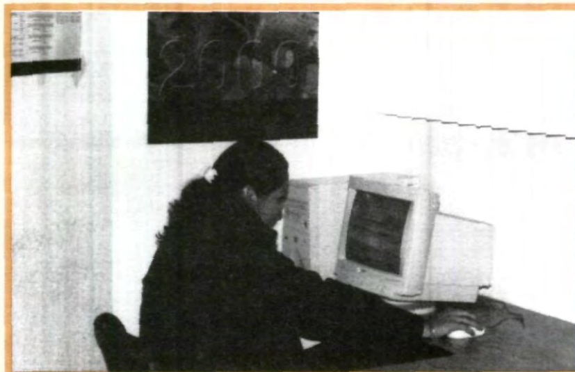
NUEVAS INSTALACIONES PARA TI