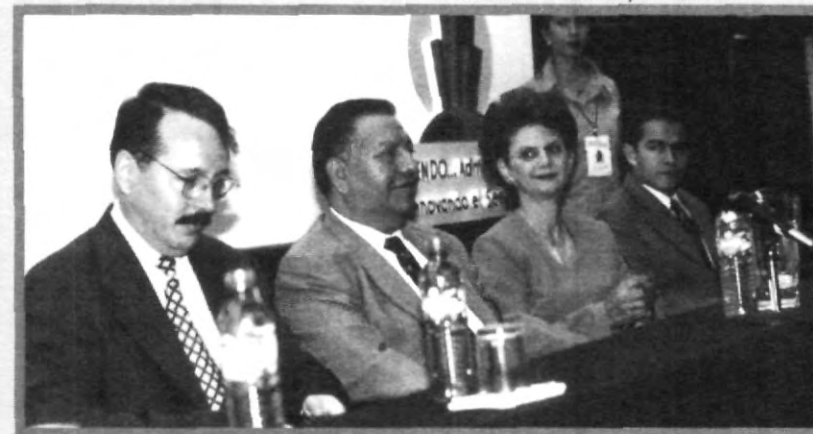
CONGRESO DE INSTITUCIONES

prácticas profesionales, pues en algunos lugares no dejan ejercerlas y ¿cómo adquirir la experiencia que luego nos requieren? a esta incógnita las personalidades que se presentaron dijeron tener las puertas abiertas los estudiantes que las requieran, pues ellos saben que es parte fundamental de nuestra educación académica y laboral.