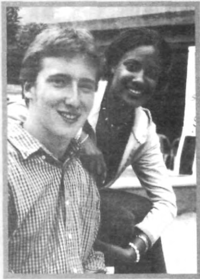
DESDE IOWA, PRESENTES

Como ya has visto a lo largo de este semestre, hay alumnos de intercambio de diversos países como Estados Unidos, Alemania y Holanda. Tú también puedes irte