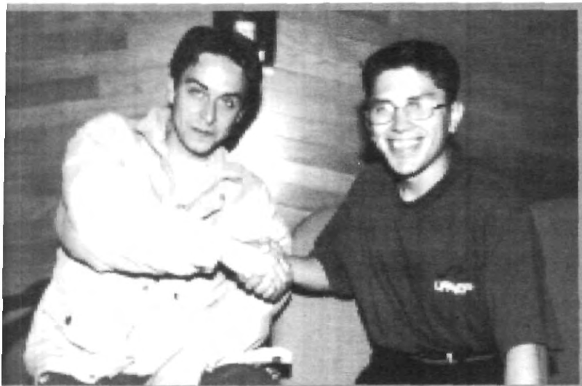
LISTOS PARA TRABAJAR, DESPUÉS DE LAS ELECCIONES

■ DEPARTAMENTO DE FÍSICA El Departamento de física está llevando a cabo un foro sobre radioactividad, las conferencias se realizarán en la Sala Francisco de Vitoria y en el Edificio "C".