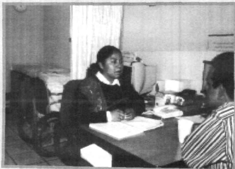
EL DEPARTAMENTO DE SALUD UNIVERSITARIA, A LA VANGUARDIA