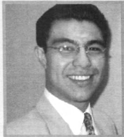
CREADOR DE LA PÁGINA DE MEDICINA

El sitio web de la facultad de Medicina de la UPAEP brinda un amplio centro de investigación con acceso texto completo a las principales publicaciones de consulta médica disponibles en Internet, con más de