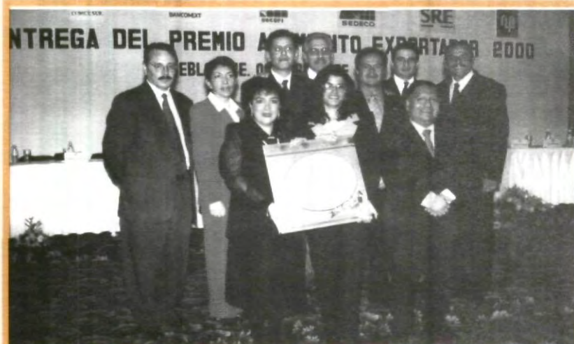
ENTREGA DEL PREMIO NACIONAL DE EXPORTACIÓN 2000

Señaló que a nivel nacional este tipo de