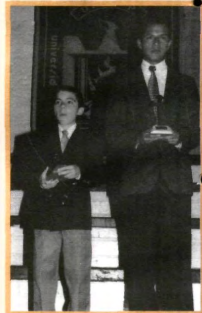
SECUNDARIAS Y BACHILLERATOS PRESENTES