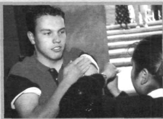
FINALIZÓ EL PROCESO DE VACUNACIÓN DE SALUD UNIVERSITARIA