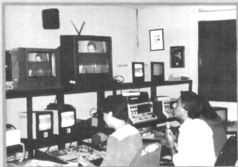
UNA VISTA AL CETEC

Cabe destacar que el estudio televisivo UPAEP cuenta con equipos de producción y edición digital, vía computadoras, las cuales están a la altura de cualquier medio de comunicación televisiva, y sobretodo a disposición de los alumnos.