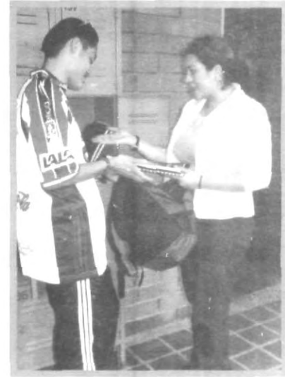
LOS CASILLEROS: BUENA ESTRATEGIA PARA LA SEGURIDAD

Esta bien hijos, gracias por sus recomendaciones para mejorar el sistema de seguridad en la uni, pero ustedes también háganse responsables de sus cosas.