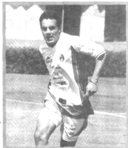
CUAUHTÉMOC BLANCO, SE PONE SU PRECIO

Cauhtémoc gana poco por ahora, pero eso es sólo el comienzo y además pone en alto a México.