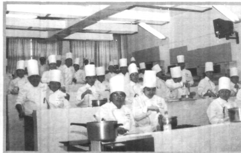
LA HIGIENE ANTE TODO EN EL LABORATORIO DE ALIMENTOS

contar con un equipo mas profesional y así poder brindar mayor higiene para la preparación de los alimentos como para la presentación de los alumnos.