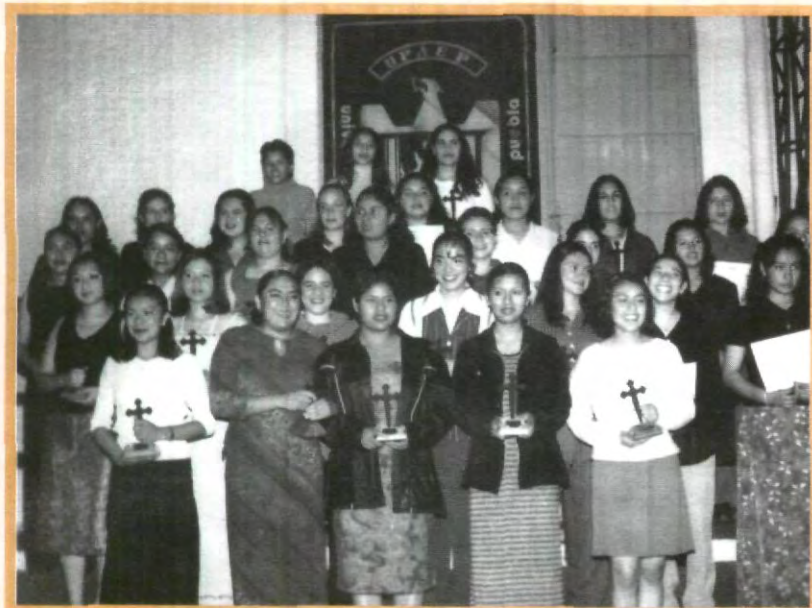
TRADICIONAL CEREMONIA DE CRUZ FORJADA

Declaró que a lo largo de la vida se tienen muchas dudas, sin embargo poco a poco se afila el perfil; algunas veces es un proceso doloroso, porque bien dicen que crecer duele, pero no cabe duda de que se necesita estar convencido de lo que se está haciendo; agregó que se debe encauzar toda esa energía y no desperdiciar el tiempo, porque sólo hay una vida. Por último, agradeció a Dios, a su familia, a la facultad de Medicina por formar una de sus metas y a los maestros por el tiempo dedicado.