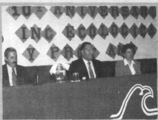
CON UN CICLO DE CONFERENCIAS ECOLOGÍA CELEBRÓ SU ANIVERSARIO