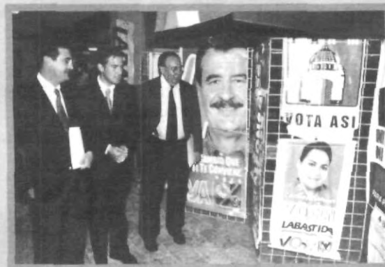
FINALIZÓ LA EXPOSICIÓN DEL ENCUENTRO UNIVERSITARIO DE CICOM Y CIPOL