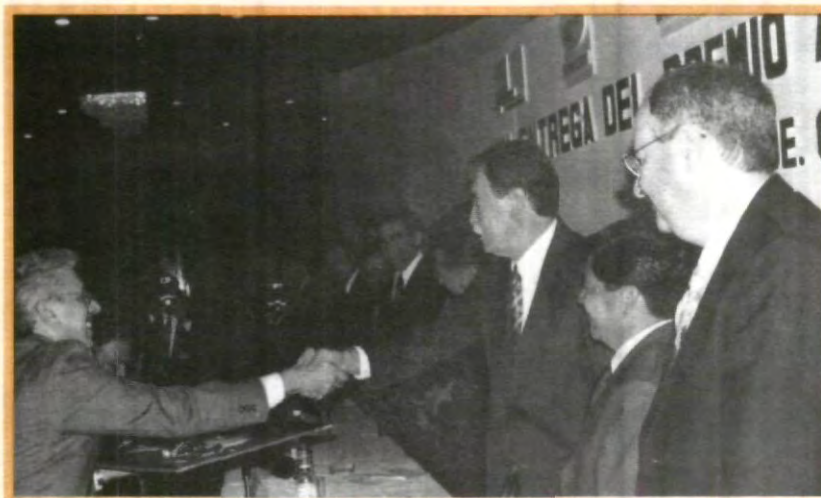
PREMIO REGIONAL PARA LA UPAEP

La UPAEP extiende una felicitación a la facultad de Comercio Internacional, por los méritos obtenidos desde su apertura, ya que esto refleja la excelente formación profesional de los alumnos y la gran calidad de los catedráticos que laboran en la institución.