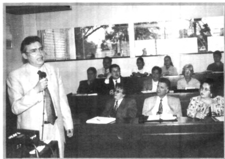
NUEVOS REGLAMENTOS PARA ALCANZAR LA EXCELENCIA ACADÉMICA

Cabe destacar que los reglamentos actuales y los miembros del Consejo Universitario se encuentran en la página electrónica de la UPAEP ( http://web.upaep.mx/ ) en el índice de Vida Académica, apartado Consejo Universitario, de este modo, los alumnos y catedráticos interesados podrán acceder a los reglamentos y saber dirigirse a sus consejeros para proponer conjuntamente las modificaciones.