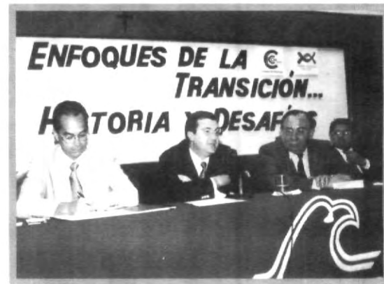
PRESIDENTES DE LOS PARTIDOS POLÍTICOS

1) inculcar una nueva política incluyente entre