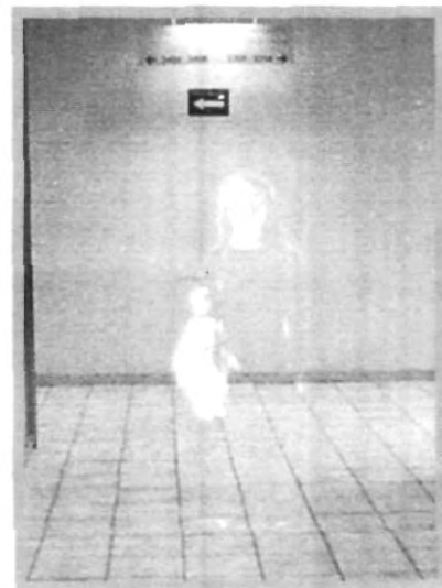
FANTASMAS, ¿MITO O REALIDAD?

filtros rojos de seguridad, otros más que en el momento de pasar la imagen impresa en el papel por los químicos, éste se velaba. Pero la ocasión mas difícil fue cuando al tratar de imprimir las fotografías para la procesión de Viernes Santo de ninguna forma se pudo lograr y sucedió todo lo antes mencionado, y por otra parte, no faltan las personas que por molestar o asustar más a sus compañeros jugaban bromas jalándoles el cabello, moviendo las cosas del lugar designado, azotaban puertas y prendían luces sin motivo alguno, haciéndose los que no sabían lo que sucedía