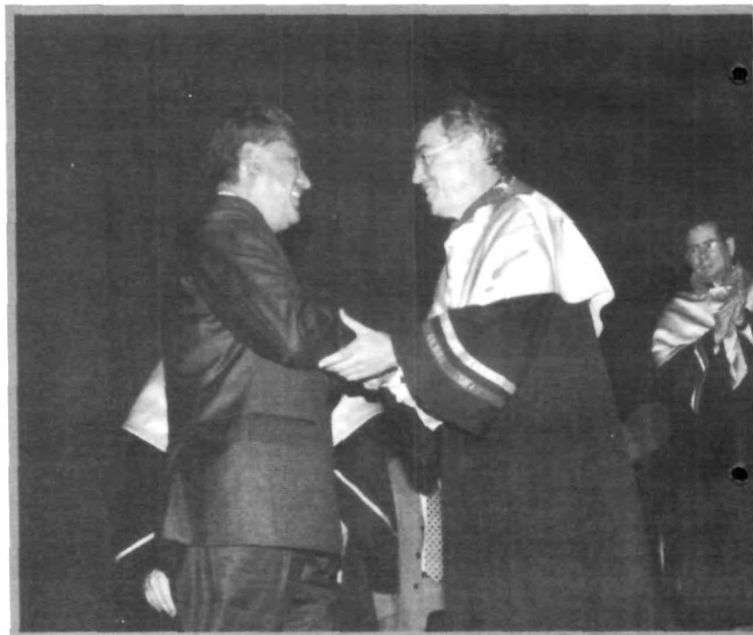
EL GOBERNADOR DURANTE EL INFORME DEL RECTOR

También vale la pena mencionar los trabajos que la universidad ha realizado para evaluar el funcionamiento de la propia universidad y su aportación a la sociedad poblana. El sistema de categorización basado en una cultura de planeación y de evaluación permanentes que permite guiar esfuerzos de superación, nuevos programas de maestrías y la colaboración académica con instituciones nacionales e internacionales, la participación de los estudiantes en el