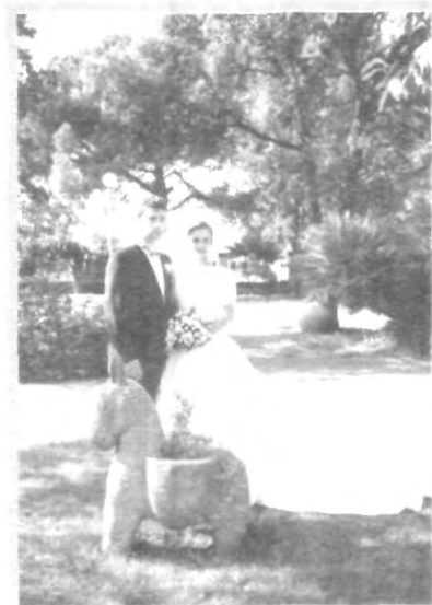
¿TE CASARÍAS POR INTERNET?