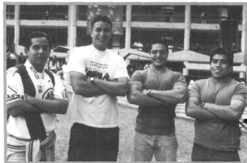
FEO, FUERTE Y FORMAL, CARACTERÍSTICA DE LOS HOMBRES

Con esto se demuestra, que se pueden encausar sanas actividades recreativas con la solidaridad y el compañerismo a quien lo necesita.