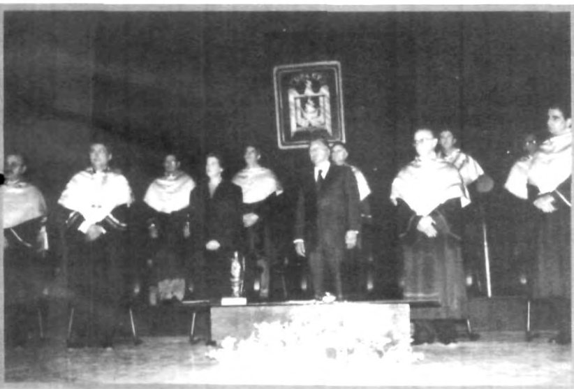
PRIMER INFORME DEL RECTOR

El Rector de la universidad concluyó agradeciendo a toda la comunidad universitaria por el apoyo recibido y sin el cual nada se hubiera realizado y señaló que el cambio, si bien se debe extender a toda la universidad, también debe ser de carácter personal, ya que es necesaria la reflexión individual que busque un paralelismo entre la apetencia, la vocación persona y los fines de la universidad, es una "visión compartida, que lleva a la acción, a la transformación de la realidad, con la que cada uno se compromete, en ambientes de confianza, de libertad, de creatividad, de exploración de nuevas formas, es trabajo y aprendizaje en equipo y es abandono de estructuras funcionales rígidas, por una organización flexible, sistémica, por procesos".