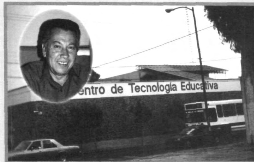
EN BUSCA DE LA TRANQUILIDAD SE INCREMENTA LA VIGILANCIA

Además, el Jefe de Vigilancia reconoció que uno de los problemas con los que se enfrentan los cuidadores, es la familiaridad que muestran las personas al acercarse a los coches, ya que es difícil dudar que sean los dueños, debido a que abren los coches con llaves, finalizó.