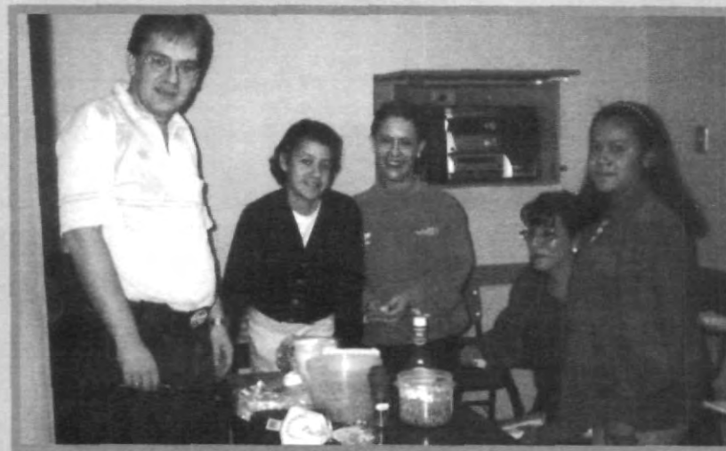
LA INTERACCIÓN FACILITA EL APRENDIZAJE

imparten los 16 niveles hasta concluir con el examen gute, que es lo más alto del mismo idioma.