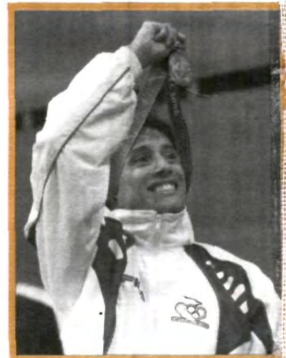
MÉXICO: MEDALLA DE PLATA

final, que definió el reparto de las medallas de oro y plata.