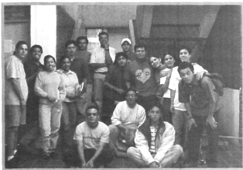
CADA VEZ SON MÁS LOS INTEGRANTES DEL GRUPO OLLÍN

descubran lo interesante que es la cultura a través de las sesiones culturales que se llevan a cabo todos los días lunes a partir de las 17:00 horas, hasta las 20:00 horas, con la promesa de que pasarán un rato de diversión, convivencia y aprendizaje.