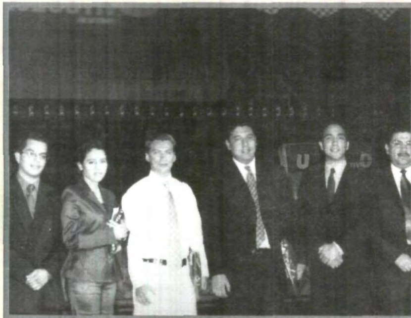
LA UPAEP NUEVAMENTE TRIUNFA

Por último, los trece equipos finalistas en el torneo de Mundo Ejecutivo participarán en las eliminatorias entre universidades y altos ejecutivos de empresas, para que los ganadores viajen en el mes de enero a Portugal para representar a México en competencia mundial, en la cual se reunirán 25 países y en donde la UPAEP, una vez más tendrá la oportunidad de lograr buenos resultados.