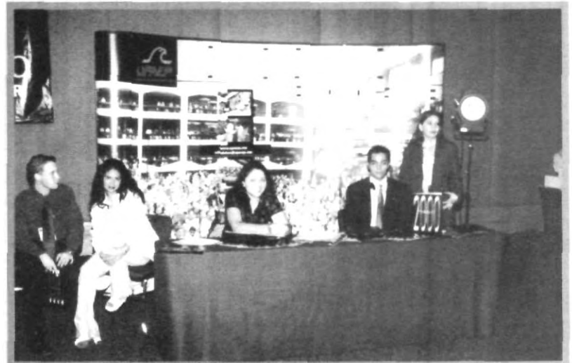
LA UPAEP PRESENTE DURANTE EL CUNI