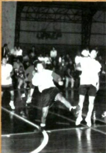
CONTINÚA TORNEO INTRAMUROS