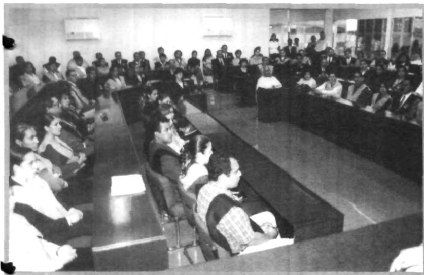
ELECCIÓN DEL NUEVO CONSEJO UNIVERSITARIO

de 10 a 12 hrs en la sala Francisco de Vitoria. ¡No te lo pierdas!