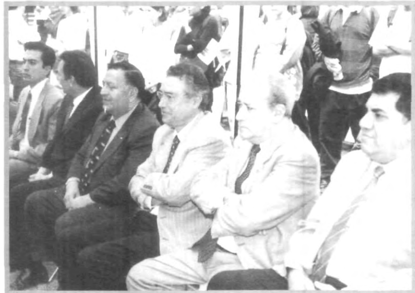
AUTORIDADES PRESENTES EN LA PRESENTACIÓN DE LOS GRUPOS

• Para los que se preocupan por la ecología, el grupo "Cultura del reciclaje" te espera. En el ámbito de la cultura y expresión de ideas, el grupo cultural "Ollín" tiene un lugar para ti. Aquellos estudiantes de Chiapas, Oaxaca, Veracruz o Morelos, pueden unirse a las asociaciones estudiantiles de estos estados, y convivir dando a conocer su