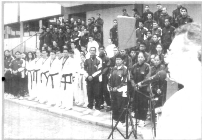
LOS DEPORTISTAS PRESENTES EN EL MIÉRCOLES DE INTEGRACIÓN

Que no se te olvide que la mejor manera de integrarte a tú universidad, es participando, únete.