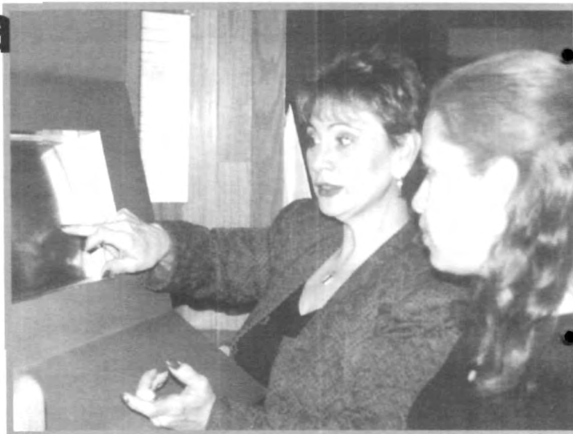
EL PERSONAL DEL CAE SIEMPRE ESTA PARA SERVIRTE

P. Tiene funciones de información académica, se les da su estado de cuenta y kardex impreso, su número de NIP (Número de Identificación Personal) para que puedan acceder a las computadoras de las universidades. Además elaboramos diferentes tipos de constancias: Constancias parciales de estudios y de inscripción, Constancia con materias del semestre en curso, Constancia con materias y calificaciones del semestre