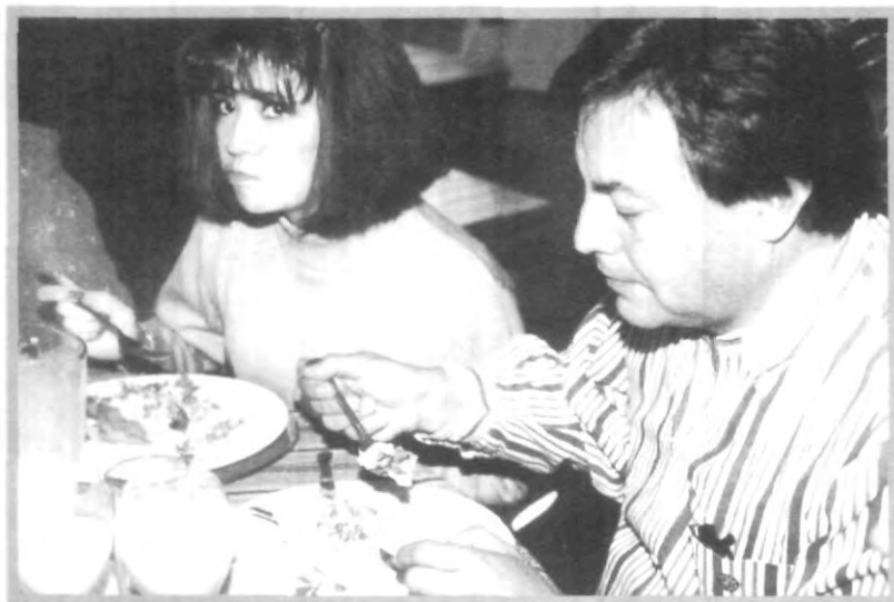
LOS ASISTENTES QUEDARON SATISFECHOS CON EL EVENTO

A alumnos de quinto semestre de Administración de Instituciones de la UPAEP, mostraron sus conocimientos en el arte culinario con la tradicional comida "Chiles en nogada", que se llevó a cabo en días pasados.