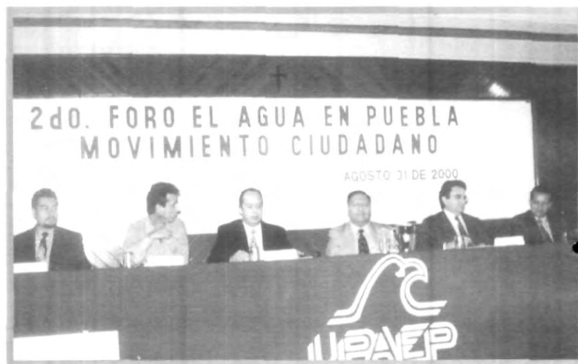
POR UNA CULTURA DEL AGUA: SEGUNDO FORO EN LA UPAEP

Comentó que con la contaminación, se arruinan los pozos de agua potable, se impide la acuicultura, se provocan