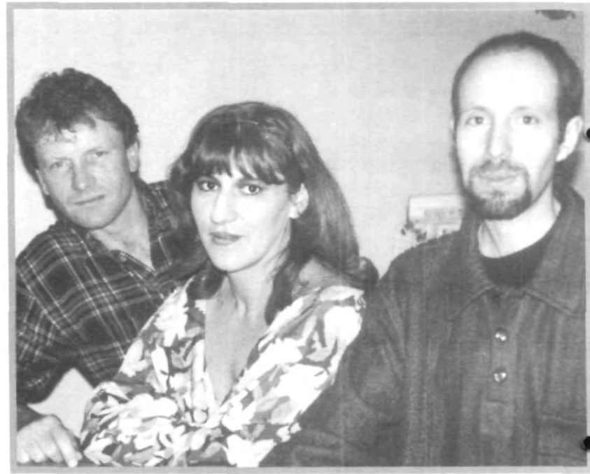
INTÉGRATE A LAS CLASES DE FRANCÉS

Explicó que es de suma importancia que dentro del salón de clase se brinde al alumno un ambiente y un contexto en el que se presenten aspectos culturales y expresiones ideológicas, esto para una mejor comprensión y asimilación del idioma, concluyó Robert Guy.