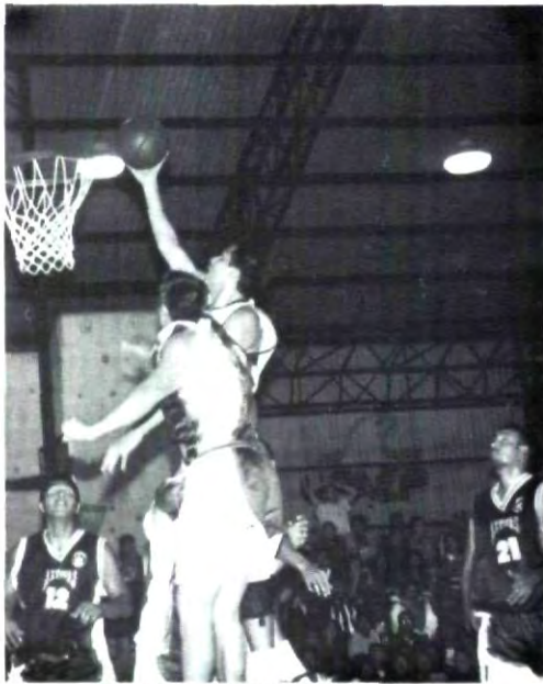
El clásico UPAEP-UDLA