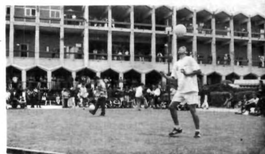
Participantes en acción