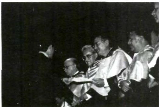
Con mucho orgullo, los alumnos recibieron su premio de Cruz Forjada