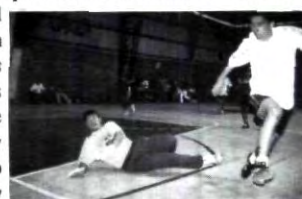
Gran éxito de los intramuros