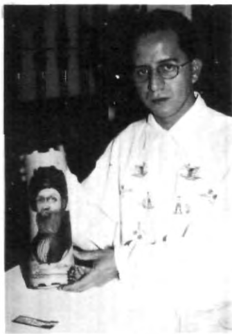
Obras en Bambú

Las piezas tienen una medida que oscila entre los 13 y 41 centímetros de altura, entre las piezas destacan "El David", "El autorretrato de Leonardo Da Vinci", "La Pieta", (1470) de Giovanni Bellini, y "El Retrato de Baltazar de Castialione", fragmento de Raphael, entre otros.