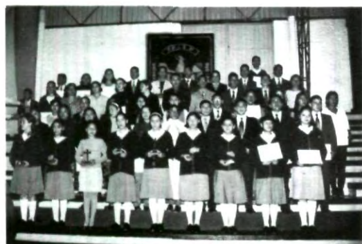
Estuvieron presentes los bachilleratos incorporados

hedinismo, materialismo y egoísmo, pareciera ser que la misión de las universidades ha sido totalmente desvirtuada y lo único que buscan es egresar gente que pueda participar en un mercado de trabajo como si fuera un producto más.