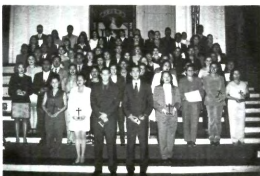
Alumnos de Comercio Internacional

Es necesario entonces que la universidad sea un freno a esta deshumanización que se vive en nuestros medios, que la universidad del mañana sea la responsable de transformar a la sociedad para poderla llevar al bien común y al fin único por la cual fue creada.