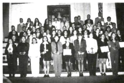
780 premiados en total