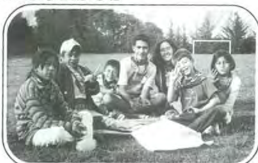
Unas vacaciones inolvidables para éstos niños de esta semana algo inolvidable para los niños.

En esta ocasión, se trató de hacer realidad el sueño de estos niños, sacándolos un poco de la monotonía del ambiente en el que viven y del cual rara vez han salido, para llevarlos a un lugar mágico llamado "El Temazcalito" donde todos sus sueños pueden lograrse y además convivieron con criaturas fantásticas como hadas, duendes, bufones y hasta uno que otro árbol que ¡habla!