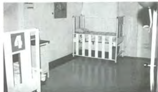
Modernas y funcionales instalaciones