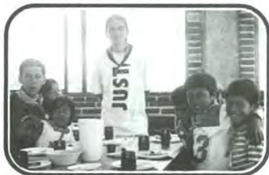
Con muy poco se puede hacer mucho

para tí, tus familiares o amigos Informes: 21 sur No. 1103 edif "A", 3er. piso Tels: 2-29-94-68 (directo) 2-29-94-00 ext.603