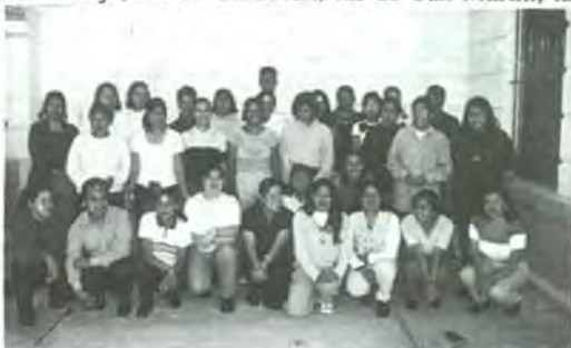
Alumnos de nuevo ingreso en la escuela de Enfermería

* Reclutamiento miércoles 8 de septiembre