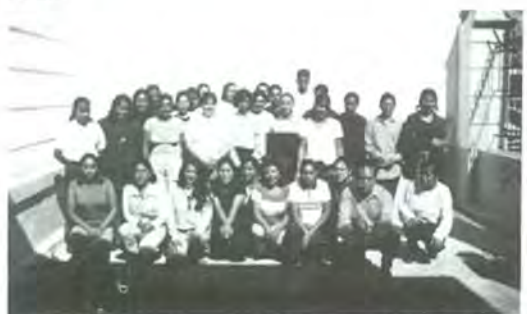
Animada bienvenida organizó la escuela de Enfermería

jarochas, las oaxaqueñas, nuestras paisanas y los tres hombres que ingresaron, disfrutaron en grande de ésta fiesta.