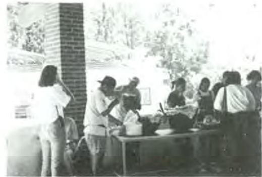
El Director de la Escuela convivió con sus alumnos

Se disfrutó la tradicional taquiza, que consistió en un menú original y muy rico, desde tacos de pipián verde hasta taquitos de mole y demás. Se convivió