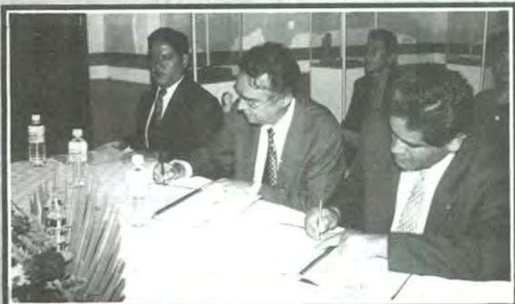
Se firmó un convenio de servicio social con la Presidencia Municipal de San Andrés, Cholula