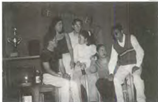
Un buen mensaje se imprimió en esta obra, que sale de gira

¡Atención! Tehuacán, Huamantla, Tlaxcala, y bachilleratos, D'Generación próximamente más cerca de ti.