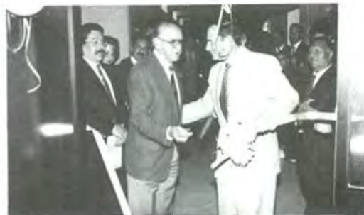
Momentos del corte de listón inaugural