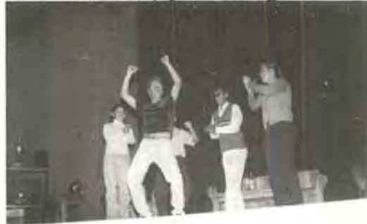
Alumnos de la Escuela de Ciencias de la Comunicación en escena