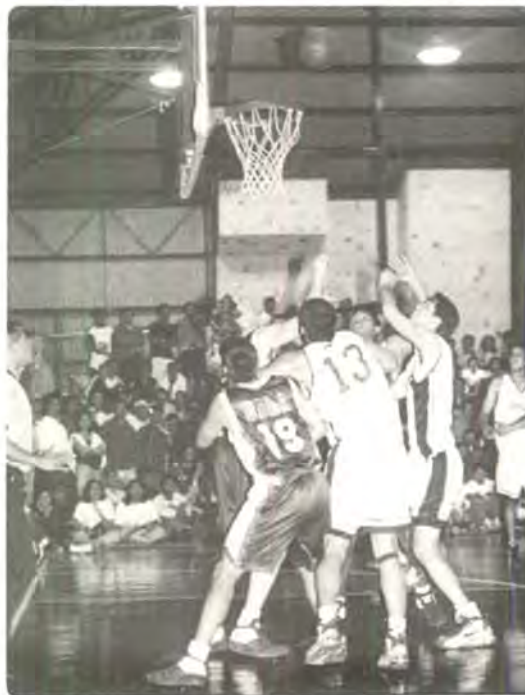
El basquetbol arranca con todo