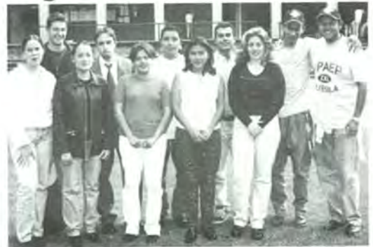
¡FELICIDADES! a todos los participantes

nal que se celebra en una ciudad diferente cada año, habiendo sido sede de este importante evento en años anteriores las ciudades de Palo Alto, en Estados Unidos; Tokio, Japón; Atlanta, Estados Unidos y Bruselas, Bélgica para este año 1999. Adicionalmente, cada país de los participantes en este evento organiza su propia competencia local, de las