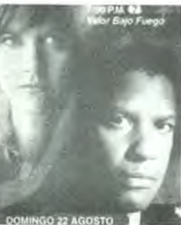
DOMINGO 22 AGOSTO

"Trilogía del 5", estará el gran actor Robert Williams, de estas 3 sobresale la cómica película de "Papá por siempre", donde una vez más hace nombre a su larga trayectoria como actor, ya que muestra una perfecta personificación de aquel padre amoroso que hace hasta lo imposible por conservar unida su familia a tal grado de