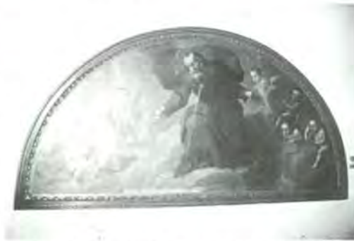
Una de las obras que puedes admirar