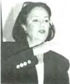
Interesante curso impartió la Escuela de C.P.

Y algo interesante de todo esto es que no necesitas ser de Contaduría Pública para poder asistir a este seminario, pueden asistir tanto estudiantes de cualquier carrera, el caso es que les interesa las técnicas de estudio para mejorar su aprendizaje. Por ejemplo, a los estudiantes de comunicación les sirve para poder corregir su ortografía o redacción para que cuando estén dentro de un medio puedan