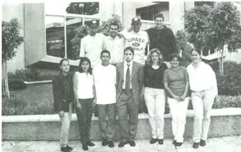
Grupo de participantes en la competencia mundial de negocios internacionales

Estas oportunidades están a disposición de todos los alumnos de la UPAEP a través de Promic-DESEM, en la 9ª poniente 1715, al teléfono 232 77 59 o correo electrónico fmaldona@upaep.mx . Mucha suerte y éxito a los jóvenes emprendedores de la UPAEP en Bélgica y estaremos esperando sus noticias!