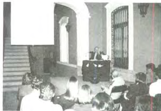
Los amigos del museo siempre presentes

Próximamente se presentará la exposición "Cuadros y Esculturas Barrocas" que estará acompañada de un ciclo de conferencias del 13 de mayo al 22 de julio en la 3 norte No. 3 Museo UPAEP ¡no te las pierdas!