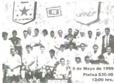
El equipo de las estrellas

llevará a cabo en punto de las 12 de la tarde en el estadio del Puebla de la Franja. Los boletos están a la venta en nuestra universidad y su precio es muy accesible.