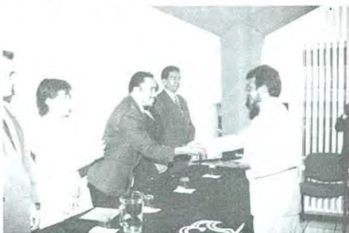
Momentos de la ceremonia de premiación a los maestros

Los premiados estuvieron acompañados por sus familiares y amigos, quienes apoyaron la labor que hacen de transmitir no sólo sus conocimientos, sino toda una educación completa a través de su ejemplo que se da con amor a la profesión y a los propios estudiantes en quienes se quiere formar un serio compromiso de ser cada día mejores y estar preparados para enfrentar los retos que nos presenta el nuevo siglo.