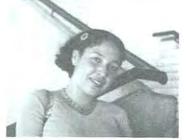
Perla Barreto/CICOM 4° "En primer lugar un nivel académico, que cada vez se supere y en segundo lugar la existencia de valores que mantengan despierto un verdadero sentido social"