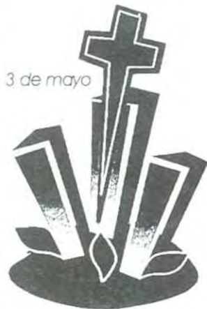
Día de la Santa Cruz.

Por la mañana se hizo la premiación en la Capilla del Edificio "C", para que después se llevara a cabo la Parada de la Santa Cruz y la bendición de la obra, Capilla Universitaria. Más tarde se realizó un almuerzo con motivo de esta fiesta y después hubo un partido amistoso de fútbol de profesores contra alumnos de la Facultad de Arquitectura.