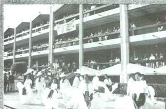
Buena respuesta ha tenido la Primera Semana de la Expresión Universitaria en la UPAEP, aquí vemos un bailable Veracruzano