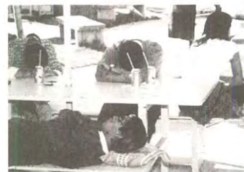
Y dicen que vienen a estudiar