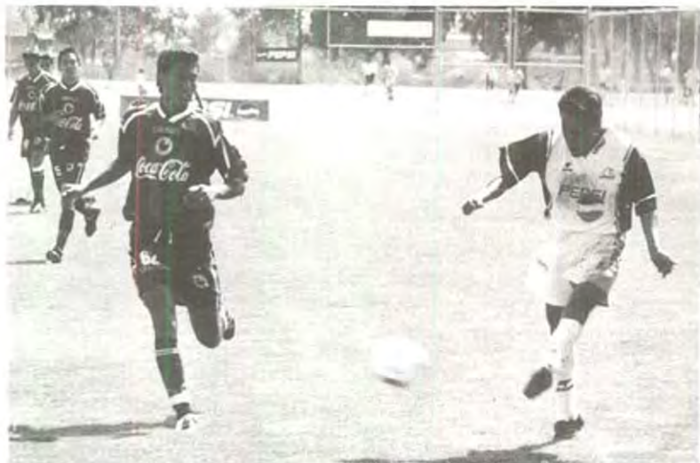
Las Águilas UPAEP vencieron 3 - 2 al Atlético Carmen