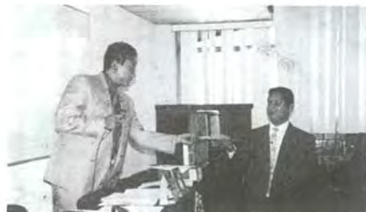
Integrantes del programa C.D. durante el evento

In conclusion to have achieved a place in Mese Challenge's contest has given us confidence, and even if we didn't reach a place we would be happy because we had a tremendous experience.