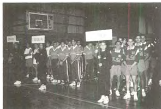
El 26 de abril empezará la 16a edición de las Interprepas

¡Toda una tradición!, el torneo interprepas se llevará a cabo por decimosexta ocasión en nuestra casa de estudios desde el lunes 26 de abril.