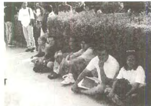
...Siempre en primera fila.

"El hombre debería decir siempre mucho más de lo que pretende...y pretender mucho más de lo que dice"