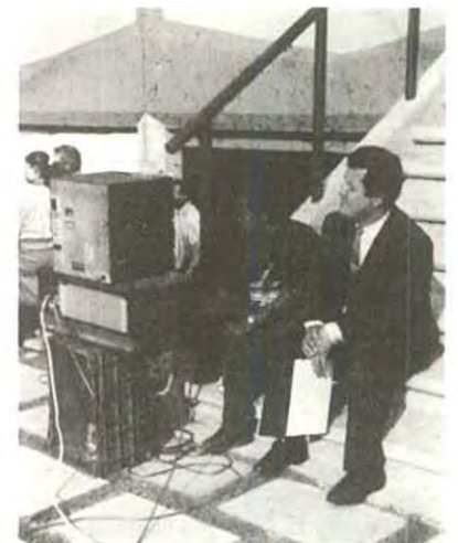
¿A qué hora empezarán?