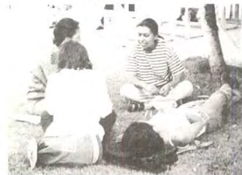
Acapulco en la uni.