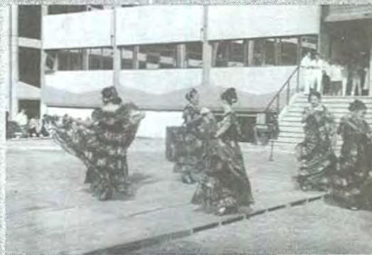
La comunidad Chiapaneca presente con sus bailables

de acuerdo a su lugar de nacimiento, dando un ejemplo de identidad nacional.