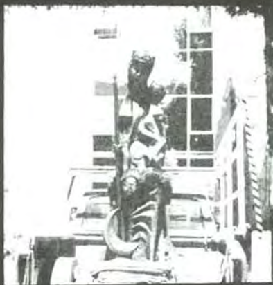
La escultura de la Virgen cuando llegó a la un