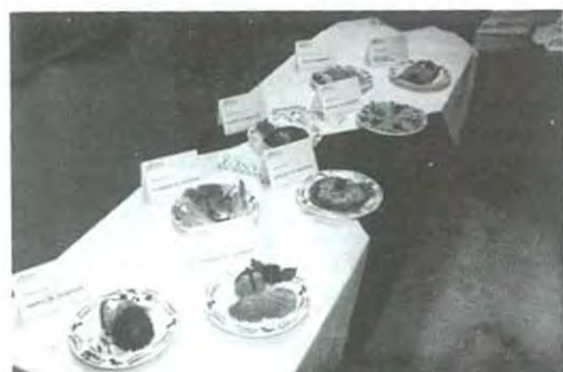
Se disfrutó de una gran variedad de platillos, tanto dulces como salados.