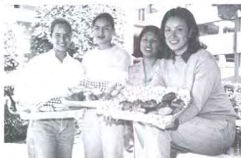
Disfruta de un exquisito desayuno en "Nuestro Café"

Caminando por la fuente de la universidad me encontré con cuatro estudiantes de Comercio Internacional quienes con una sonrisa en los labios caminaban con una charola nada