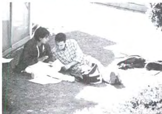
¡ Es la última vez que te lo explico !

Curso básico de internet viernes 26 de febrero de 10:00 a 11:00 a.m. inscripciones en Biblioteca Electrónica