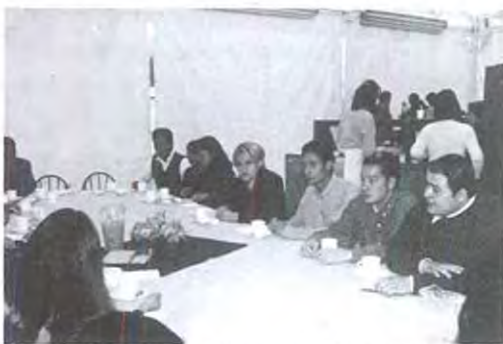
Los alumnos convivieron durante varias horas con el Rector

Por otra parte los alumnos de CICOM expresaron la necesidad que se tiene en el CETEC porque no hay suficiente equipo de cámaras y micrófonos, así como presupuesto para la escenografía del programa que realizan los jueves a las 7:30 pm., el cual aporta cultura de una manera interesante, divertida y actualizada. Al acuerdo que se