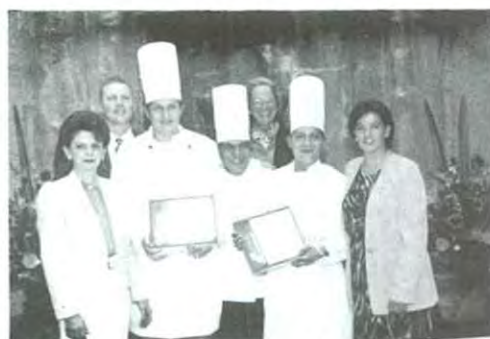
Ganadores del primer lugar del "Festival del cacahuate"