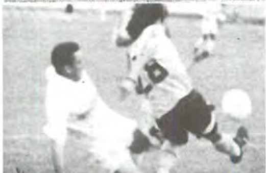
El equipo de fútbol rápido ha mostrado amplio dominio

El equipo varonil de fútbol rápido, campeón nacionales de CONADEIP, ha mostrado amplio dominio en el estatal del CONDDE, a pesar de sus bajas.