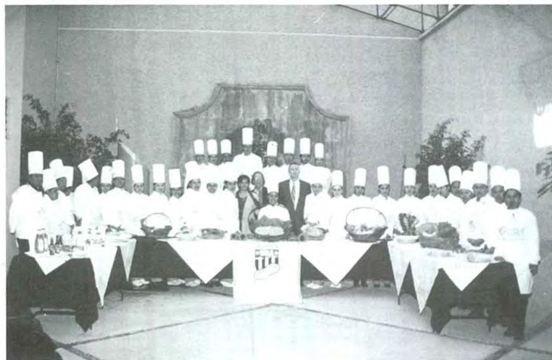
El grupo de alumnos que participó en el evento del cacahuate, acompañados por integrantes del Consejo del Cacahuate Americano y la Directora de la escuela

Los alumnos de la Escuela de Administración de Instituciones organizaron el "Festival del Cacahuate", en donde prepararon una serie de platillos: dulces y salados, con lo que aprendieron a utilizar esta leguminosa de diversas maneras.