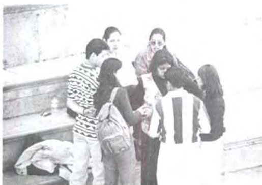
Nos toca de a $ 5.00 para el pastel