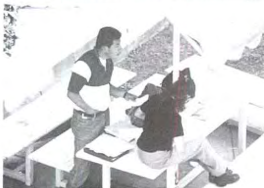
Estilo para estudiar