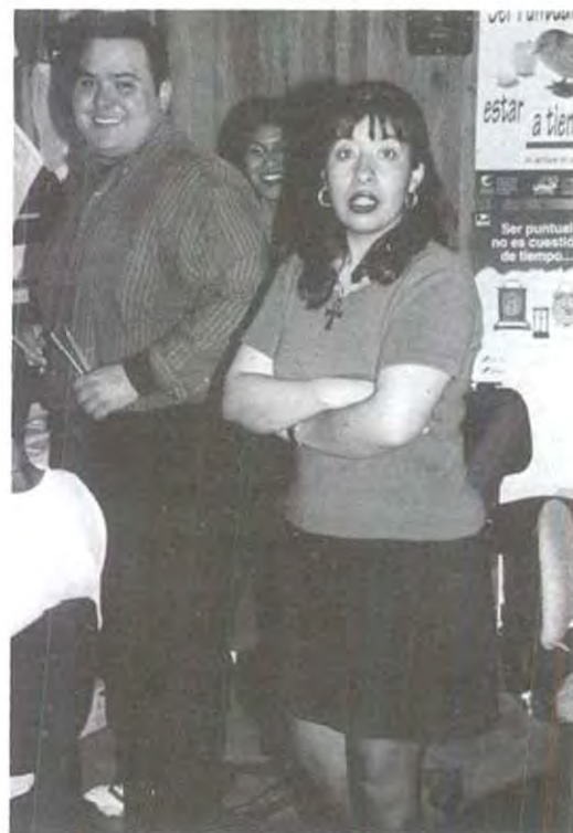
¡Jesús! ¿tú aquí?