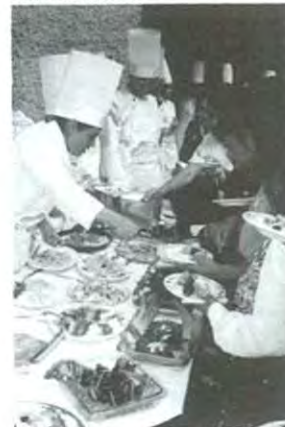
Deliciosos platillos se degustaron en la muestra

Todo empezó desde las 9:00 a.m. y terminaron a las 12:30 horas con la premiación por parte del Consejo del Cacahuate Americano.