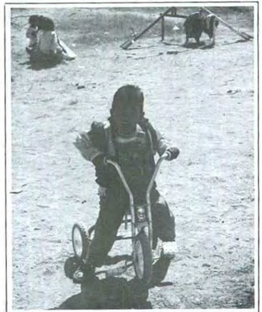
Más de 400 personas lograron arrancar sonrisas a los niños