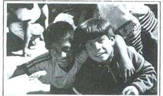
Las ilusiones de los pequeños se vieron realizadas