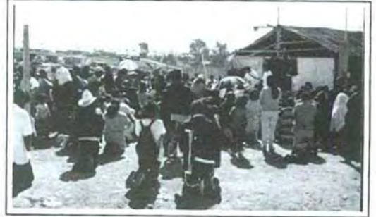
La misa fue uno de los elementos de reunión para celebrar este día