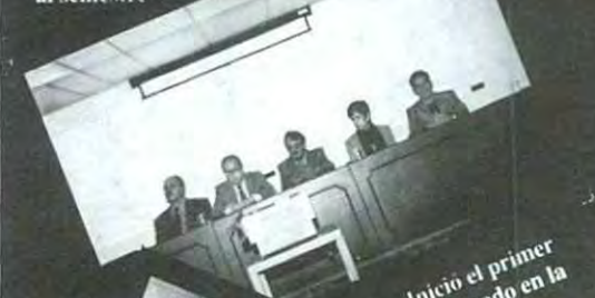
Inicio el primer Doctorado en la UPAEP