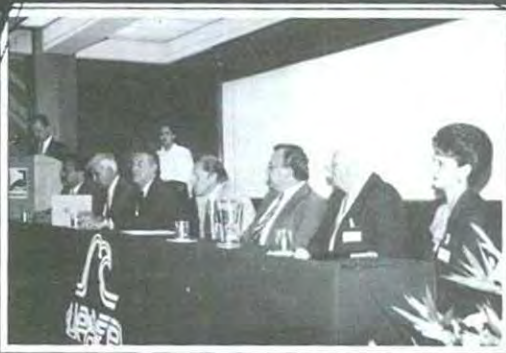
Se inauguró el primer curso de Administración Turística