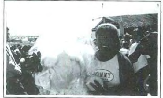
Esperemos que los Reyes Magos sigan con esta labor año tras año