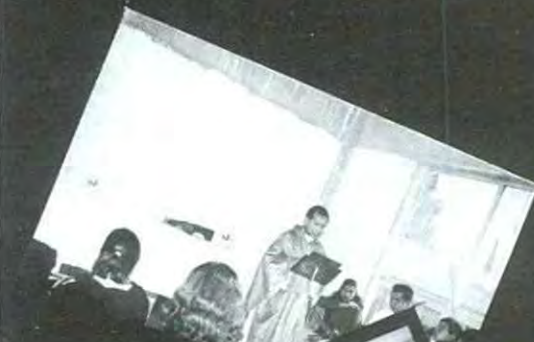
La misa con la que dimos inicio al semestre

¡Unete y participa en todas y cada una de las actividades que te ofrece tu universidad!