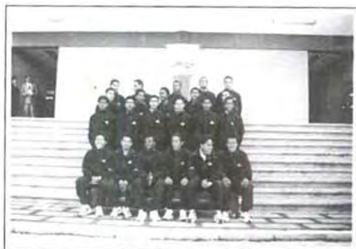
Integrantes del equipo de fútbol de la segunda división