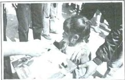
Los juguetes fueron casi insuficientes para el número de niños

pre, sino que a través de las cartitas de las pequeños el amor pudo hacer un huequito en el corazón y sembrar una sensación inolvidable para todos los que participamos. Muchos chavos nos decían que querían ayudar pero no tenían mucho dinero para la bicicleta que el niño había pedido, a lo que nosotros les decíamos que lo importante era que lo diera con amor, fuera lo que fuera, y ¿saben qué? esos chavos, esas familias, en verdad son valientes, porque sacrificaron una ida a la disco, alguna ropa, algún gusto, con tal de lograr una sonrisa, con tal de lograr que un niño recupere esa inocencia perdida, esa ilusión que todos tuvimos de niños y que es hora de que podamos hacer que los que no tienen la oportunidad, la vivan... Mil gracias a todos, por entregar su tiempo, por dar su amor a costa de algún sacrificio, por entregarse a lo que en verdad vale la pena, a quienes en verdad valen la pena, pero gracias sobre