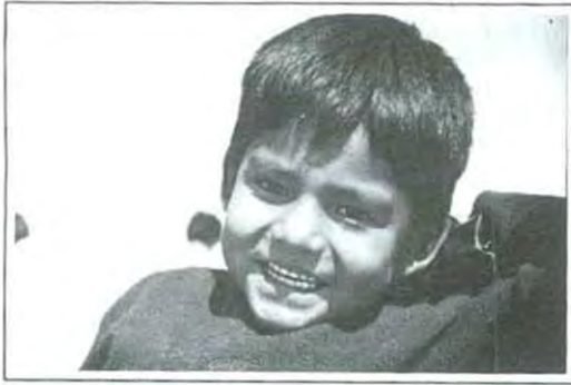
Una sonrisa no cuesta mucho