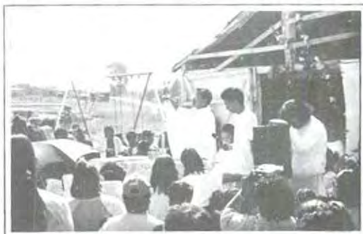
Momentos de la celebración eucarística