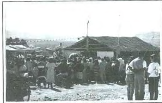
Vecinos de varias colonias se reunieron para este evento