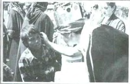
Los niños no lo podían creer

pre, sino que a través de las cartitas de las pequeños el amor pudo hacer un huequito en el corazón y sembrar una sensación inolvidable para todos los que participamos. Muchos chavos nos decían que querían ayudar pero no tenían mucho dinero para la bicicleta que el niño había pedido, a lo que nosotros les decíamos que lo importante era que lo diera con amor, fuera lo que fuera, y ¿saben qué? esos chavos, esas familias, en verdad son valientes, porque sacrificaron una ida a la disco, alguna ropa, algún gusto, con tal de lograr una sonrisa, con tal de lograr que un niño recupere esa inocencia perdida, esa ilusión que todos tuvimos de niños y que es hora de que podamos hacer que los que no tienen la oportunidad, la vivan... Mil gracias a todos, por entregar su tiempo, por dar su amor a costa de algún sacrificio, por entregarse a lo que en verdad vale la pena, a quienes en verdad valen la pena, pero gracias sobre