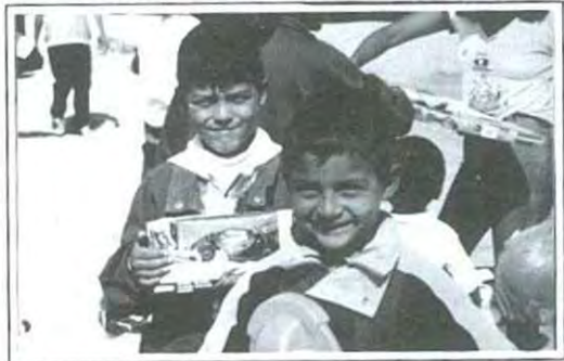
La participación de los universitarios hizo realidad su sueño