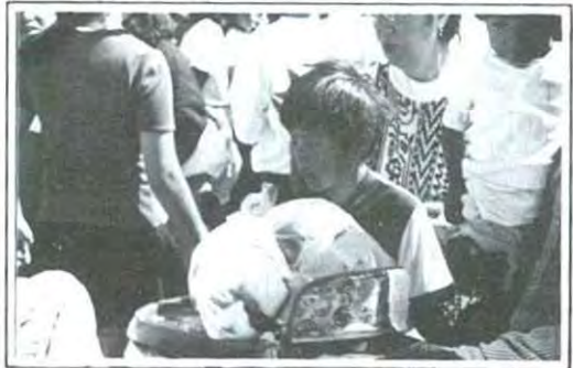
Las pelotas, las muñecas, los cochecitos y los peluches fueron los más socorridos