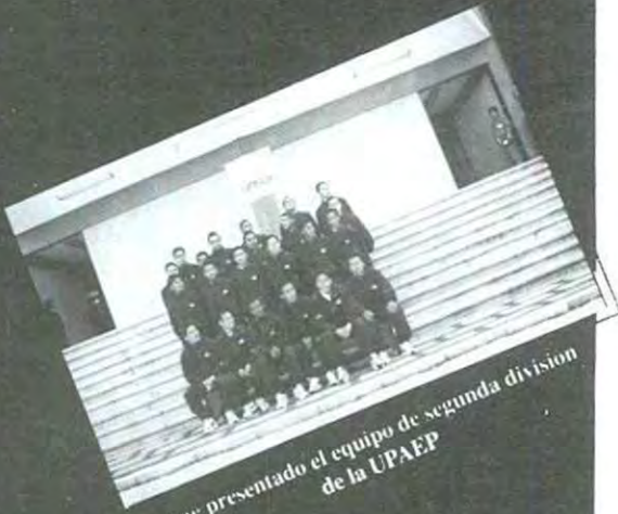
Fue presentado el equipo de segunda división de la UPAEP