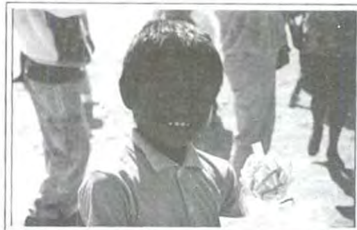
Las ilusiones no se perdieron este 6 de enero

Las cartas de los niños se repartieron a cada uno de los padrinos inscritos y fue así como comenzó a realizarse el verdadero milagro del amor: cuando la gente abría la carta y con el corazón en la mano comenzaban a imaginarse a "su niño", su carita llena de tierra, tal vez sin zapatos, con escasa ropa aún con un frío congelante, y sin pensarlo dos veces aceptaban el compromiso de hacerlo feliz siendo su "Rey Mago"...no hubo una sola persona que se retractara, al contrario, encantados de la vida iban a comprar los juguetes para sus niños, la mayoría sin la experiencia de tener hijos, muchos, muchísimos jóvenes convertidos de repente en padres llenos de cariño con la ilusión de hacer feliz a su pequeño, más cuando sabían que "ese" niño tal vez nunca tendría esa misma alegría por tener que