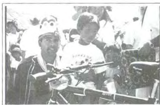
Los Reyes Magos personalmente entregaron los regalos