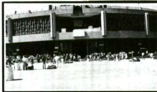
Se siguió con la tradición que se ha mantenido desde hace 19 años

Recuerda que porque tú tienes mucho que ver con nosotros... te esperamos el próximo semestre con nuevos retos y mejores propósitos y todo el equipo de "El Universitario" nos unimos para desearte una feliz navidad.