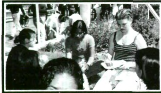
El trabajo en equipo ayudó para tener una mejor organización