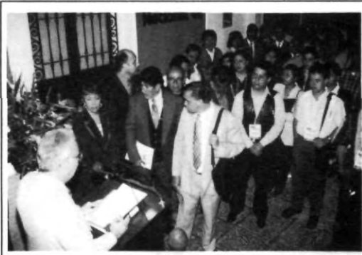
Con un emotivo discurso se llevó a cabo la inauguración

Por último agregó sentirse orgulloso de que la ciudad de Puebla les diera la bienvenida a todos los profesionales de la República