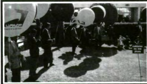
Así iniciaron los festejos del XXV aniversario

mucho, al grado que ha alcanzado dimensiones que la han llevado a competir con las mejores del país, es por ello que el compromiso por parte de todos los que formamos parte de la comunidad UPAEP, es cada día mayor para no defraudar la tarea que han llevado a cabo día a día desde los fundadores, hasta tú mismo al participar en cada uno de los eventos que