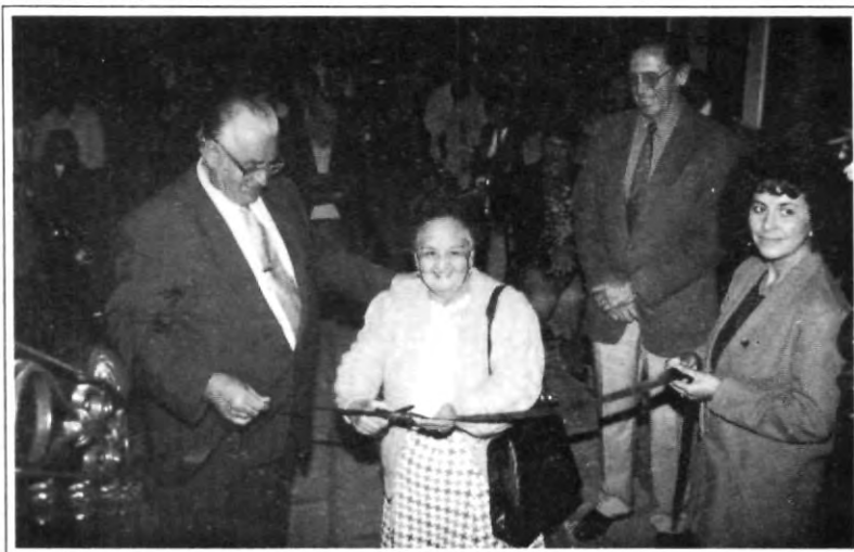
Momentos del corte de listón inaugural, de la exposición cristera

El historiador aseguró tener información de los