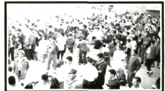
Los peregrinos dispuestos a salir

sol, cuando ya los peregrinos iniciaban el último trayecto en autobús hacia la exglorieta de Peralvillo donde tuvo lugar la última parte de la peregrinación, unidos a quienes acaban de llegar de Puebla. Con cantos, himnos y porras, todos juntos arribaron al atrio de la basílica donde ya nos esperaba su Eminencia Don Norberto Rivera Carrera, Cardenal y Arzobispo Primado de México, para celebrarnos la Santa Misa, que en presencia de Nuestra Señora, premiaba todos los sacrificios realizados.