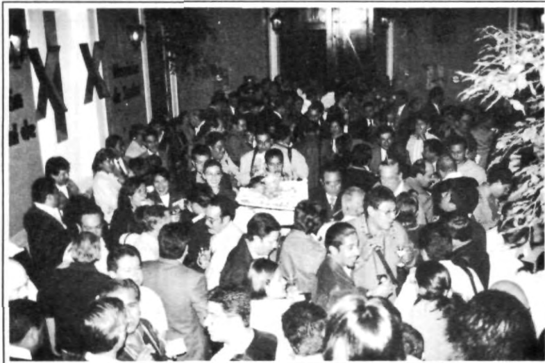
Reinó un gran ambiente en la inauguración del evento

Por: Miguel Angel Sainos Mendieta. 3º CICOM.