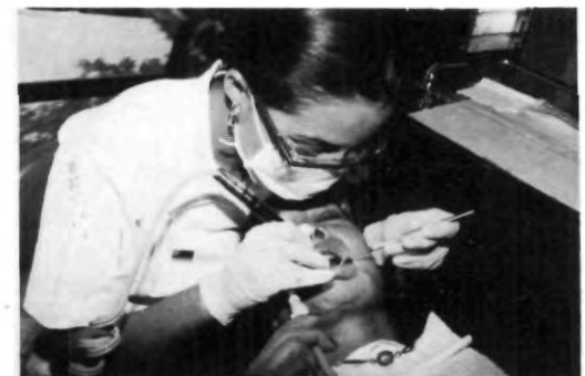
Atención profesional con aparatos de alta tecnología

Sólo dirígete a clínica central, donde te asignarán a algún alumno, pasante o titulado, de acuerdo a tus necesidades, contando para un mejor servicio con tres clínicas, área de diagnóstico, central de esterilización, rayos X, este servicio