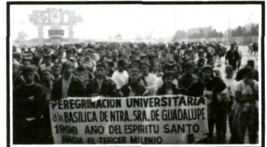
Se notó la presencia de la UPAEP en la Basílica

El día lunes comenzaba a mostrar los rayos del