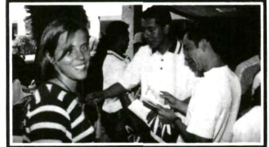
El ambiente en todos los eventos siempre ha sido excelente