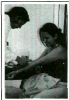
Las mujeres pusieron el ejemplo