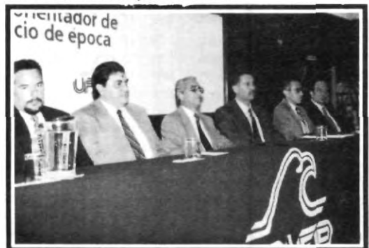
Momentos de la inauguración del Octavo Foro de Orientadores Vocacionales en la UPAEP

El Foro se tituló "Reflexiones para el orientador de inicio de época", en donde se recibieron importantes conceptos durante los días 5 y 6 de noviembre.