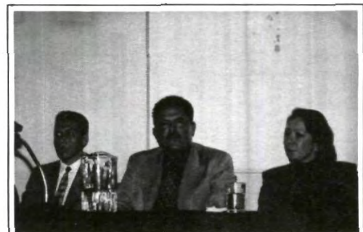
Interesantes proyectos presentó el candidato a la gubernatura de Puebla por el PVE