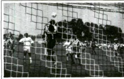
Valiosos tres puntos para UPAEP

En el segundo tiempo, cuando se esperaba que las Aguilas apretaran al rival, que ofreció mucho