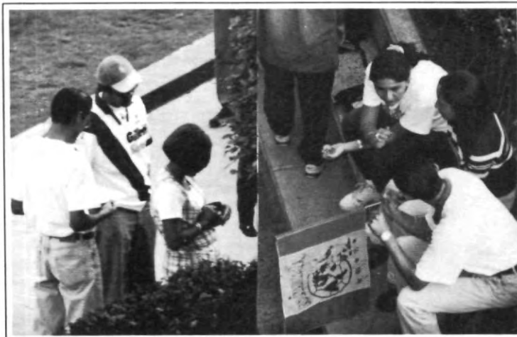
La euforia entre estudiantes por el Puebla -América