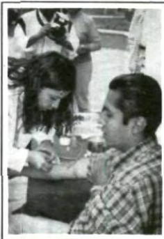
Tu donación puede salvar 4 vidas

segura por un año (en caso de necesitarlo se proporciona al donador inmediatamente sangre en cualquier parte del país), se salvan 4 vidas ( la unidad de sangre se fracciona en cuatro componentes básicos: glóbulos rojos, plasma, plaquetas y factores de la coagulación que pueden ser transfundidos por separada) y finalmente el donador obtiene un examen médico completo y un análisis de laboratorio completo.