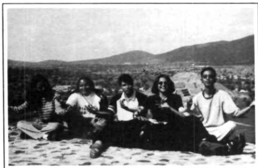
Los DECOS y una colada meditando