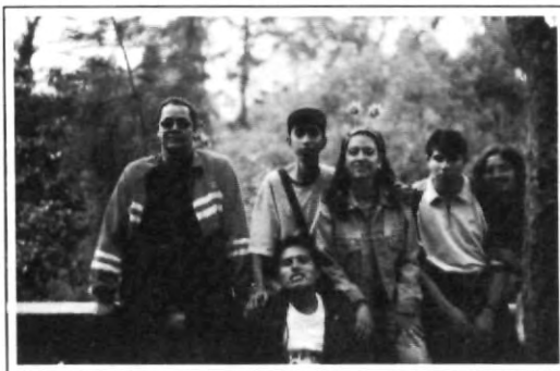
La colada con cuernos