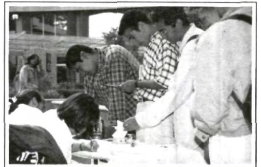
El objetivo: crear conciencia entre la juventud de la importancia de la donación altruista de sangre

Los requisitos para donar son: ayuno mínimo de 4