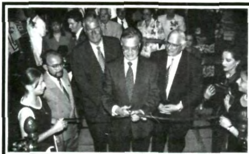
El Gobernador del Estado al cortar el listón inaugural