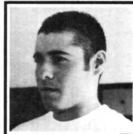
Mario Villanueva Arquitectura 8°

"La verdad es que no nos sirven de mucho, pues a veces nosotros contestamos por contestar".