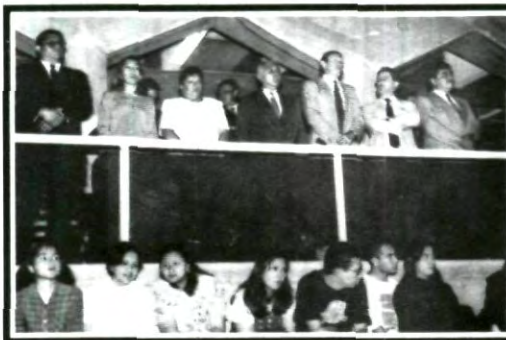
Nuestro Rector y Autoridades presentes en la inauguración de las Interprepas.