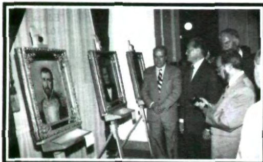
Las obras del Maestro Dávila fueron admiradas