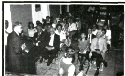
Diversas personalidades se dieron cita en el Museo