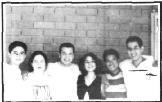
Los integrantes de la FEDEST, te invitan a participar en los festejos del 25 aniversario de la uni