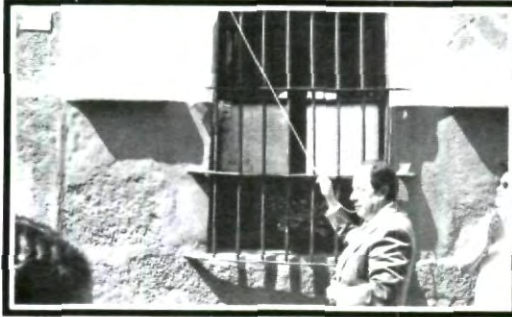
Momentos de la develación de la placa