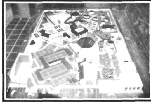
Aspectos de la maqueta del CIU

¿Cuándo se llevará a cabo la remodelación de la alberca? "la alberca se remodelará en época de invierno, porque poca gente ocupa las instalaciones por lo cual no representa una molestia para los usuarios; los