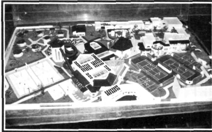
Imaginas... cómo quedaría así el CIU

Es muy importante aclarar que durante la remodelación, el CIU no va a cerrar sus puertas al público en general, porque el ingreso que tenga el CIU va a ser necesario para continuar las obras, por esta razón no se puede cerrar el Centro de Integración. En