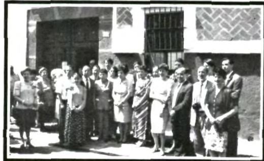
Familiares del Maestro Dávila Tagle

Estamos cerca de terminar.... la próxima semana habrá muchas sorpresas