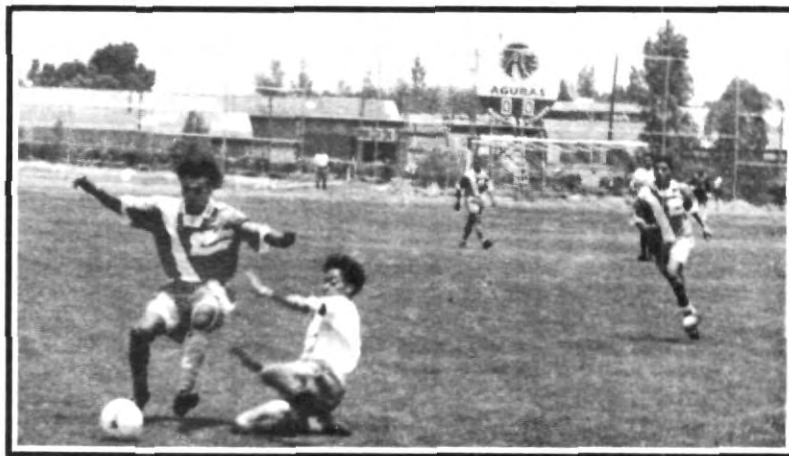
La UPAEP lleva 15 juegos invicto