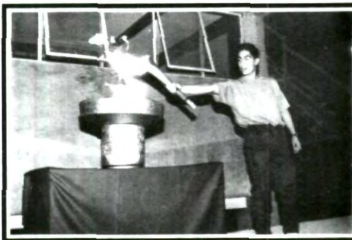
Momentos en que se enciende el fuego inaugural