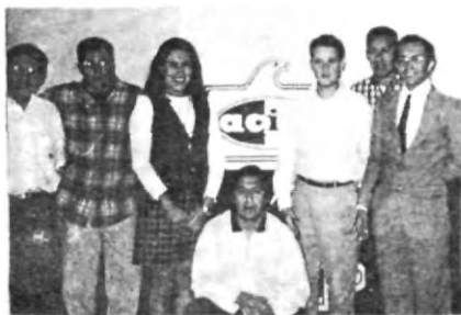
Miembros del Capítulo ACI/UPAEP