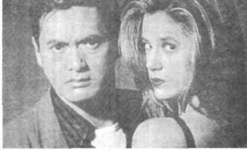
Chow Yun-Fat y Mira Sorvino.