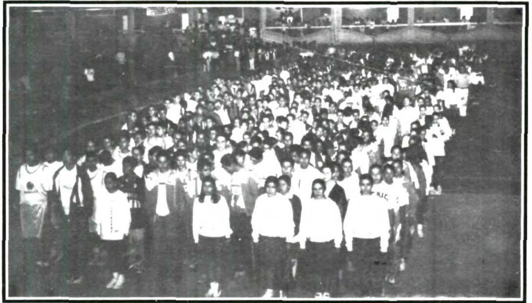
1500 estudiantes participarán en los diferentes deportes durante toda esta semana

El evento es en las disciplinas de fútbol, basquetbol, volibol, además de los concursos académicos en los que seguramente veremos encuentros de gran calidad de parte de los diferentes representativos de la ciudad.