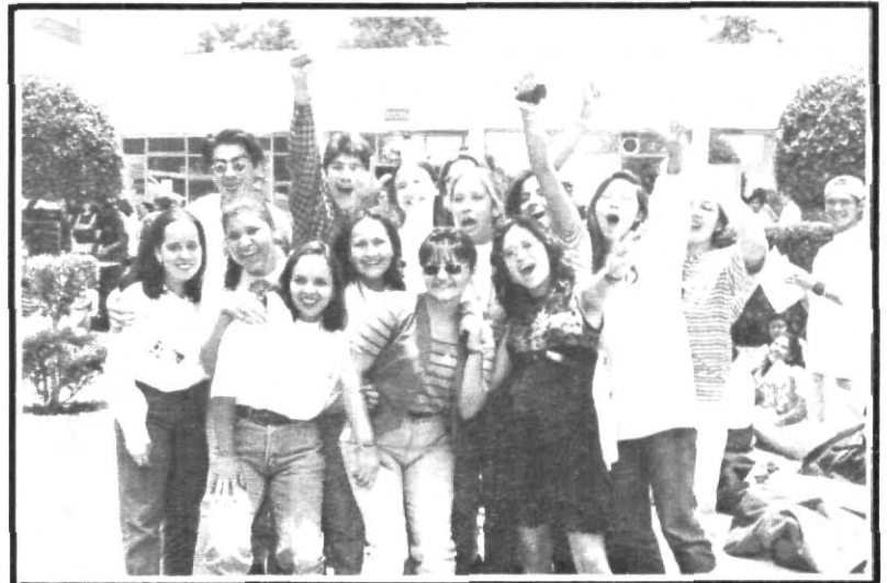
¡Que gran ambiente en la UPAEP!

Con una gran celebración culminó el curso pre universitario, donde los alumnos de nuevo ingreso conocieron las instalaciones de nuestra casa de estudios, además de charlar con otros estudiantes que ya integran nuestra comunidad por lo que pasaron un día de muchas sorpresas y alegrías.