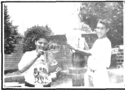
Las nuevas Aguilas muestran orgullosos los colores que ahora defenderán en las aulas.