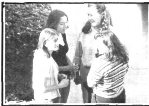
(Izquierda), Entre amigas comentan quiénes serán sus profesores. (Derecha), nuestro Rector da la bienvenida a los alumnos de nuevo ingreso.

De igual forma recibieron por parte del Rector la mas cordial bienvenida y posteriormente el grupo musical de Integración Universitaria tocó algunas melodías para animar a los muchachos, y ya entrados en ritmo hasta bailaron.