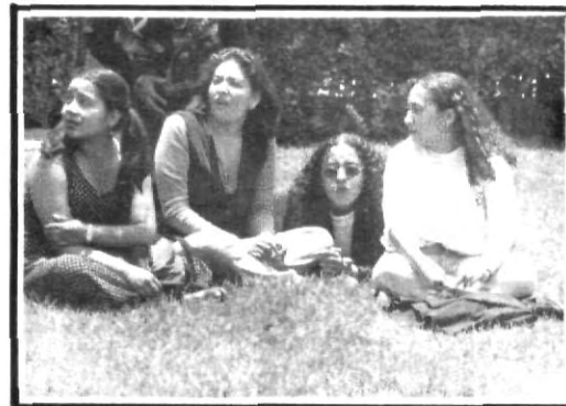
Tomando un poco de sol...