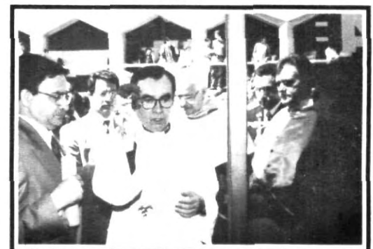
Bendición de las instalaciones del CAE.

Como parte de una mejor atención a la comunidad estudiantil, se ha creado una nueva forma de información académica conocida como CAE, la cual te ayudará a tener la información sobre tu carrera, currícula y datos principales.