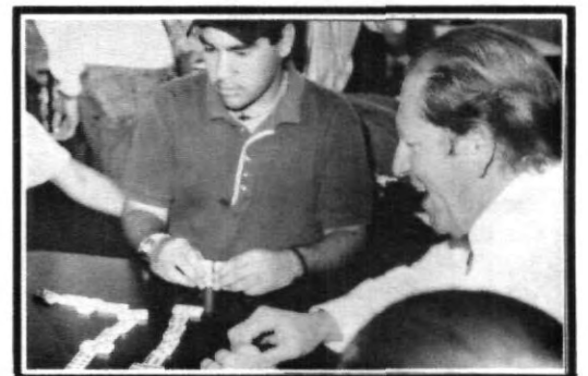
Ja, ja... les cerré el juego