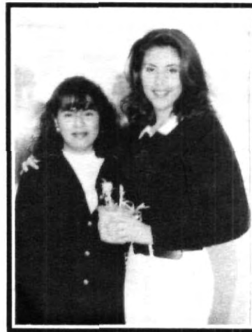
Cambio de regalo con pose...