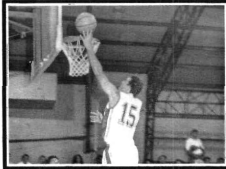
El clásico para las Águilas