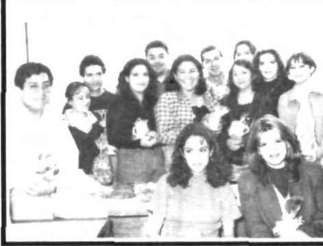
¡14 de Febrero! Como ya es costumbre, los amigos del Departamento de Comunicación e Imagen festejaron alegremente el día del amor y la amistad.