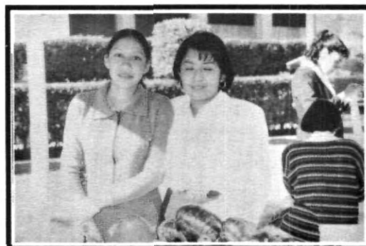
Entre venta y venta un sueñito