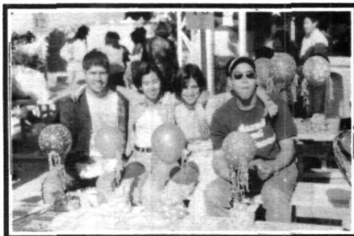
La venta estuvo mala...