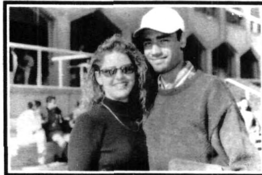
Posando para sus admiradores...