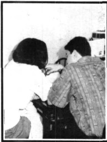
En secreto, el intercambio de regalo