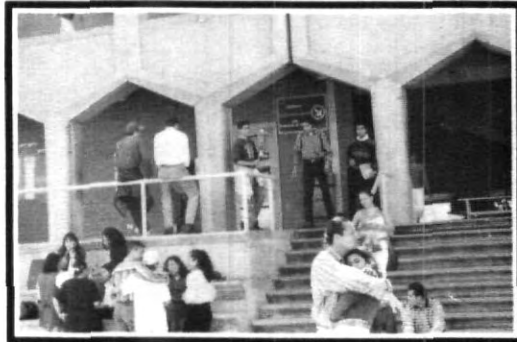
Abrazos de felicitación por todos lados...