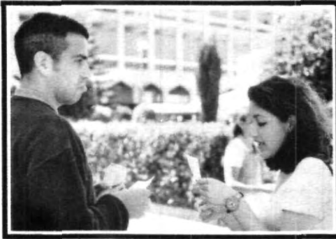
Intercambio de tarjetas con mensaje. ¿A quién no le gustó?