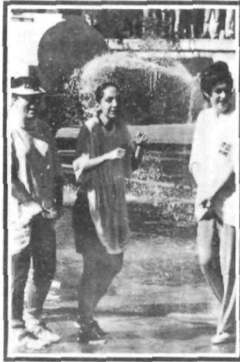
¡Quisiera ser un pez!