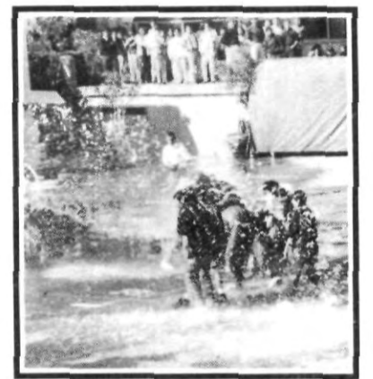
¡Cantando bajo la lluvia!