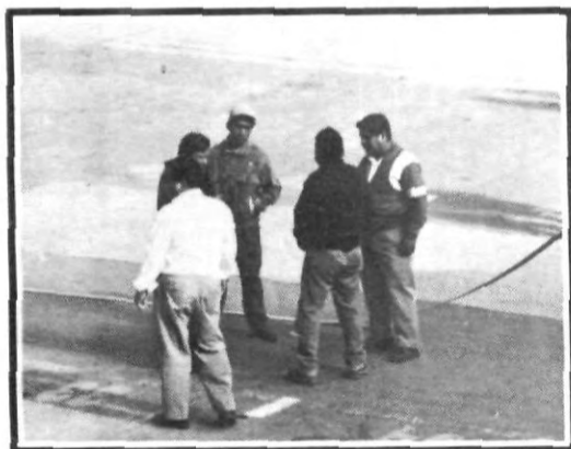
En tertulia para decidir a quién le darán la pipa