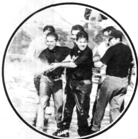
¡Serán bomberos o se equivocaron de carrera!