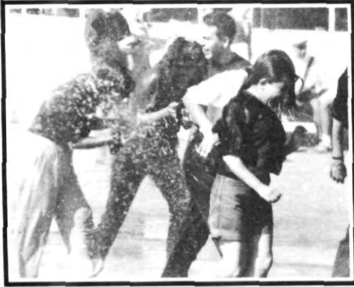
¡De la banda de los mojados!