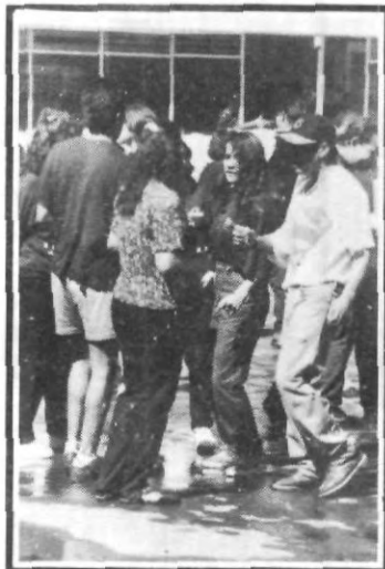
¡A la víbora, víbora de la mar, de la mar...!