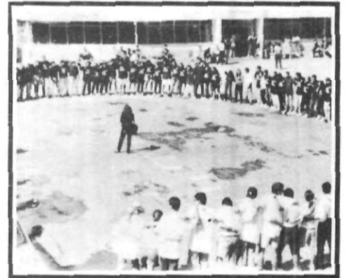
¡Doña blanca está cubierta...!