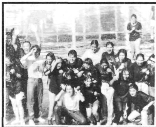
¡Los pachones se despiden!

Quien llegaba tarde no tenía disculpa y... al agua pachón, nadie quedó seco. Pero al estar todos ahí, juntos, no cabe