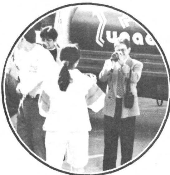
Los primeros en llegar, y las primeras fotos