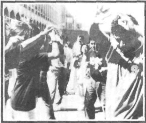
¡A mí que me registren!