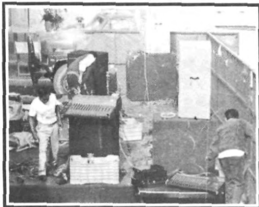
¿Cómo se tocará esto?