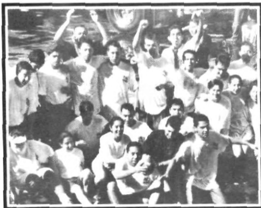
Las porras de Ingeniería Industrial con entusiasmo