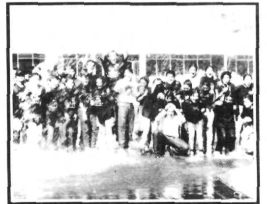
¡Se preparan para la foto... no, es la Ola!