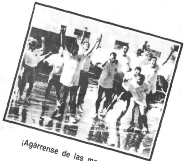
¡Agárrense de las manos...!