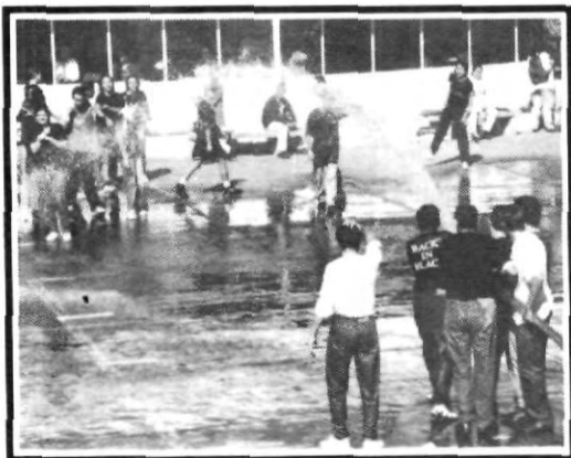
¡a mojar se ha dicho!