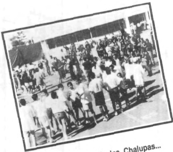
En busca de las Chalupas...