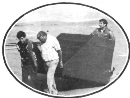
Comienzan los preparativos...