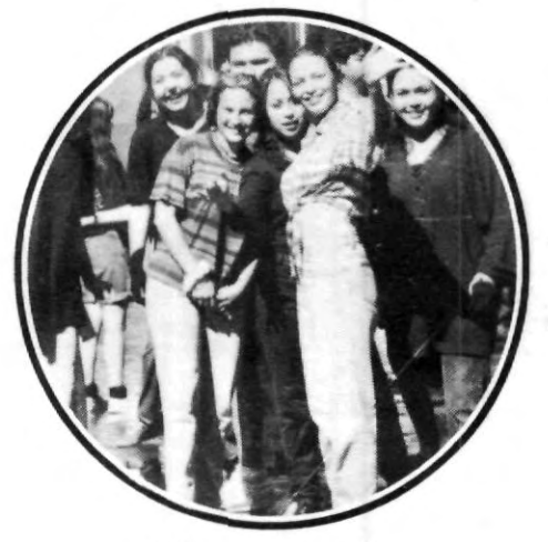
¡Adiós a nuestra Uni!