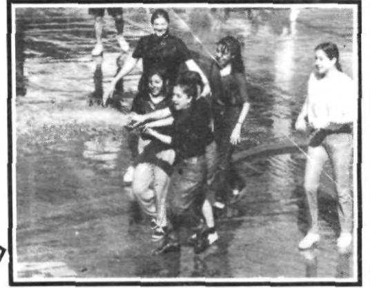
¡Que vengan los bomberos...!