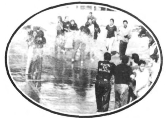
¡Secuencia de una mojada anunciada!