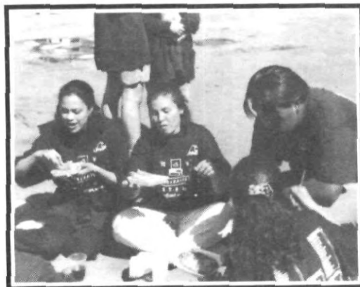
Después de la mojada... ...las chalupas