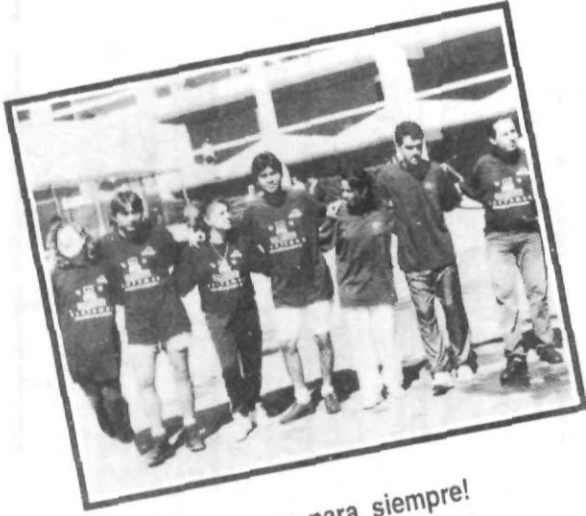
¡Amigos para siempre!