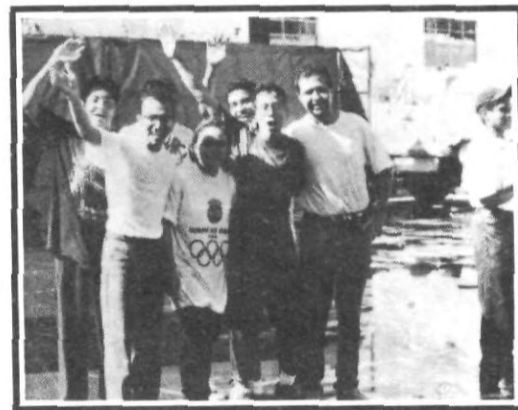
Los politólogos en la escena de los hechos