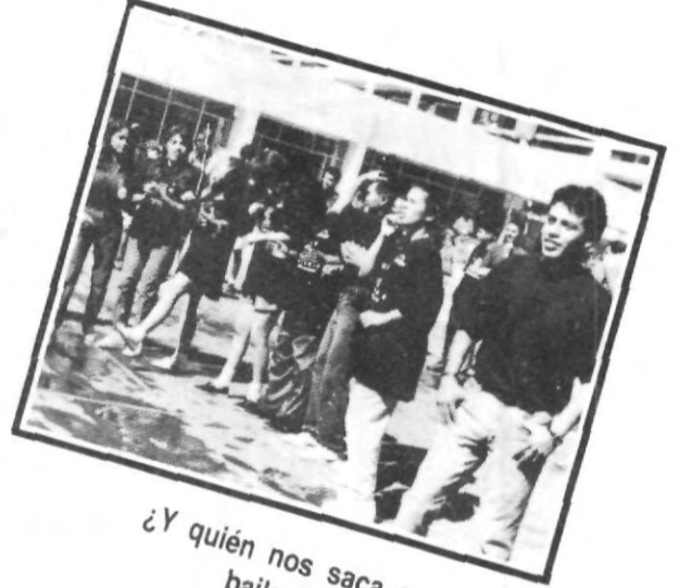
¿Y quién nos saca a bailar?