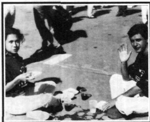
¡A recuperar calorías!

Finalmente no podía faltar la hora de la chalupa o "a recuperar calorías" que es lo mismo, y fue entonces que la música disco siguió, algunos en medio patio con chalupa en mano seguían haciendo gala de sus mejores pasos, otros entre mordida y mordida a las fritangas, comentaban lo bien que estuvo el festejo.