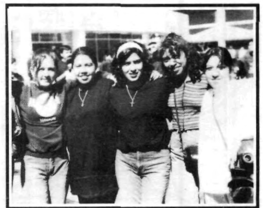
La foto que siempre recordarán