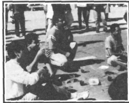
La última chalupa... ...y nos vamos

No es un adiós, sino un hasta pronto; y recuerden... ¡Este es su Nido, Aguilas!