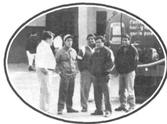
A ese de la cámara lo voy a mojar...