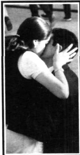
Este estilo se llama Pio, Pio...