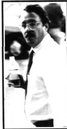
¿Será sed ...?