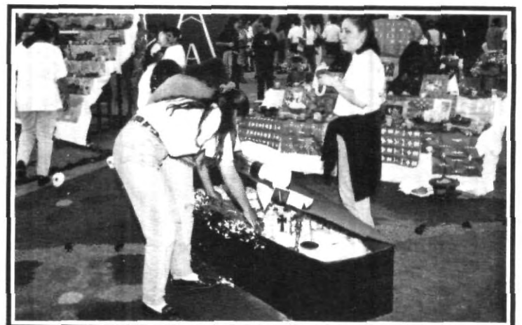
Los cirios representan la luz que ilumina el camino a los fieles difuntos.