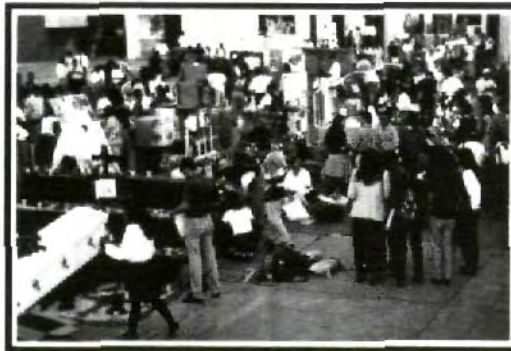
Gran ambiente en este tradicional evento que rescata nuestras raíces.