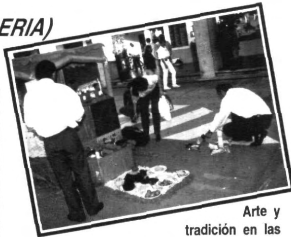
Arte y tradición en las ofrendas colocadas en la UPAEP.

Algunas de las ofrendas son colocadas de acuerdo con las características propias de la región.