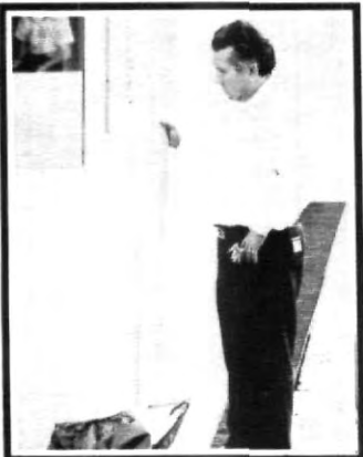
¡Hip, Hip; me equivoqué de casa!