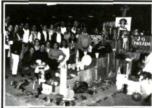
Diseño y Producción Publicitaria consiguió el primer lugar.

Hubo también dos menciones, para Economía quien dedicó su ofrenda a José Guadalupe Posadas y "A través del tiempo" de Ingeniería Química.