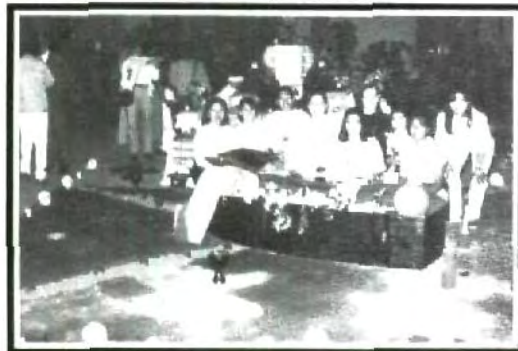
Pedagogía se quedó con el tercer puesto.