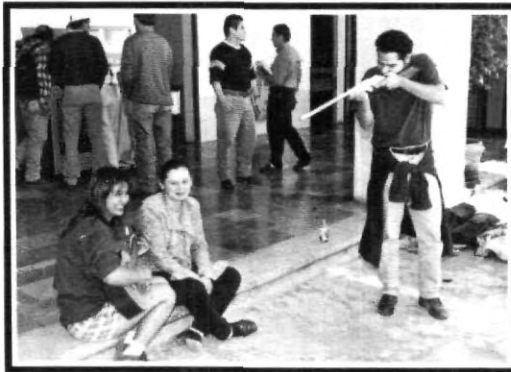
¡Se casan o los... cazo!

Aquí podrás encontrarte todos los miércoles durante este semestre. Ten cuidado porque la cámara de "Pepe" puede estar atrás de tí.