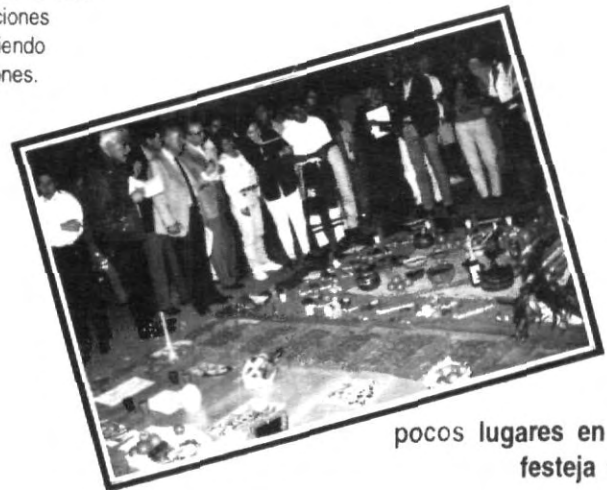
En México es de los pocos lugares en los que se festeja a la muerte.

Ya no hay quien componga los discursos del Rector ni quien con alguien discuta quien es el mejor pensador.