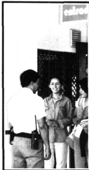
¡ALTO! credencial... no entran.