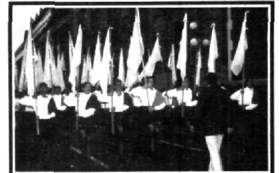
El desfile, un gran espectáculo.

personas, de las familia y de la sociedad, porque es precisamente en la dimensión social en donde el valor de