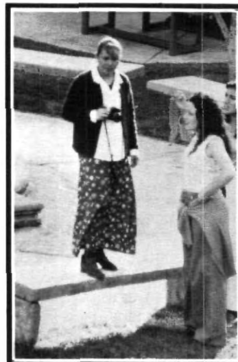
Brinca la banquita, yo ya la brinque...