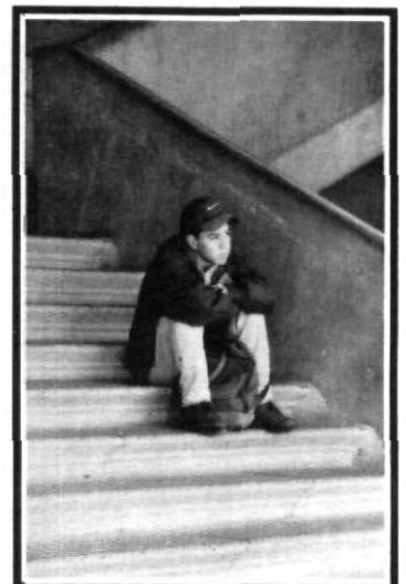
¿Dónde están mis amigos?