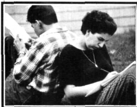
Amistad, amor y espalda con espalda.