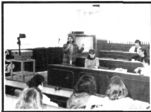
Alumnas de Administración en conferencia.