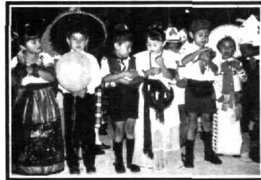
Los niños unen a América.

El Segundo Festival de las Américas se realizó con gran éxito donde se contó con la participación y apoyo de 38 organismos que se unieron para promover nuestros valores en la fiesta de la hispanidad que año con año la UPAEP y otras instancias organizan y se espera que el próximo evento se tenga aún mayor apoyo.