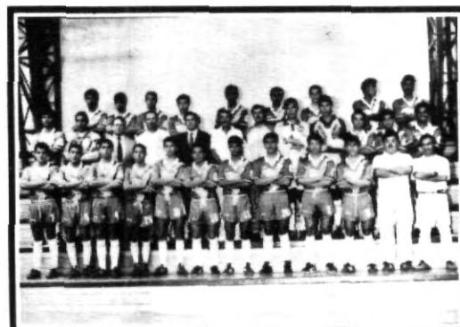
A la UPAEP le ha tocado un grupo difícil, pues enfrentará a los ITESM de Guadalajara, EDOMEX y Querétaro.

Pero no sólo ellos andan mal; qué pasa con la afición, dónde están y también ¿para cuándo?. Una cosa es segura y no es justificación, las Aguilas están en un lugar donde se les ha recibido bien, pero la gente de Puebla, ¿para cuándo en el Tlahuicole, para cuándo?.