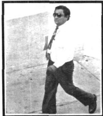
¡Se me hizo tarde!