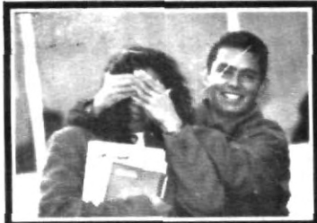
¿Eres tú Carlos?