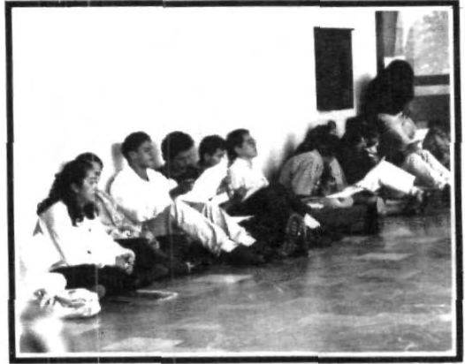
Castigados por guerrosos