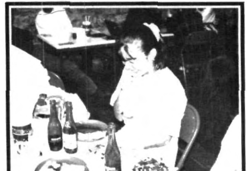
Así disfrutan el refresco los estudiantes de Medicina

Un abrazo significa: Amistad, cariño y amor de verdad