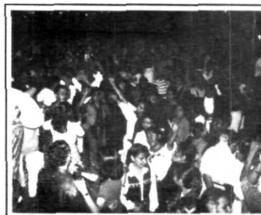
¡Como no!, todos muy mexicanos