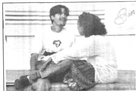
Canto al pie de tu ventana...