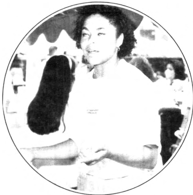
¡Miradas que matan!

Aquí podrás encontrarte todos los miércoles durante este semestre. Ten cuidado porque la cámara de "Pepe" puede estar atrás de tí.