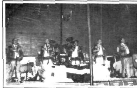
¡Ellos sí saben cómo hacerlo!

nocido ambiente de alegría y participación de todos los asistentes.