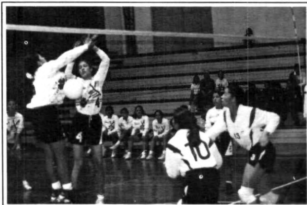
UPAEP en sus categorías juveniles sigue en buen nivel

cual nuestra casa de estudios se coloca como uno de los favoritos en la zona centro. Los marcadores fueron, en varonil 15-4 y 15-5; femenil, 15-5 y 15-7.