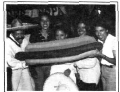
Después de tanto bailar hasta dio hambre.