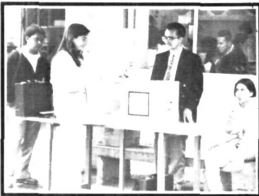
Espacio universitario, es de todos

Hemos visto una realidad que mucha gente no sabía y que se distorsionó por completo dando una versión según la conveniencia de cada quien.