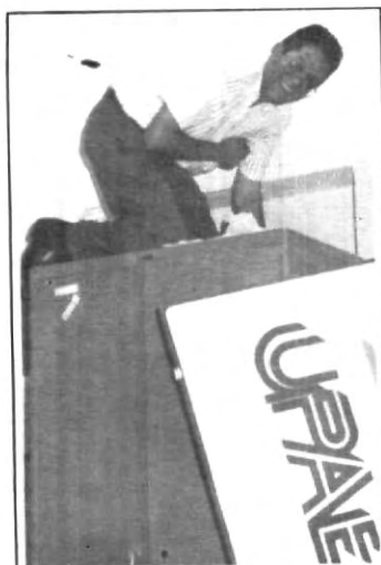
¿Aquí será buen escondite?