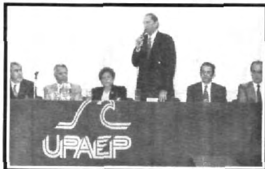
Signaron convenio en la UPAEP.

Durante la firma de este convenio estuvieron presentes por parte del Se-