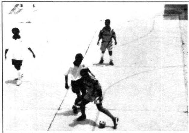
La UPAEP después de ir ganando 4-1, fue alcanzada por la UNITEC.