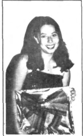
si Adelita se fuera...