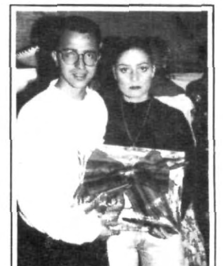
"El torito y la Chorreada"