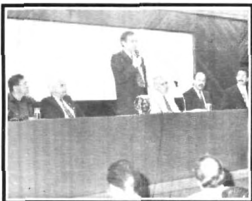
El A.C.I. reconoció labor de la UPAEP.

En cuanto a la exportación refinó que ésta no significa mucho para la industria de la construcción, ya que hay muy pocos artículos que se pueden exportar puesto que su principal problema es el peso y éste no los hace muy atractivos al extranjero, lo que si se ha exportado es el cemento y los aditivos.