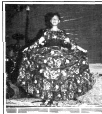
Con gran garbo lució el mejor traje típico