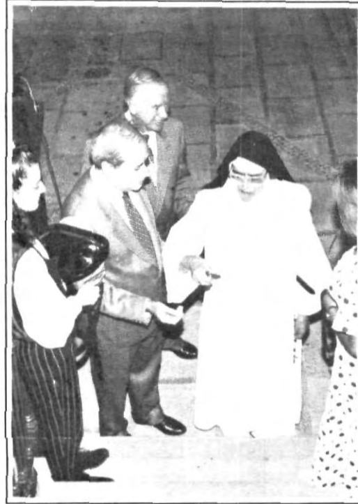
Excelente espacio cultural en la UPAEP