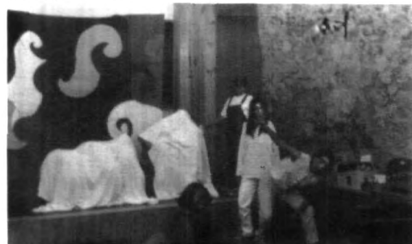
La empresa juvenil "Pa' todos", con su presentación "Colores vivos" en el Foro Regional DESEM

Dicho evento se realizará en la Hacienda de Cocoyoc, el próximo mes de junio, en donde asistirán participantes de Estados Unidos, Chile, Paraguay, entre otros.