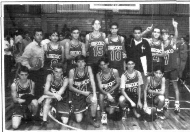
Como resultado del gran nivel deportivo, grandes campeones.

En la rama femenil, el Colegio Benavente quedó como campeón segundo por la UPAEP y en tercer lugar el ya mencionado Instituto México, éste último fue el representante -en todos los deportes-