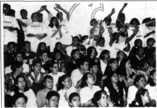
El nivel deportivo a su mayor capacidad.

En el futbolito desde el primer sitio hasta el tercer lugar se quedaron en la UPAEP que arrasó con esa disciplina y siendo el título para UPAEP "C", segundo UPAEP "B" y el bronce para UPAEP "A", la triple corona.