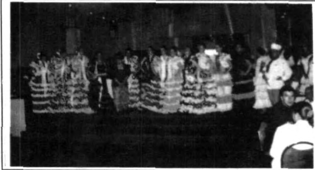
Se presentó el Ballet Folklorico del Parque España.

Finalmente, brindamos una calurosa felicitación a todas las estudiantes de Administración de Instituciones que participaron en la comida.