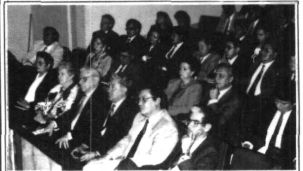
Gran participación de los estudiantes de Derecho en su Simposio.