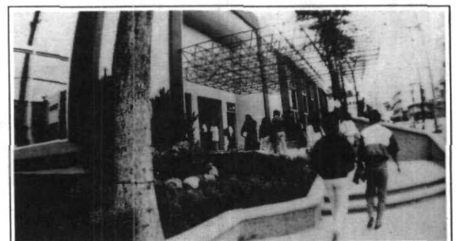
La UPAEP, este 7 de mayo cumple 23 años de fundada.

importantes del país, no sólo por sus edificios, sino por los hombres que en ella conviven diariamente, autoridades, maestros, alumnos, funcionarios, empleados y padres de familia que conforman esta comunidad que sin lugar a dudas, continuará con este crecimiento enalteciendo en el campo educativo, cultural, deportivo y social a nuestro estado.