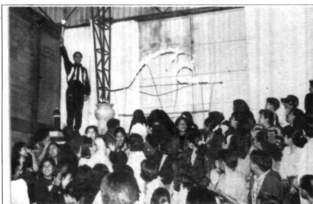
Desde la inauguración hasta la clausura existió un ambiente de alegría en la UPAEP.