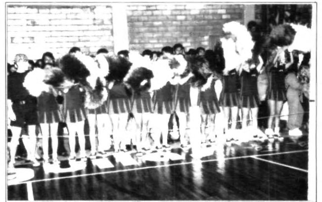
Hubo de todo en el interprepas, porras, gritos y buen juego entre los preparatorianos.