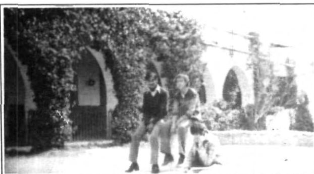
El primer inmueble de la UPAEP, hace 23 años.