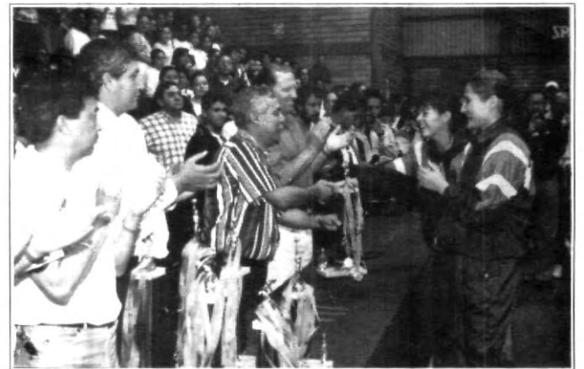
Los diferentes campeones recibieron con felicidad su premio, mientras que los demás participantes deberán mejorar el próximo año.

Se dio una muestra de que cuando existe buena preparación por parte de los equipos, sí se puede obtener excelentes resultados y ahora esperar para la edición XIV en 1997.