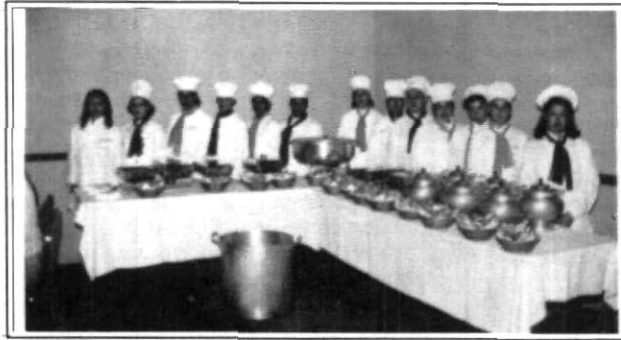
Exquisitos platillos de comida española presentaron las alumnas del 4o semestre de Administración de Instituciones durante la 5a. Muestra Gastronómica

Autoridades universitarias de esta casa de estudios fungieron como jurado para degustar cada uno de los platillos elaborados por las estudiantes