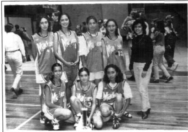
Gran ambiente se vivió en el Interprepas.

En tercer lugar quedó la UPAEP Atlixco luego