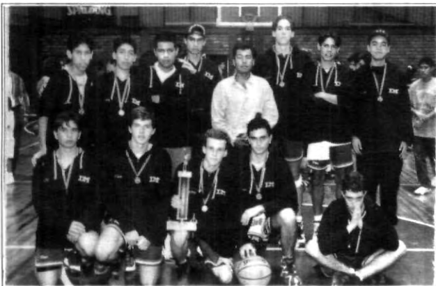
Luego de demostrar su gran capacidad reciben el título de campeones en el Interprepas.

Sin duda alguna los Interprepas de este año fueron sensacionales, se mostró la capacidad enorme de la UPAEP, Benavente y del Instituto México así como del Instituto Mexicano Madero quienes resultaron los máximos ganadores del evento; y lo mejor, fue una gran fiesta