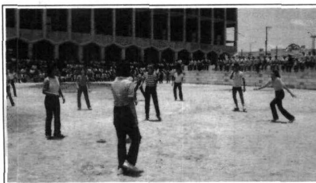
El edificio A al fondo, todavía no existía el gimnasio.