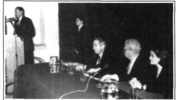
Momentos en que el rector de la UPAEP, inauguró el Simposio de de la Facultad de Derecho " México, Epoca de Transición".