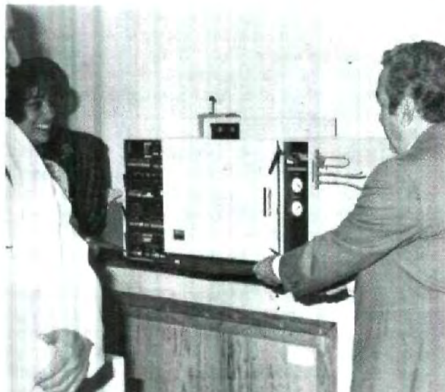
Mayor tecnología en la Universidad

EL UNIVERSITARIO te invita a cuidar las instalaciones de nuestra Universidad, recuerda que son de todos, entre más limpias estén, mejor será nuestro aprovechamiento.