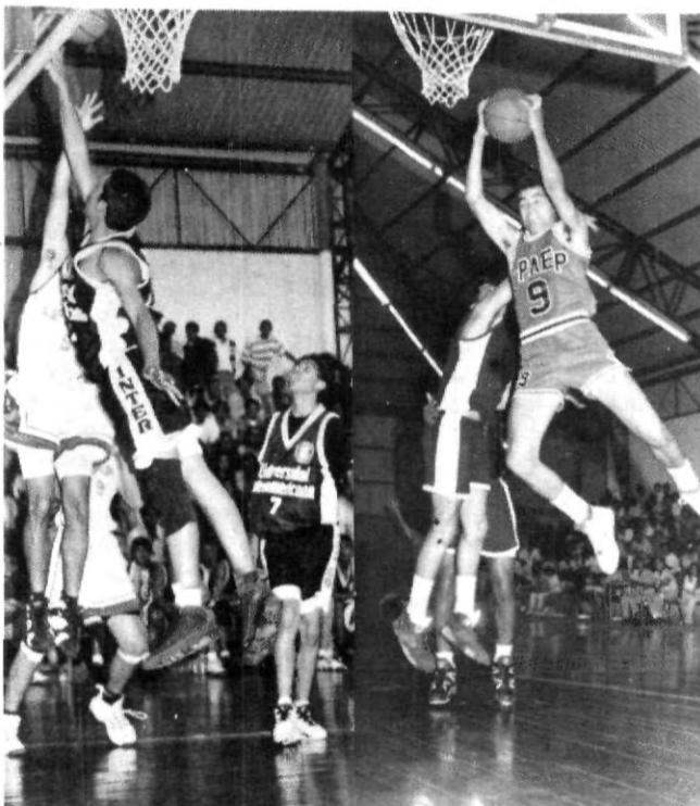
Se perdió el buen juego en las finales