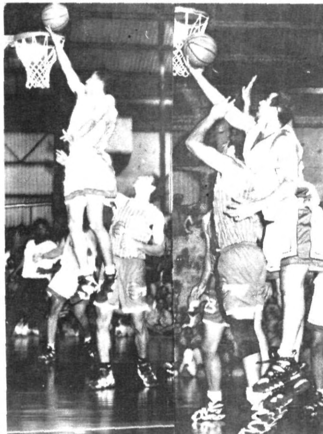
Durante todo el partido pudimos observar el buen juego ofensivo de las Aguilas que se impusieron a los Poblanos.

periodo, los locales arremetieron en sus ofensivas y lograron establecer sus condiciones para finalmente controlar el juego y con el triunfo consiguieron subir al liderato de la zona centro en la LINABE.