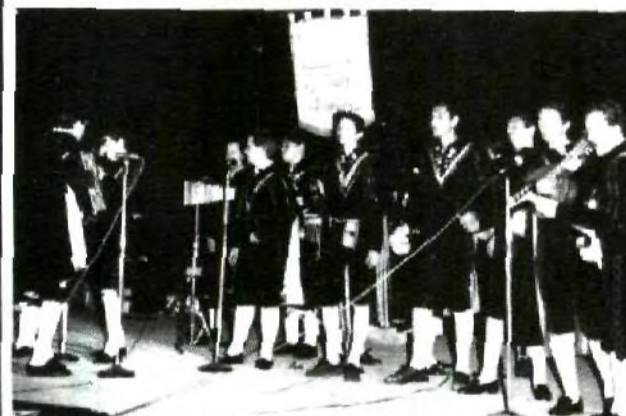
Diversos grupos artísticos participaron en el Primer Festival de las Américas, realizado en el zócalo de la Angelópolis.

Finalmente, hubo fuegos pirotécnicos y sonaron las campanas de la Catedral.