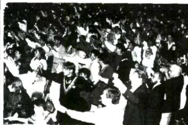
Gran número de personas presenciaron el Festival de las Américas.