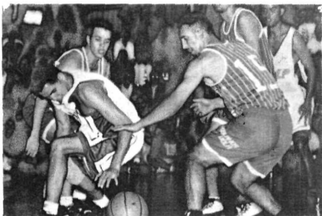
En el primer periodo los Aguiluchos pusieron a temblar a la afición, pues no acrecentaban la ventaja.

americana, la U. de Guajalajara, entre otras. Durante el primer lapso los Aguiluchos no pudieron controlar el partido a tal grado de que las volteretas en el marcador eran constantes; sin embargo, para el segundo