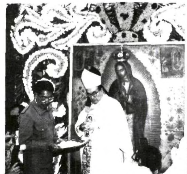
Momentos en que el Arzobispo de Puebla, Rosendo Huesca y Pacheco realiza la coronación de la Virgen de Guadalupe y celebra la culminación del Año Jubilar Guadalupeño.