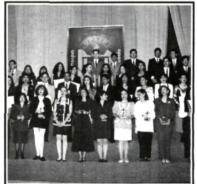
Seiscientos setenta y siete alumnos galardonados con los Premios Académicos Cruz Forjada y Mérito al Estudio.

Hace ya 10 años el pueblo mexicano, agregó, tras un devastador terremoto, demostró su grandeza en un acto concreto de solidaridad. Los mexi-