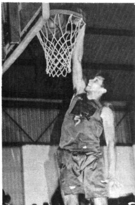
Espectaculares jugadas en el Nido.