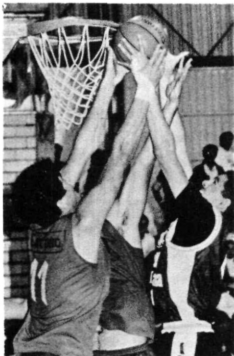
Difícil encuentro ante la Inter.

tos; sin embargo las Aguilas pusieron un alto y vencieron por 57 contra 45.