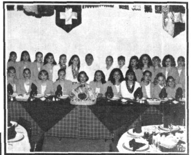
Alumnas del quinto semestre de Administración de Instituciones que participaron en la IV Comida de la Excelencia.