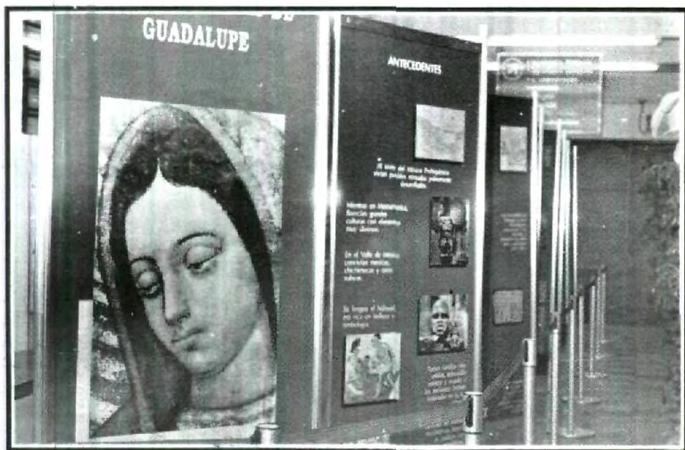
Visita la Exposición Gráfica de Nuestra Señora de Guadalupe en la Historia de México, ubicada en el pasillo sur de acceso a la universidad. No te la pierdas, ¡No te arrepentirás!

La procuraduría General de la República en Puebla, ha puesto en marcha comités para salvaguardar la seguridad de la sociedad en carreteras tanto estatales como federales, vinculándose operativos de manera conjunta con las autoridades de la entidad, como la Policía Federal de Caminos, Seguridad Pública y la Procuraduría General de Justicia del Estado para reducir los índices delictivos que se registran en la Angelópolis.