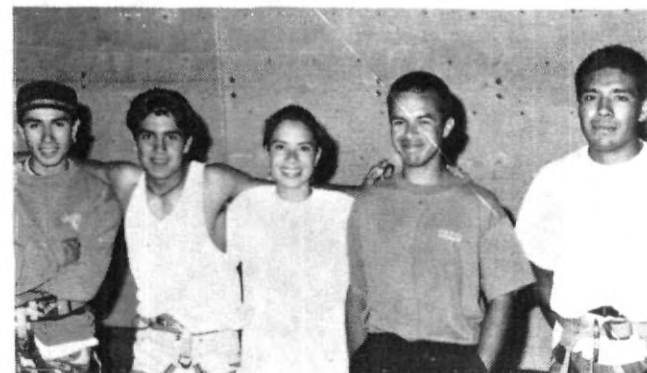
Exitosa participación de la Agrupación de Montaña de la UPAEP en Zacatecas. (Entrenamientos lunes o viernes 19:00 hrs).