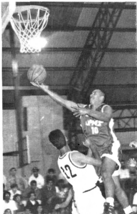
Buen inicio en la LINABE