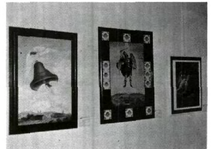
En el Museo UPAEP, puedes admirar la exposición de cuadros y esculturas, "Los Angeles en el Arte", que permanecerá abierta al público hasta el 30 de septiembre.

están muy relacionados desde la conquista de México hasta la actualidad con el desarrollo de nuestro estado y con los lugares donde se establecieron.