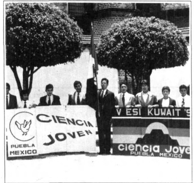
Alumnos de bachillerato y licenciatura de la UPAEP, estuvieron presentes en el evento de "Ciencia Joven en Kuwait".

Hace ya un par de siglos se creía que algunos organismos surgían de la nada. A esta teoría se le conoció como la "Teoría de la Generación Espontánea". Aunque hoy en día nos hacen gracia sus fundamentos, es curiosa la forma similar en que vemos a nuestros científicos como una obra de la casualidad, como un accidente que no es posible predecir o reproducir. Lo único que necesitamos son