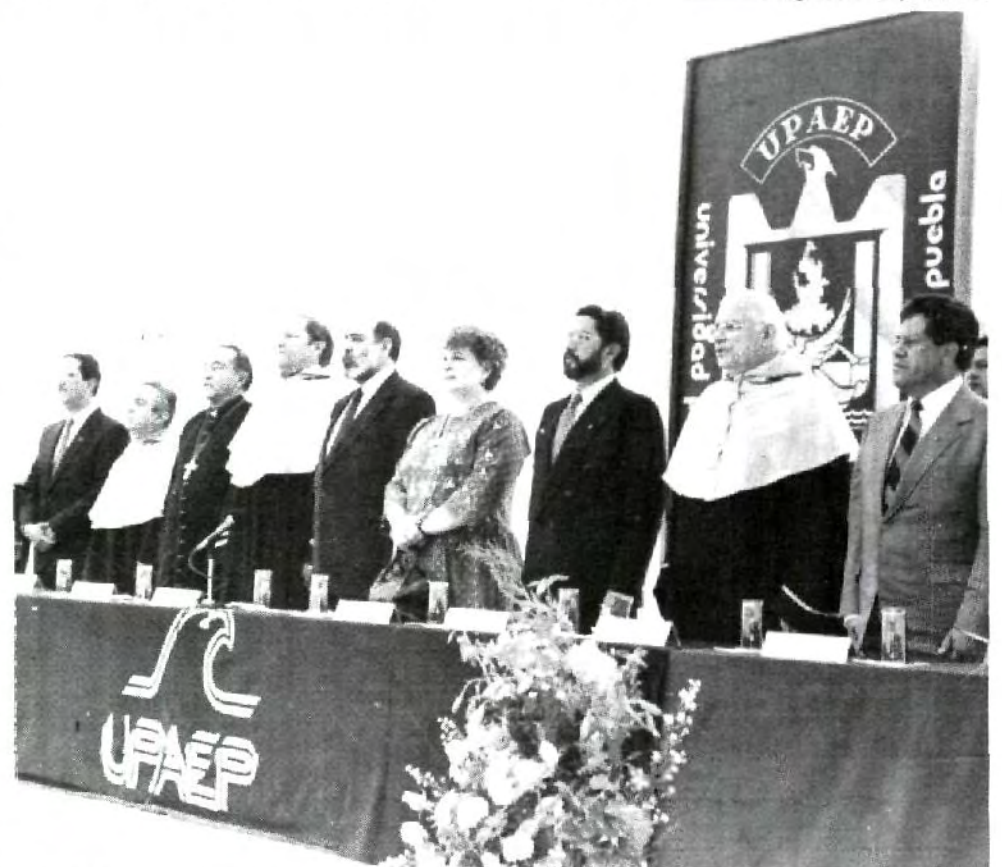
Autoridades gubernamentales del Estado de Tlaxcala y Miembros de los Patronatos Fundadores de la UPAEP, estuvieron presentes en la inauguración del Centro Universitario UPAEP, Campus Tlaxcala.