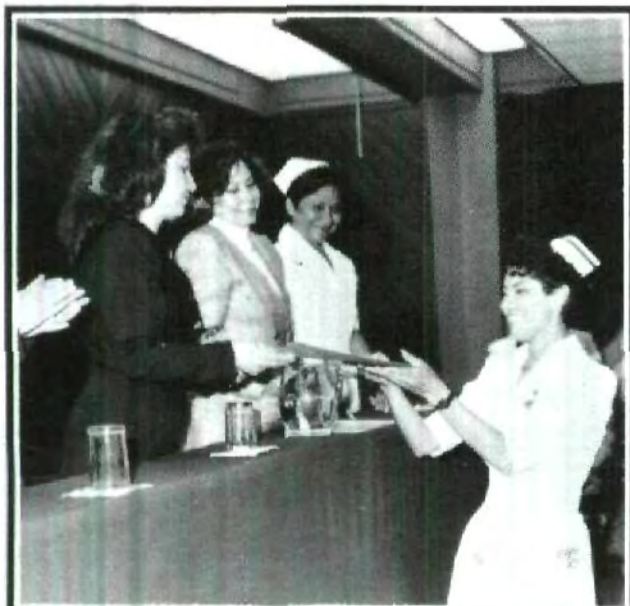
Estudiantes de la Escuela de Enfermería de la UPAEP, finalizaron sus cursos en el área de administración y docencia. Autoridades de esta disciplina profesional, entregan diplomas de reconocimiento.