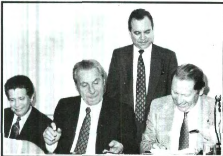
Directivos de la Compañía General Electric, Sistemas Médicos y autoridades de la UPAEP, durante la firma del convenio, para la adquisición de un equipo de Imagenología para el Hospital de esta casa de estudios.