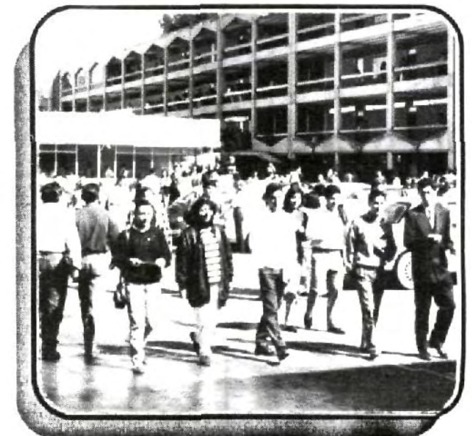
Este miércoles se llevará a cabo la tradicional bienvenida a los alumnos de nuevo ingreso.