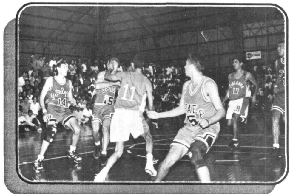
Prepárate para los encuentros que sostendrán las Aguilas en busca del título de la LINABE.