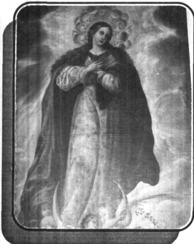
La Virgen de la Inmaculada Concepción se encuentra expuesta en el Museo UPAEP, durante el mes de agosto.

En esta ocasión el Museo UPAEP, se viste de gala al contar con la exposición de Imágenes Religiosas de la Inmaculada Concepción, así como la realización del ciclo de conferencias que como todos los jueves a partir de las 20:00 horas se lleva cabo.