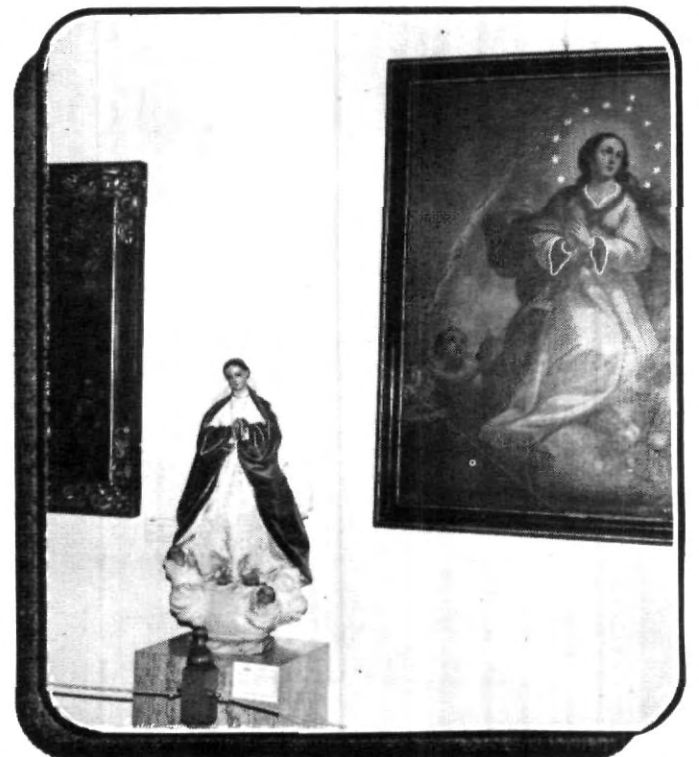
En el museo UPAEP, puedes apreciar más de 50 obras referentes a la Virgen de la Inmaculada Concepción, las cuales fueron prestadas por distinguidas familias poblanas y por el Museo Bello.

La difusión de la cultura entre los universitarios es una de las prioridades de esta casa de estudios, aprovecha, todas las ventajas que te ofrece la UPAEP, visitando, el Centro de Integración Universitaria (CIU), que se encuentra en el Barrio Jesús en Cholula, su museo, la biblioteca y cada uno de los lugares que te brinda el formar parte de la familia UPAEP.