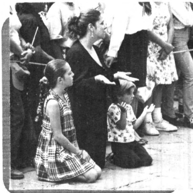
Devoción, Fe y Esperanza, fue el sello de todos los que participaron en ésta Procesión.

Por ello, debe existir ante todo, el compromiso de respetar a todas las mujeres y ver en todas y cada una de ellas, una semejanza con nuestra Señora e inició a rezar acompañado de los fieles un Dios te Salve por las mujeres mexicanas.