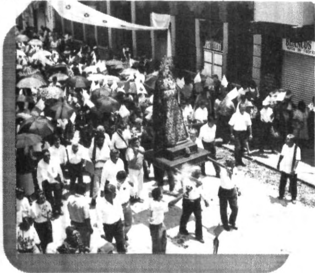
La Virgen de los Dolores de la Iglesia del Carmen, en su caminar por las calles de nuestra Angelópolis.