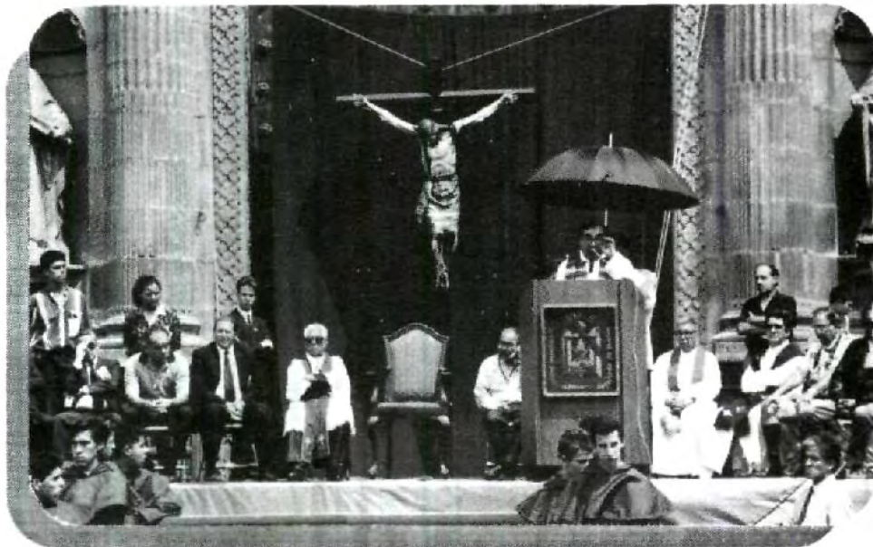
Por cuarto año consecutivo la Procesión de Viernes Santo en Puebla.