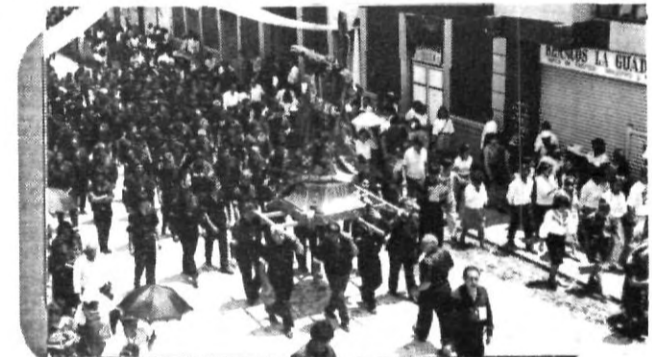
Silencio y meditación, al paso de Jesús Nazareno.