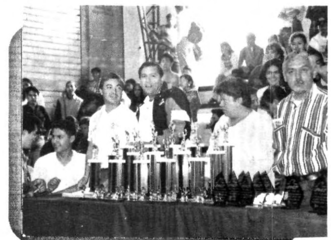
Los organizadores antes de la premiación.