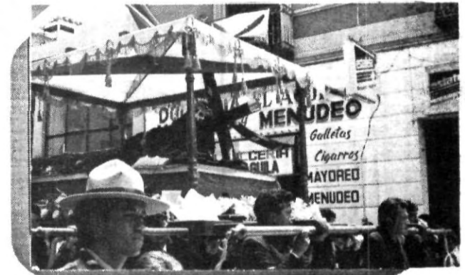
137 Años pasaron para que el Señor de las Maravillas, regresara a las calles de Puebla.