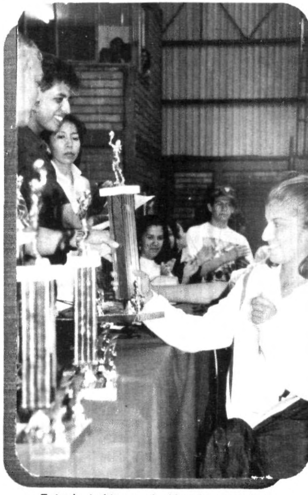
¡ Entusiasta ! la premiación a los ganadores.