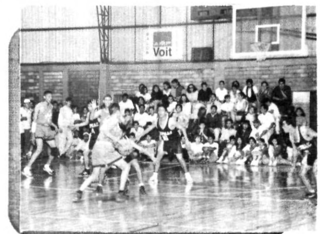
Emociones que pusieron al filo de la butaca a los aficionados.