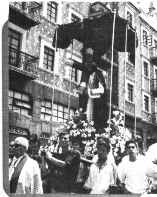
Nuestro Padre Jesús de Analco, nos recuerda el Calvario que vivió por nosotros.