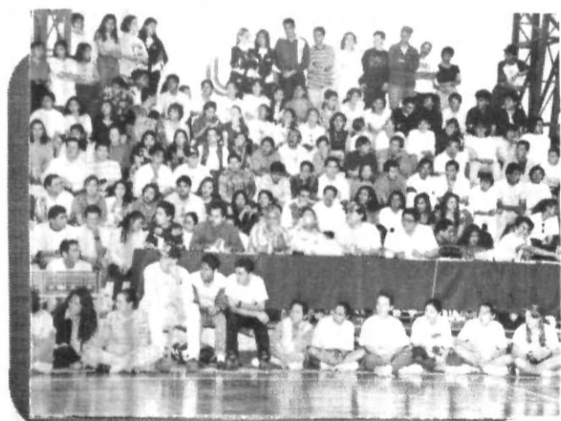
Lleno hasta los topes las finales de los interpepas.