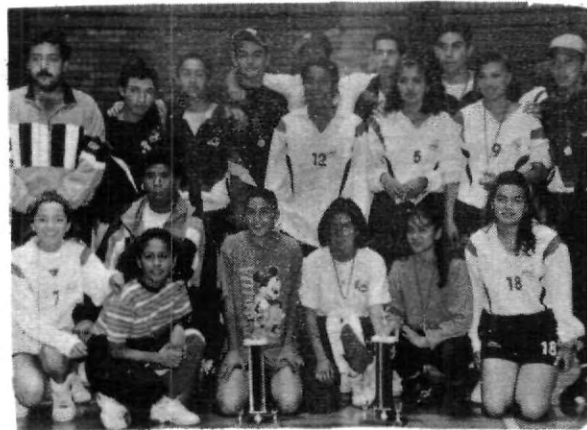
Grande fue el ambiente en los Interprepas.

En la rama femenil, las ganadoras fueron las