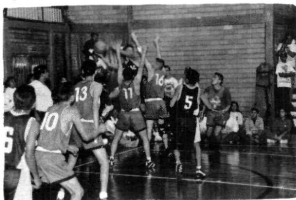
El espíritu de lucha perduró en todo el torneo

chicas del Instituto México; por otra parte en voleibol, los campeones fueron los jóvenes de la UPAEP A, el segundo sitio lo obtuvo el Colegio Benavente y el tercer pendaño fue para el CENHCH. En los femeniles también UPAEP A conquistó el título al vencer al Instituto México.