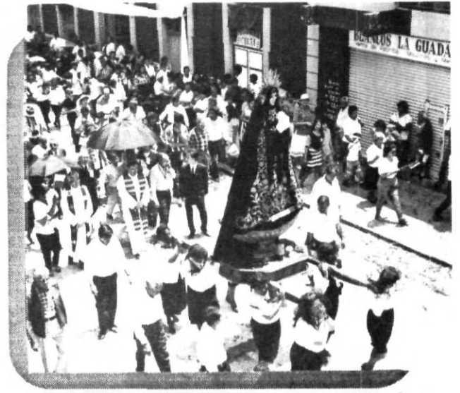
Ejemplo de fortaleza, mujeres cargan a nuestra Señora de la Soledad.