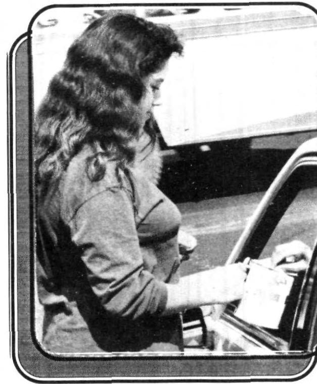
De manera solidaria colaboraron estudiantes de las diferentes escuelas y bachilleratos de la UPAEP, en la Colecta de la Cruz Roja.