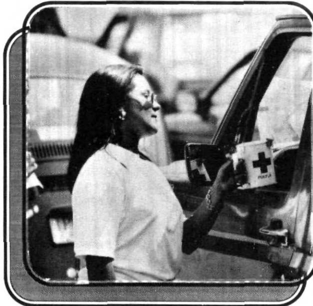
Buena respuesta por parte de la ciudadanía en la Colecta Nacional de la Cruz Roja, donde participaron estudiantes de la UPAEP

Por último apuntó que ahora más que nunca se debe ayudar a una institución como la Cruz Roja toda vez que para que esta ofrezca un servicio de calidad y eficiente debe contar con los recursos económicos y medios necesarios para su movilización, además de ser una responsabilidad de la institución que dentro de su ideario la solidaridad y participación social son elementos que deben ser ejercidos en la práctica.