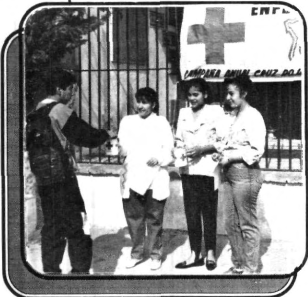
La escuela de Enfermería presente en la Colecta de la Cruz Roja.