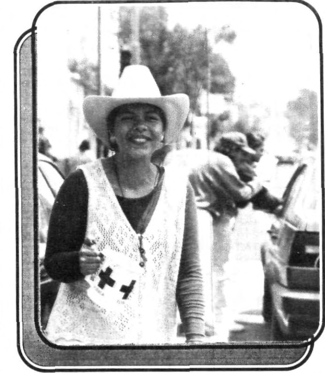
Entusiasmo mostraron las alumnas que participaron en la Colecta.