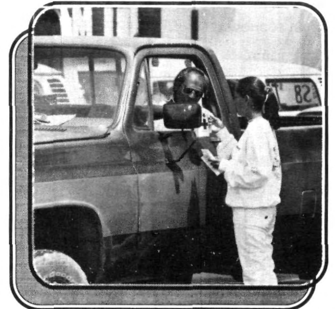
En acción, solidariamente en la Colecta de la Cruz Roja alumnos de esta casa de estudios.