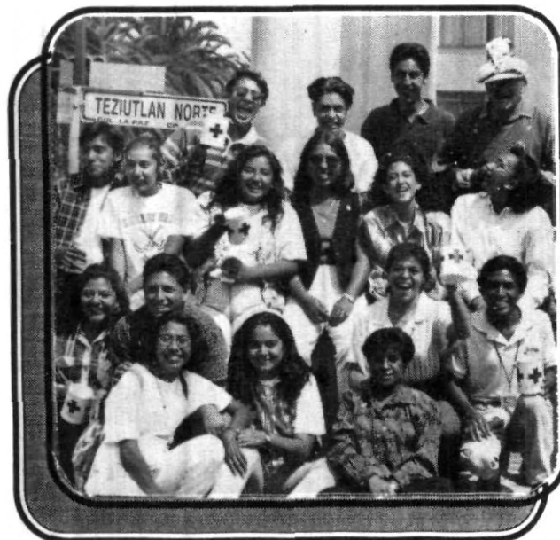
Grupo de estudiantes listos para la jornada de trabajo en beneficio de la Cruz Roja.