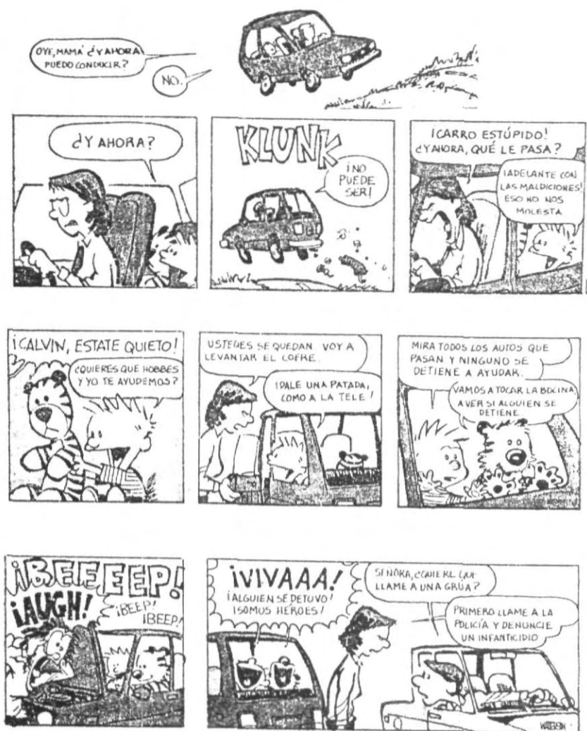
Recopilado por: Juan Carlos Lezama. Centro de Tecnología Educativa.