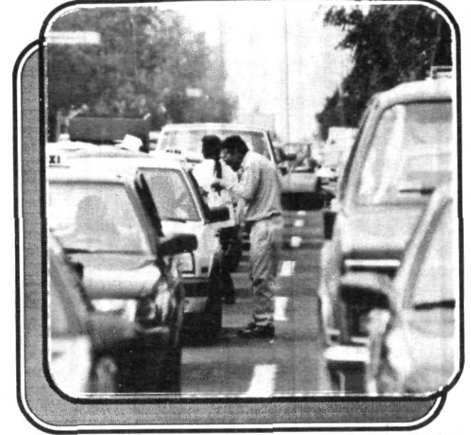
Toreando a los automóviles y en plena faena, colaborando con la Cruz Roja.